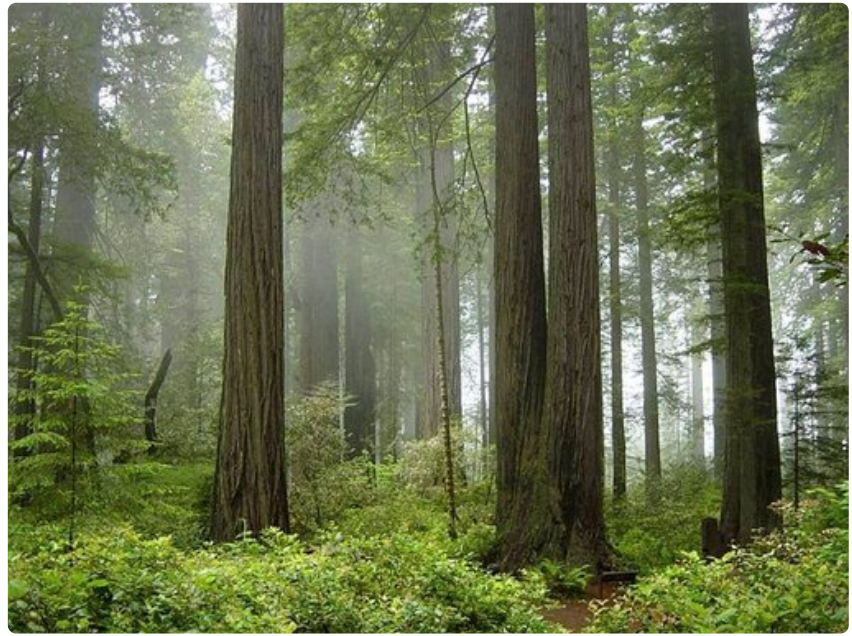
Redwoodin kansallispuisto tarjoaa majesteettisen kokoisia puita.

Mount McKinley sijaitsee Denalin kansallispuistossa Alaskassa. Alueen lähin lentokenttä on Anchorage Ted Stevens International Airport. Luonnonpuistoon järjestetään kesäisin bussiretkiä.