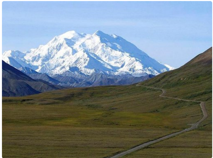
Mount McKinley on Yhdysvaltojen korkein vuori.