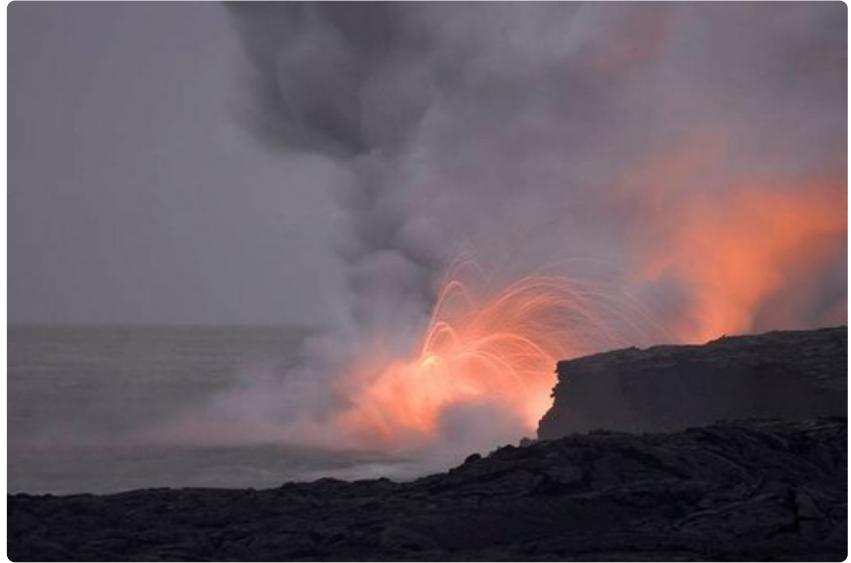
Havaijin laavakentät ovat kuin eri maailmasta.