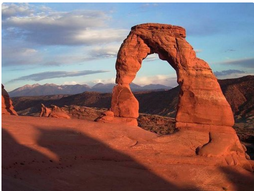
Utahin luonnonsillat ovat kauniita ja valokuvauksellisia.