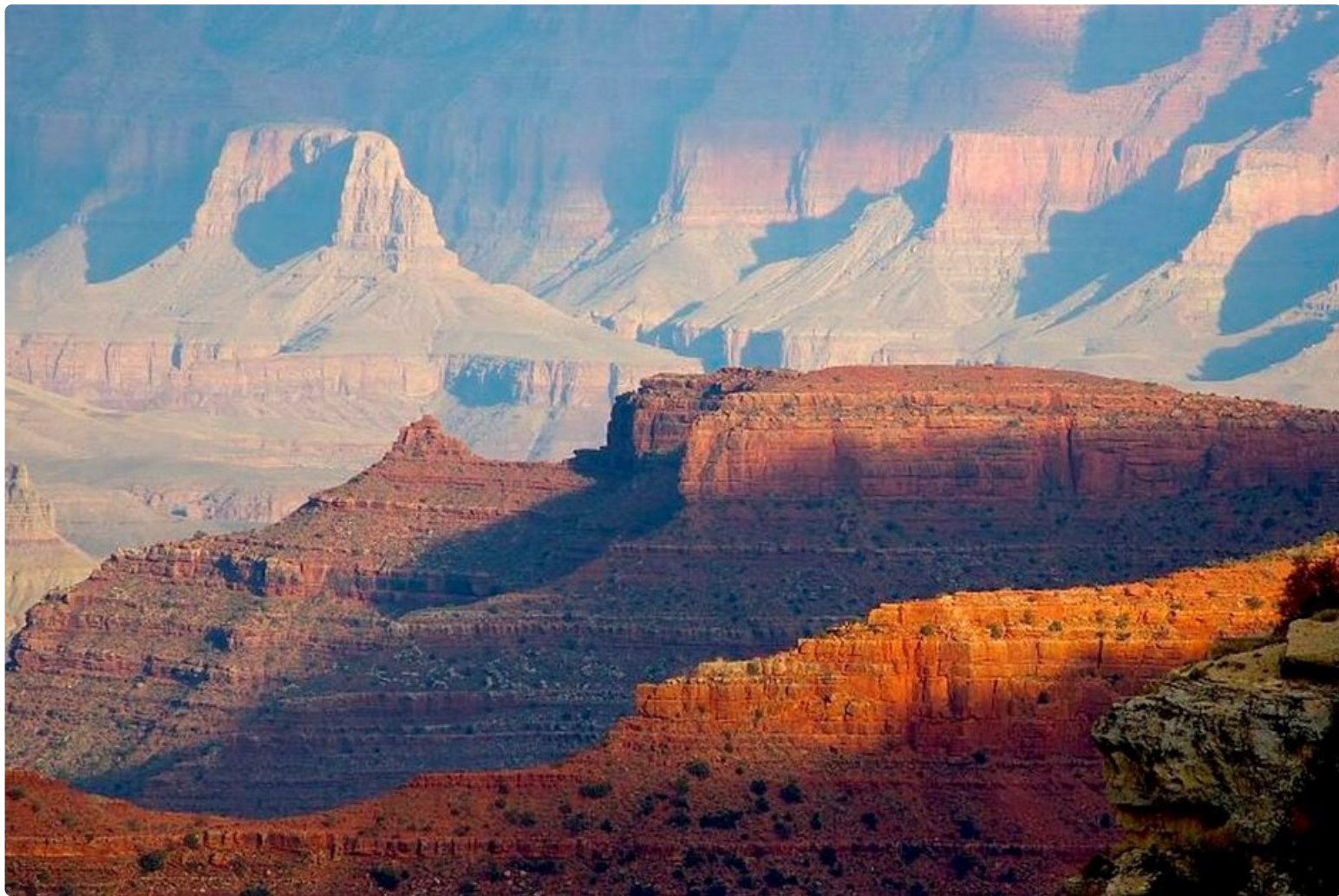
Grand Canyon viehättää kokonsa ja väriensä ansiosta.