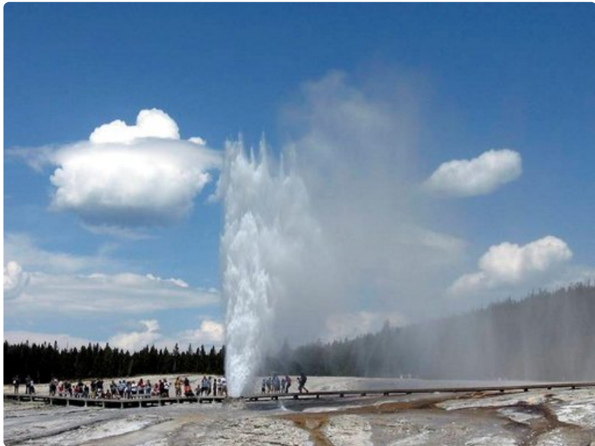
Yellowstonen kansallispuisto on tunnettu ennen kaikkea lukuisista geysireistään.