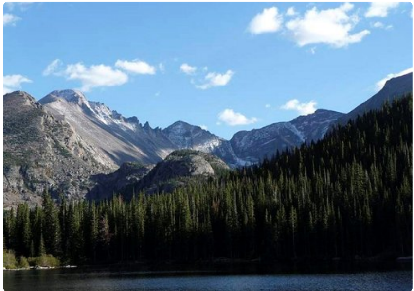
Kalliovuorten kansallispuisto tarjoaa elämyksiä keskellä villiä luontoa.