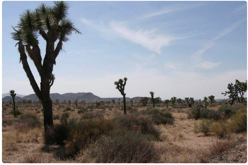
Joshua Treen kansallispuisto on karu mutta monipuolinen kohde.