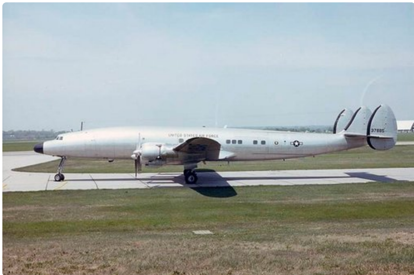
Eisenhowerin 50-luvulla käyttämä Columbine III on esillä Yhdysvaltojen ilmavoimien museossa Ohiossa.

Nixon edusti järjestystä ja konservatiivisia arvoja. Hänen aikanaan Yhdysvallat aloitti vetäytymisen Vietnamista ja laskeutui kuuhan, mutta teki myös yllättäviä avauksia kommunistiseen maailmaan. Helmikuussa 1972 Nixon teki ensimmäisenä amerikkalaispresidenttinä valtiavierailun Pekingiin ja myöhemmin samana vuonna Moskovaan. Joulukuussa 1972 hän sai käyttöönsä uuden koneen, Boeing 707 SAM 27000, joka oli käytössä vuoteen 1990.