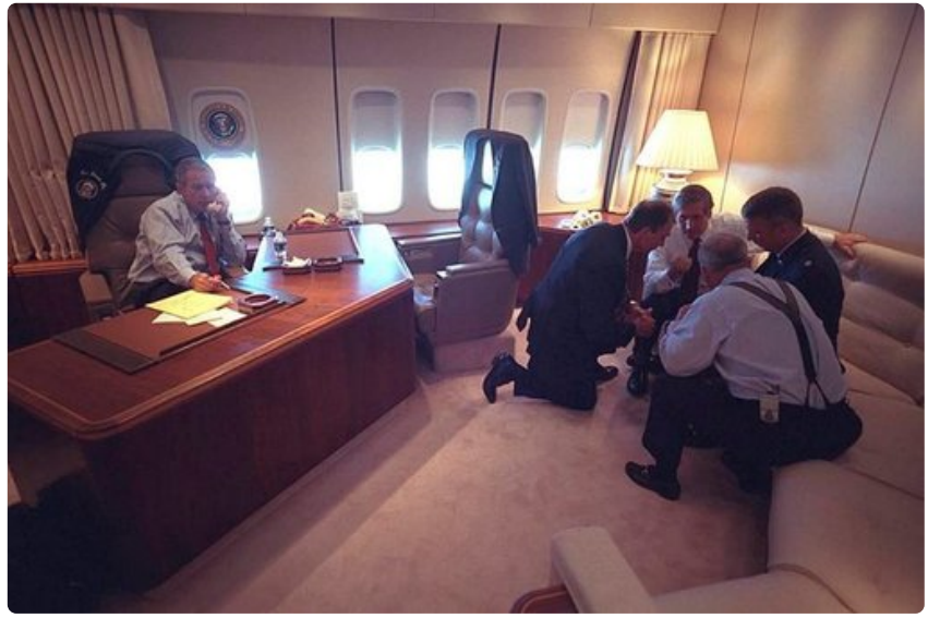
Air Force Onessa oli terrori-iskujen jälkeen intensiivinen tunnelma.

Air Force Onen henkilökunta kunnioitti Reagania, joka noudatti lennoilla kurinalaista rytmiä. Entisenä näyttelijänä hän osasi luonnollisesti myös viihdyttää, jopa pilaila. Presidentti saattoi toisinaan hiipiä valokuvaajansa kanssa koomisissa asennoissa kuten suu auki nukkuvien avustajiensa viereen ja lavastaa näennäisdramaattisia tilanteita, joissa virkamies ei tehnyt muuta kuin torkkui. Reagan lensi Nixonin aikaan käyttöönotetulla suihkukoneella, joka on nykyään esillä Ronald Reagan Presidential Libraryssa Kaliforniassa. Päätös nykyisen jumbojetin tilaamisesta tehtiin kuitenkin jo hänen aikanaan. Loewyn luoma klassinen ulkoasu säilytettiin ennallaan, mutta koneen sisustaminen annettiin Nancy Reaganin tehtäväksi. Viimeisimmän Air Force Onen (ja sen identtisen sisarkoneen) modernin viestintälaitteiston asentaminen tosin kesti niin kauan, että uudesta upeasta koneesta pääsi nauttimaan vasta Reaganin varapresidentti ja seuraaja George Herbert Walker Bush .