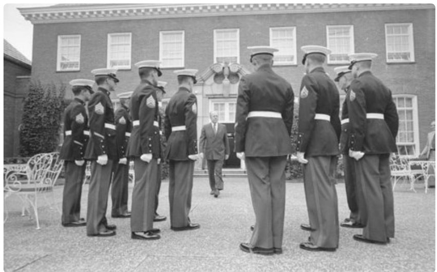
Gerald Ford poistumassa Yhdysvaltojen Helsingin-suurlähetystöstä elokuussa 1975. Suuntana on Neuvostoliiton lähetystö Tehtaankadulla.