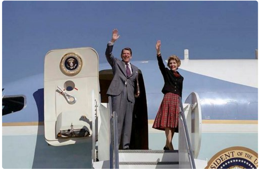
Ronald ja Nancy Reagan heiluttamassa yleisölle vuonna 1981.