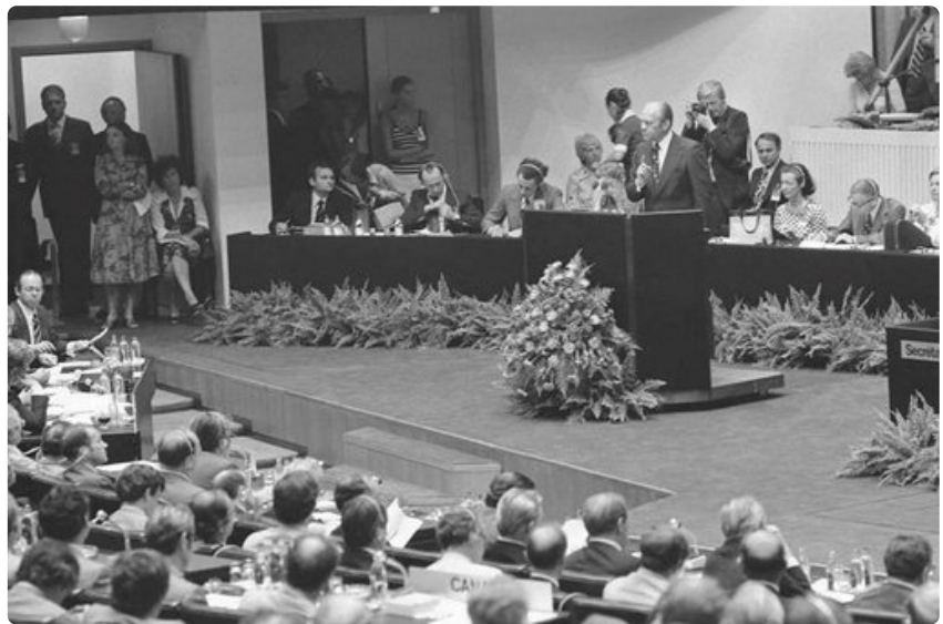
Gerald Ford puhumassa Helsingin ETY-kokouksessa 01.08.1975.