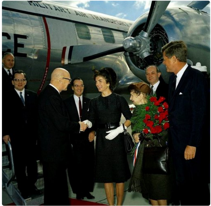
Tyylikäas Kennedyn pariskunta vastaanottamassa Urho ja Sylvi Kekosta kylmän sodan kuumimpana vuonna 1961.