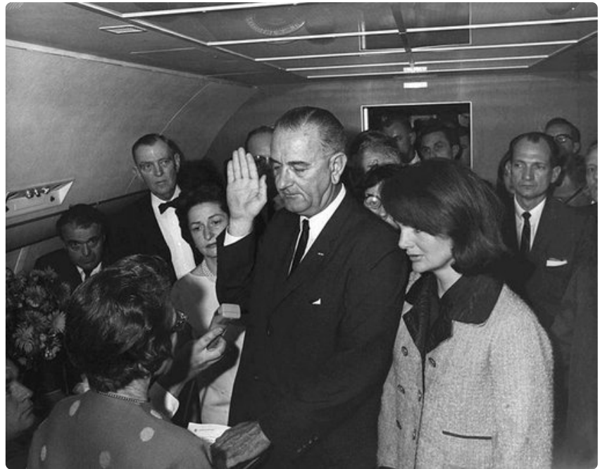
Lyndon B. Johnson vannomassa virkavaltaa Air Force Onessa 22.11.1963. Rinnalla seisoo leskeksi jäänyt Jackie Kennedy.