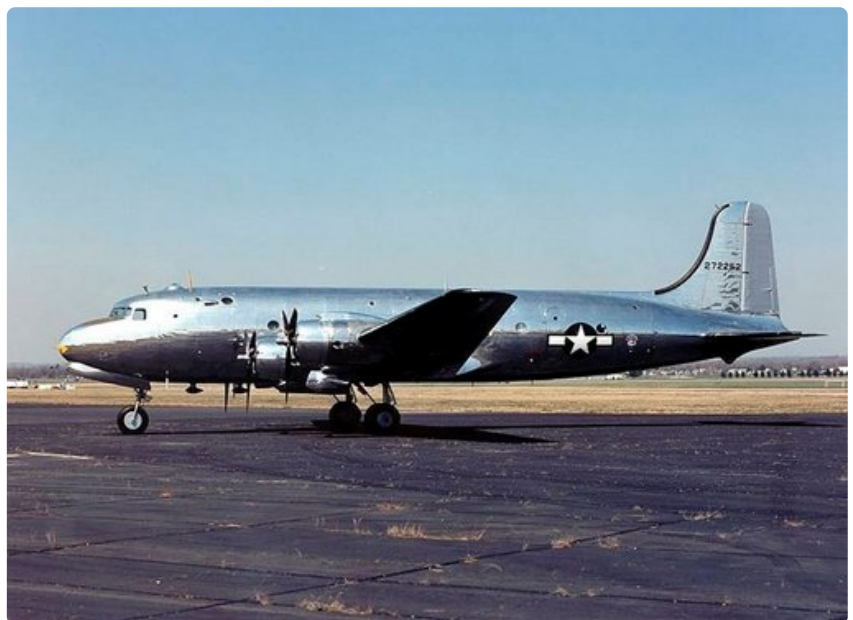
Douglas C-54 Skymaster, jota lehdistö kutsui nimellä Sacred Cow, oli käytössä vuosina 1944-1947.