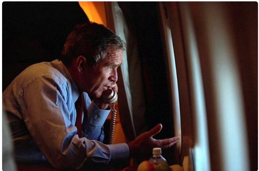
George W. Bush puhumassa varapresidenttinsä kanssa puhelimesta 11.9.2001.