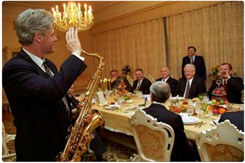
Lukuisia valtiovierailuja tehnyt Bill Clinton innostui toisinaan soittamaan isännilleen saksofonia.

Syyskuun 11. päivä vuonna 2001 kuuluu sekä Yhdysvaltojen että Air Force Onen historian dramaattisimpiin päivämääriin: neljällä kaapatulla matkustajakoneella tehdyissä terrori-iskuissa kuoli tuolloin noin kolmetuhatta amerikkalaista. Uhrien määrä ylitti jopa joulukuun 1941 Pearl Harborin hyökkäyksen, joka oli aikoinaan sitonut Yhdysvallat toiseen maailmansotaan. Presidentti George W. Bush , joka oli aiemman Bushin esikoinen ja virassa tammikuusta 2001 alkaen, sai tiedon New Yorkiin kohdistuneista iskuista floridalaisessa koululuokassa, kesken lukuharjoitusten. The Secret Service wanted to get me to Air Force One, and fast , Bush kirjoittaa muistelmissaan. Presidenttiä lennätettiin päivän aikana ympäriinsä, sillä paluuta Washingtoniin pidettiin liian vaarallisena. Yhdessä vaiheessa jopa presidentin koneen pelättiin olevan mahdollinen terrori-iskun kohde. Angel is next , lentäjälle viestitettiin Valkoisesta talosta. Enkeli oli Air Force Onen salainen kutsumanimi. Tieto osoittautui myöhemmin väärinkäsitykseksi.