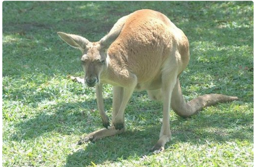
Australian vaakunaeläin on itseioikeutetusti kenguru.