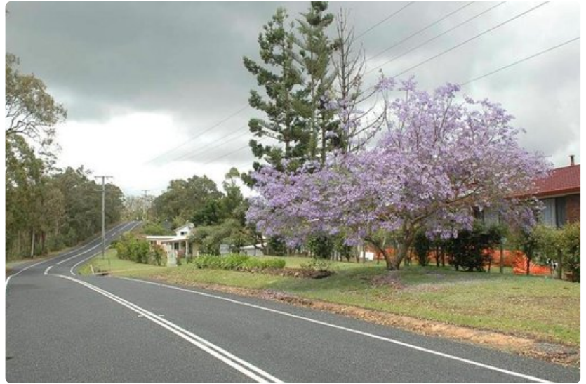
Jakaranda kukkii ennen lehtien puhkeamista. Puu on yleinen eri puolilla Australiaa, mutta alunperin jakaranda on kotoisin Etelä-Amerikasta.