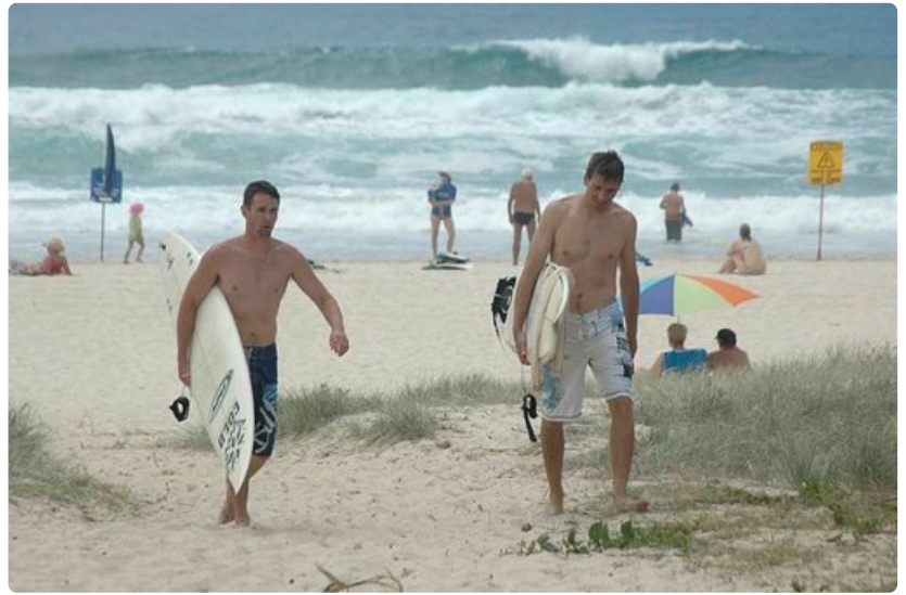
Lainelautailu on suosittu laji Australiassa.

Maa tarjoaa runsaan valikoiman hedelmiä ja vihanneksia, joista muodostuu uusi australialainen keittiö mainioine viineineen. Suurkaupunkien elämä soljuu perinteistä brittiläisistä tapoista noudattaen, joskin sitä värittävät useat alakulttuurit. Kaupasta voi saada kiinalaista nuudeliiruokaa tai kreikkalaisia pitta gyros -annoksia. Monimuotoisuus tekee kulttuurista kiehtovan. Australian tasavalta on löyhästi sidoksissa Englannin kuningashuoneeseen. Maassa on uskonnonvapaus ja niinpä siellä on useita kirkkokuntia katolisista buddhalaisiin. Tulotaso ei ole maailman korkeimpia, mutta verot ja esimerkiksi polttoaineen hinta ovat kohtuulliset. Ravintolassa aterioiminenkaan ei tee valtavaa lovea lompakkoon.