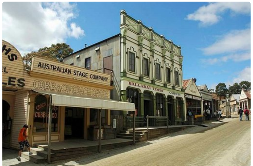
Maa vaalii perinteitään. Ballaratin museokylä on mielenkiintoinen kohde.