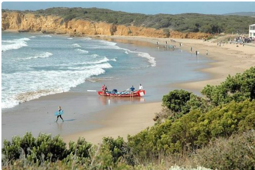
Pelastusvenetoiminta on eräs paikallisten harrastus.

Fremantle toimi satamakaupunkina ja 1800-luvun lopussa Kalgoorliessa koettiin ennennäkemätön kultakuume. Luonnon oudoista ilmiöistä mainittakoon Pinnacles kansallispuisto, jossa on näkyvillä entistä merenpohjaa sekä valtavia hiekkadynejä. Eroosio on hävittänyt pehmeämmän aineksen ja jättänyt pystyyn mitä omituisimman muotoisia puikkoja, pinnacles . Kuljettaessa autolla on muistettava, että matkalla on vain yksi polttoaineen jakelupaikka, muuten osavaltio on tietöntä aavikkoa.