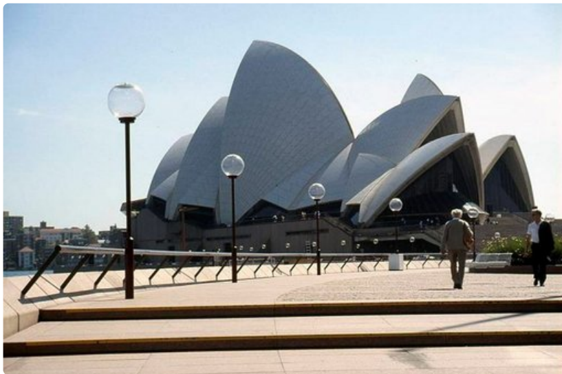
Sydneyn oopperatalo on valmistunut vuonna 1973. Kuuluista rakennus sijaitsee Sydneyn satamassa.

Länteen mentäessä on Sinisiin Vuoriin rajoittuva subtrooppinen alue. Alueen vuosimiljoonainen kasvisto on runsaudessaan vertaansa vailla.