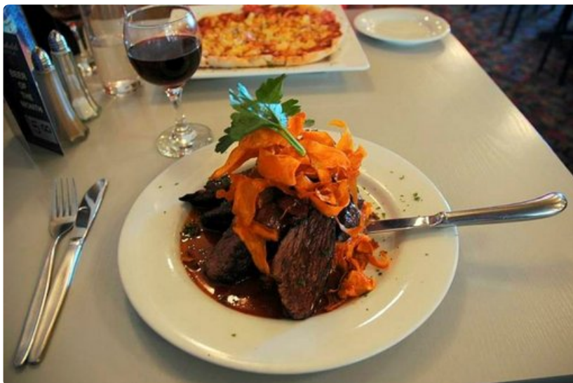
Kenguru on eksoottinen eläin lautasellakin ja vieläpä hyvänmakuinen ja murea.