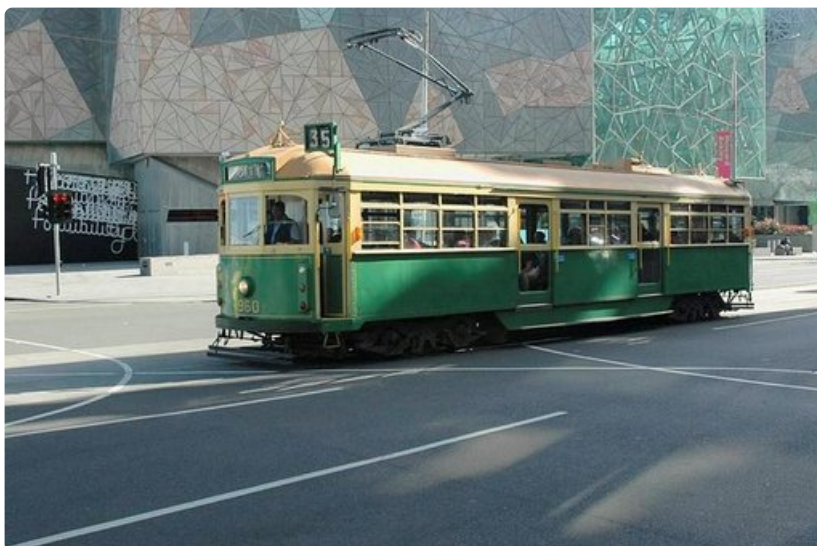
Vanhat raitiovaunut tuovat väriyksellään mieleen Helsingin.