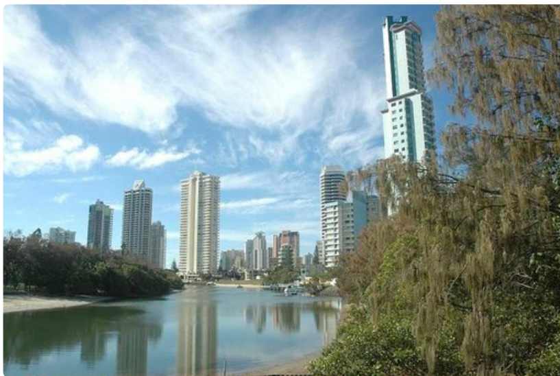
Gold Coastin modernia keskustaa. Ylimmät kerrokset ovat haluttuja näköalan vuoksi.