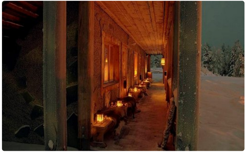
Erämaan keskellä sijaitseva hirsirakennus on tunnelmallinen lomanviettopaikka.

Destination Lapland: Loma-asuntojen vuokrausta Ylläksellä 25 vuotta. Tunturin suurimpia majoittajia 400 asunnollaan. Tarjoaa mökkien kokonaisvaltaisen vuokrauksen ja huollon. Vilkkaimpina vuosina 10 000 kotimaista ja 5000 ulkomaista matkailijaa.