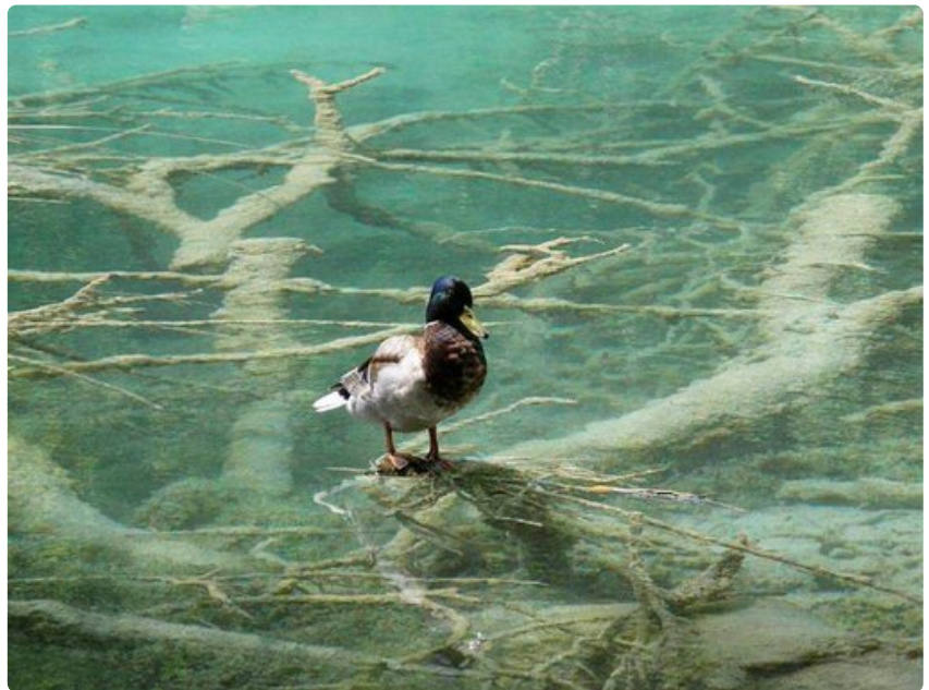
Näyttää kuin vesilinnut seisoisivat vetten päällä.