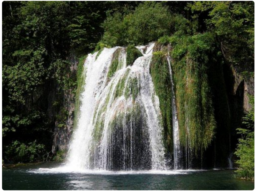
Vierailijan täytyy pidätellä itseään menemästä uimaan putousten alle.

Kroatian rannikko on upea, mutta vierailijan kannattaa tutustua myös sisämaahan. Maaseutu on kaunista ja Plitvicka-järvet kruunaavat matkan. Plitvickan kansallispuiston kaltaista järvimaisemaa ei löydy muualta Euroopasta. Suosittelen lämpimästi.