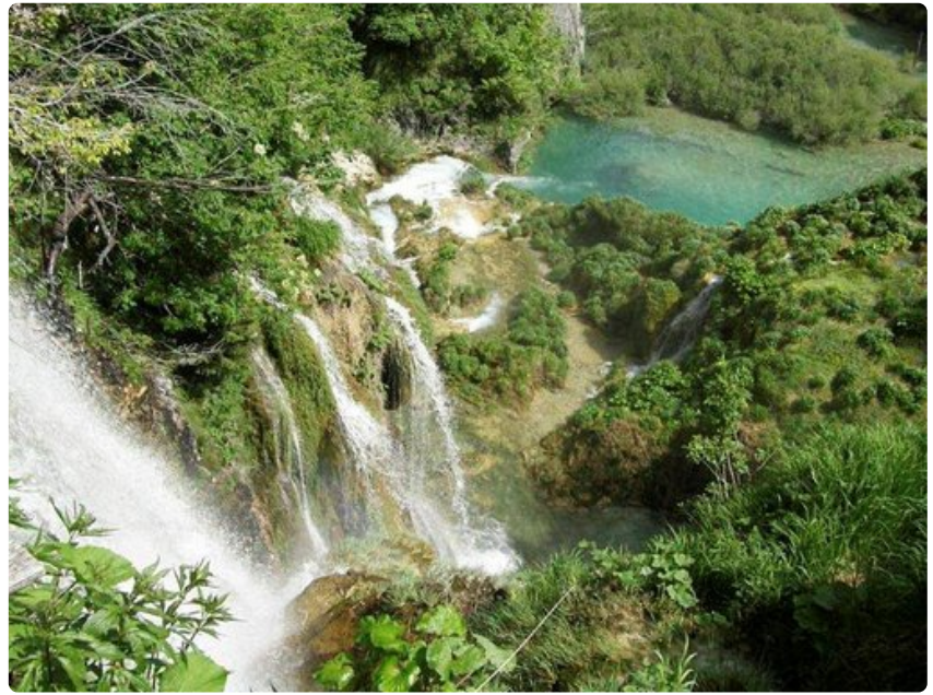
Vesiputoukset muodostavat kauniita altaita järvien väliin.