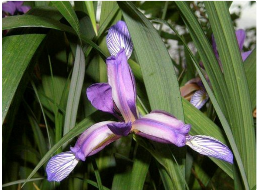
Kauuniit iirikset loistavat väripilkkuina vihreyden keskellä.