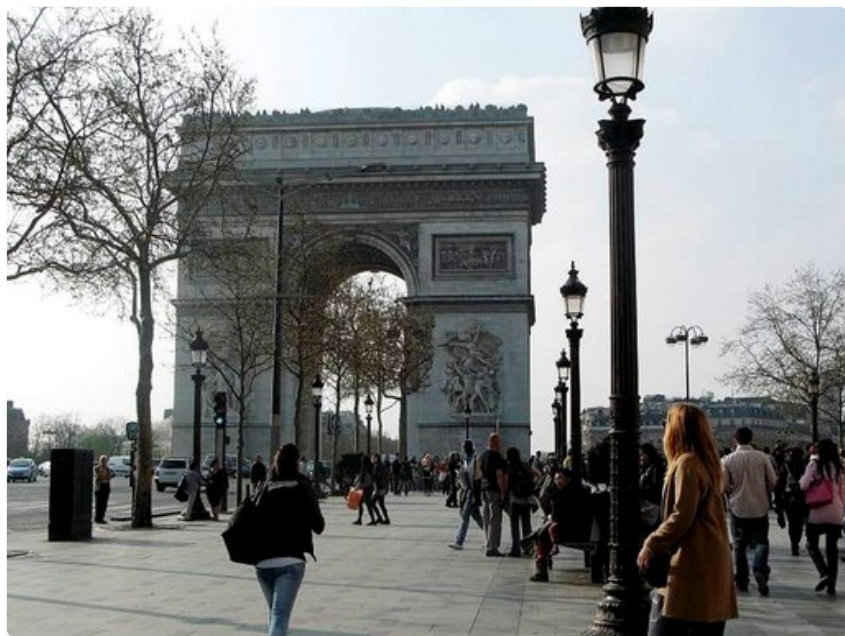
Ilman tarinoita Napoleonista ja Hitleristä Riemukaari ja Champs Elysée olisivat vain omituinen alikulkupaikka ja tavallinen leveä katu Pariisissa.