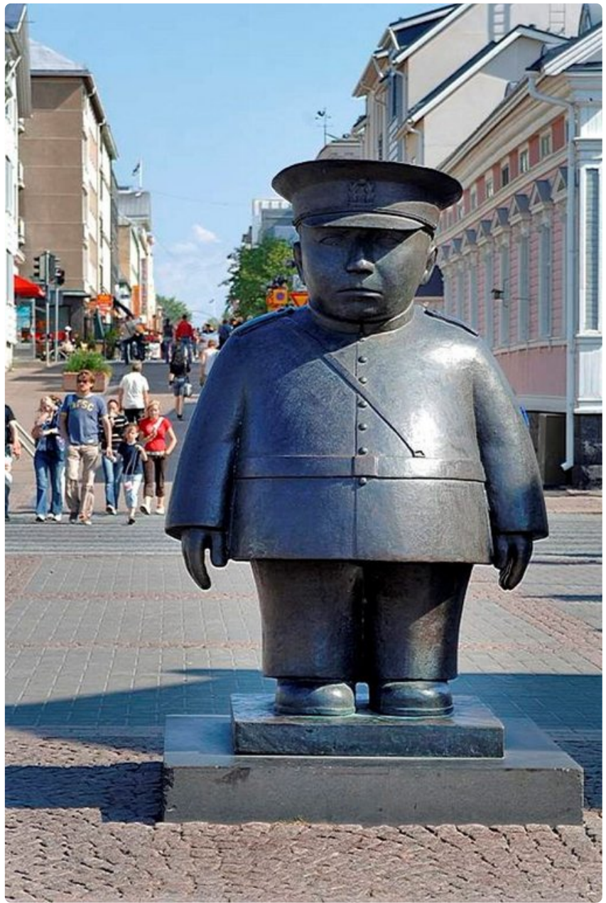
Tervasta Oulu tunnetaan. Miksi sitä ei tuoda esille, Petäistö kyselee.