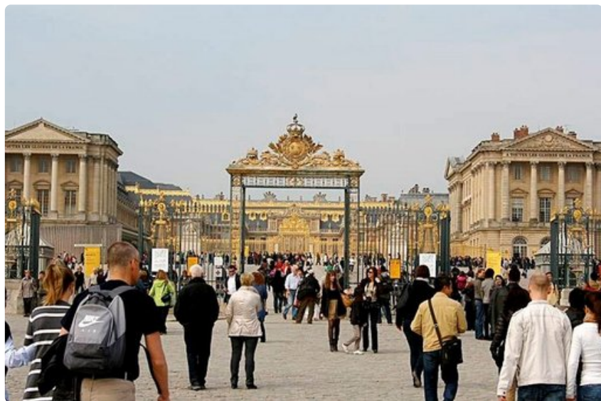
Aurinkokuningas Ludvig XVI hermostui Pariisin juoruilevaan hoviin ja siirsi kuninkaanlinnan 20 kilometriä kaupungin ulkopuolelle Versaillesiin. Ranskan vallankumoukselliset löysivät hänet ja hänen päänsä joutui giljotiinille.