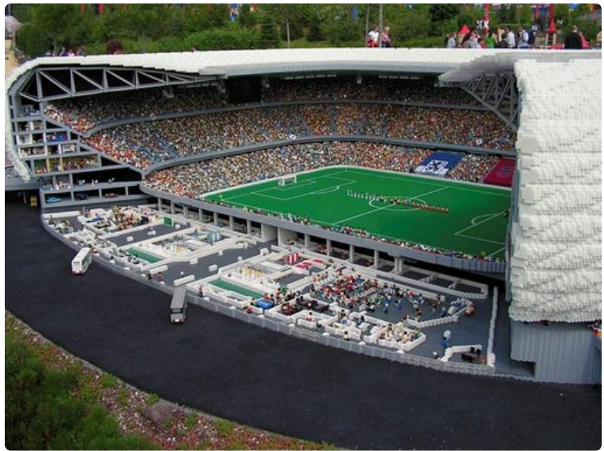
Legolandin rakennelmat hämmästyttävät niin lapsia kuin varttuneempiakin.