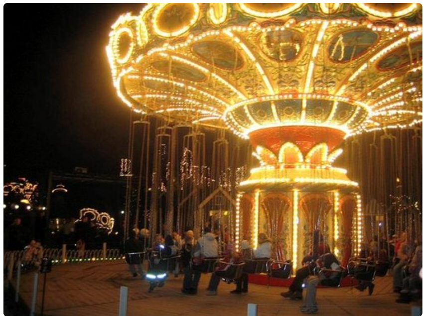
Kööpenhaminan Tivoli tarjoaa entisajan tunnelmaa.