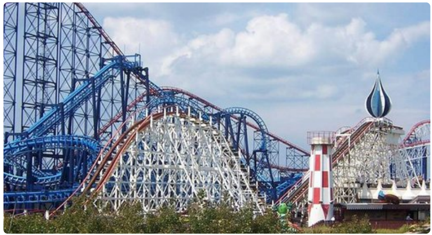
Ei ole vaikea arvata, mistä Blackpool Pleasure Beach on tunnettu.

Englannin suurin huvipuisto sijaitsee leppoisalla Staffordshiren alueella ja sen laitteet kuuluvat Euroopan parhaimmiston. Esimerkiksi Th13teen on maailman ensimmäinen vuoristorata, jonka kohokohta on 20 metrin vapaa pudotus pimeään tunneliin. Muitakin erikoisia laitteita on esimerkiksi kieputtimen ja vesisuihkun yhdistävä Ripsaw sekä aluetta kiertävät gondolijelut. Lisäksi Alton Towers sisältää vesipuiston, puutarhoja sekä monipuolisia esityksiä. Vanhemmat voivat puolestaan kokeilla minigolftaitojaan alueen 9-reikäisellä, varsin ainutlaatuisella radalla. Staffordshire on lähellä Birminghamia, jonne lennot alkaen 240 euroa hengeltä.