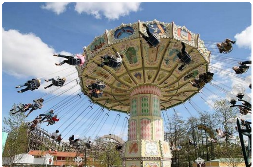
Liseberg on keskittynyt perinteisiin koko perheen laitteisiin.