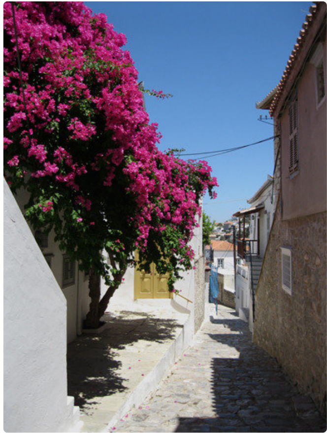
Saaren kapeat kadut johtavat moniin näkemisen arvoisiin kohteisiin.