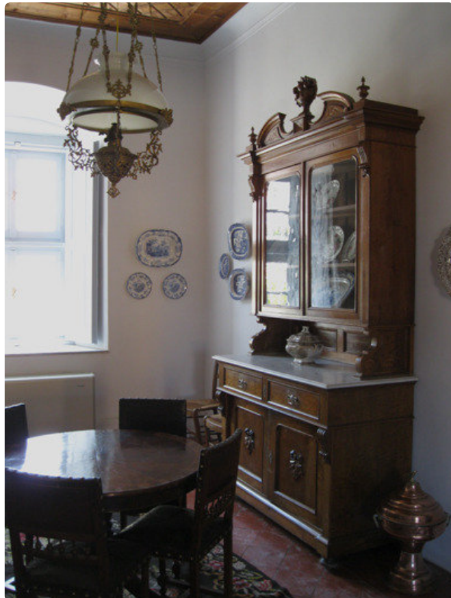
Rikkain saarelainen oli Lazarus Kountourioitis, joka antoi suuren omaisuuden vallankumoussodan onnistumiseksi. Hänen upea kotinsa on nykyään sen ajan huonekaluilla kalustettu museo.