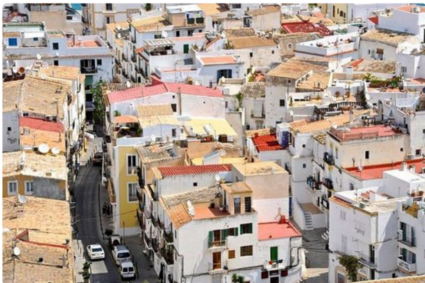
Ibiza Townin Vanhakaupunki on rakennettu 1500-luvulla.