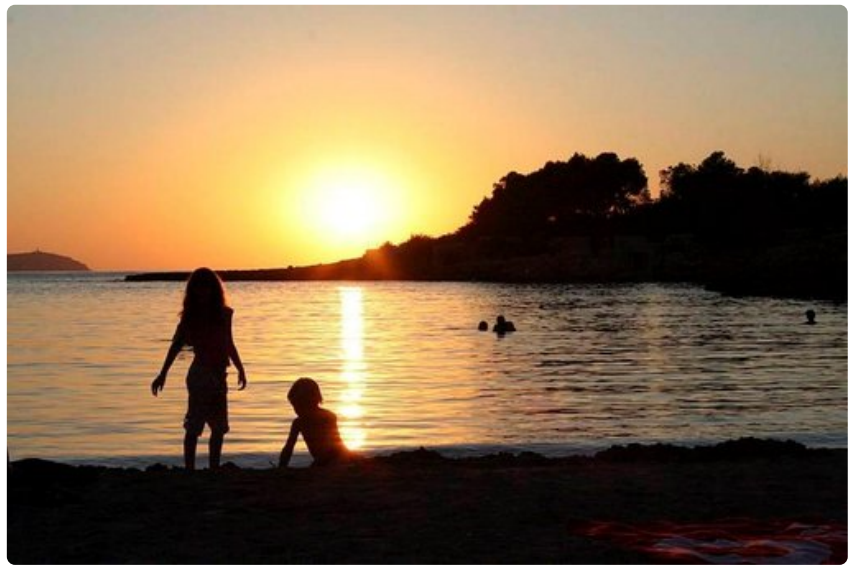
Ibizan auringonlaskut ovat joka kerta sykähdyttäviä.