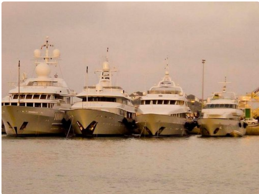
Ibiza Townin laiturin jahdit ankkuroidaan vieri viereen koon mukaan.

o Hintatasoa moniin muihin Välimeren saariin verrattuna