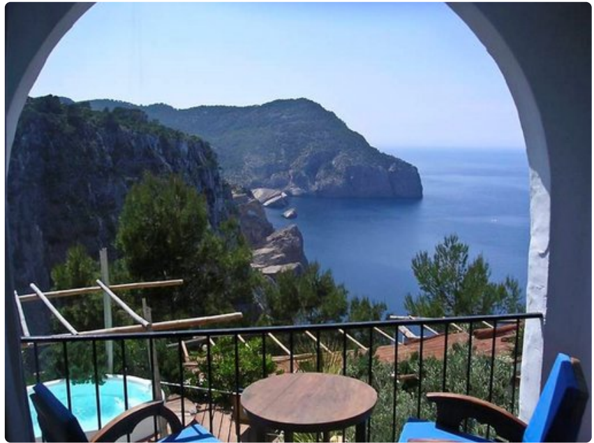
Näkymät hotellilta ovat usein varsin hullepeita.

Kun aamu vihdoon koittaa, niin kaiken kattavan aamupalan pyhiinvaelluskohde on San Antonion ulkopuolella uinuva, julkimoiden suosima Pikes-hotelli. Aamiaisen kanssa kuuluu nauttia lasi kuplivaa omistajan itse rakentamaa allasaluetta ihastellen.