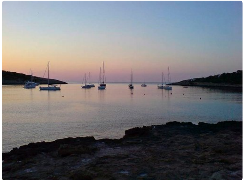
Ibizan rannikolla näkee runsaasti veneitä ankkuroituneina rannoille tai poukamiin.