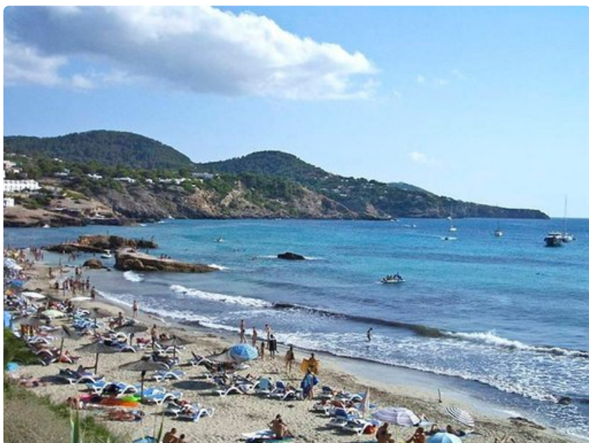
Laadukkaita rantoja riittää yllin kyllin, niitä on peräti 80.