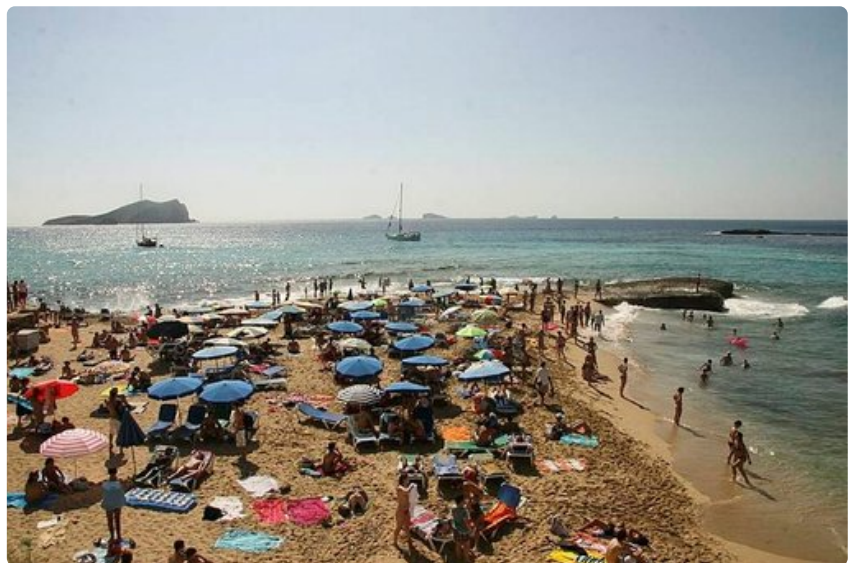
Ibizan rannoilla on varsinkin kesäisin paljon ihmisiä ja tapahtumia.