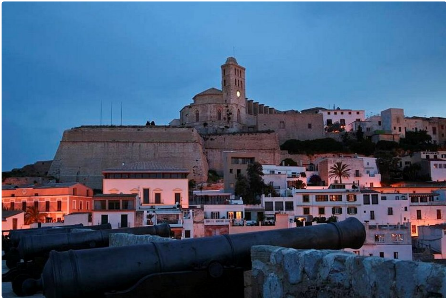
Ibiza Townin Vanhakaupunki illan pimetessä.