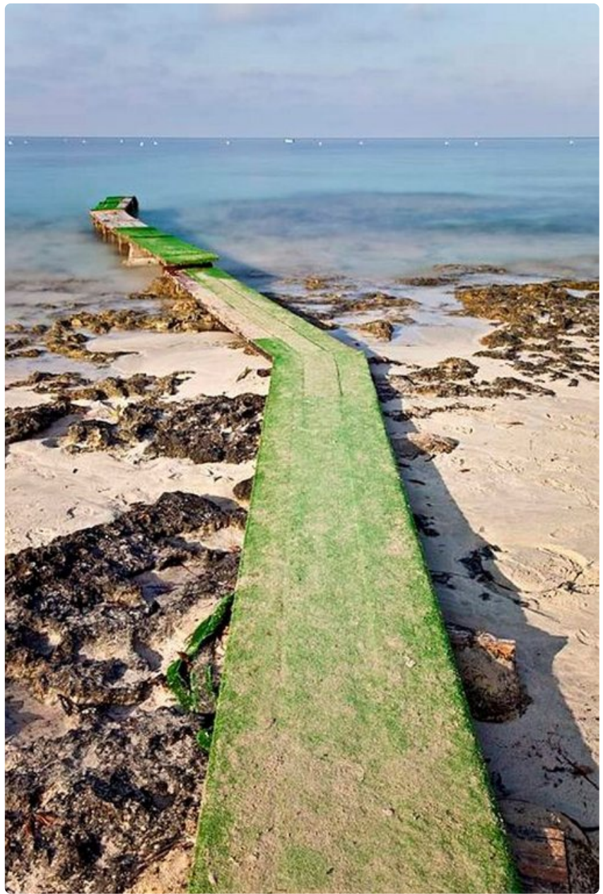
Las Salinaksen suolatasangot ennen kuin ne kesällä kuivuvat kirkkaan valkoisiksi.