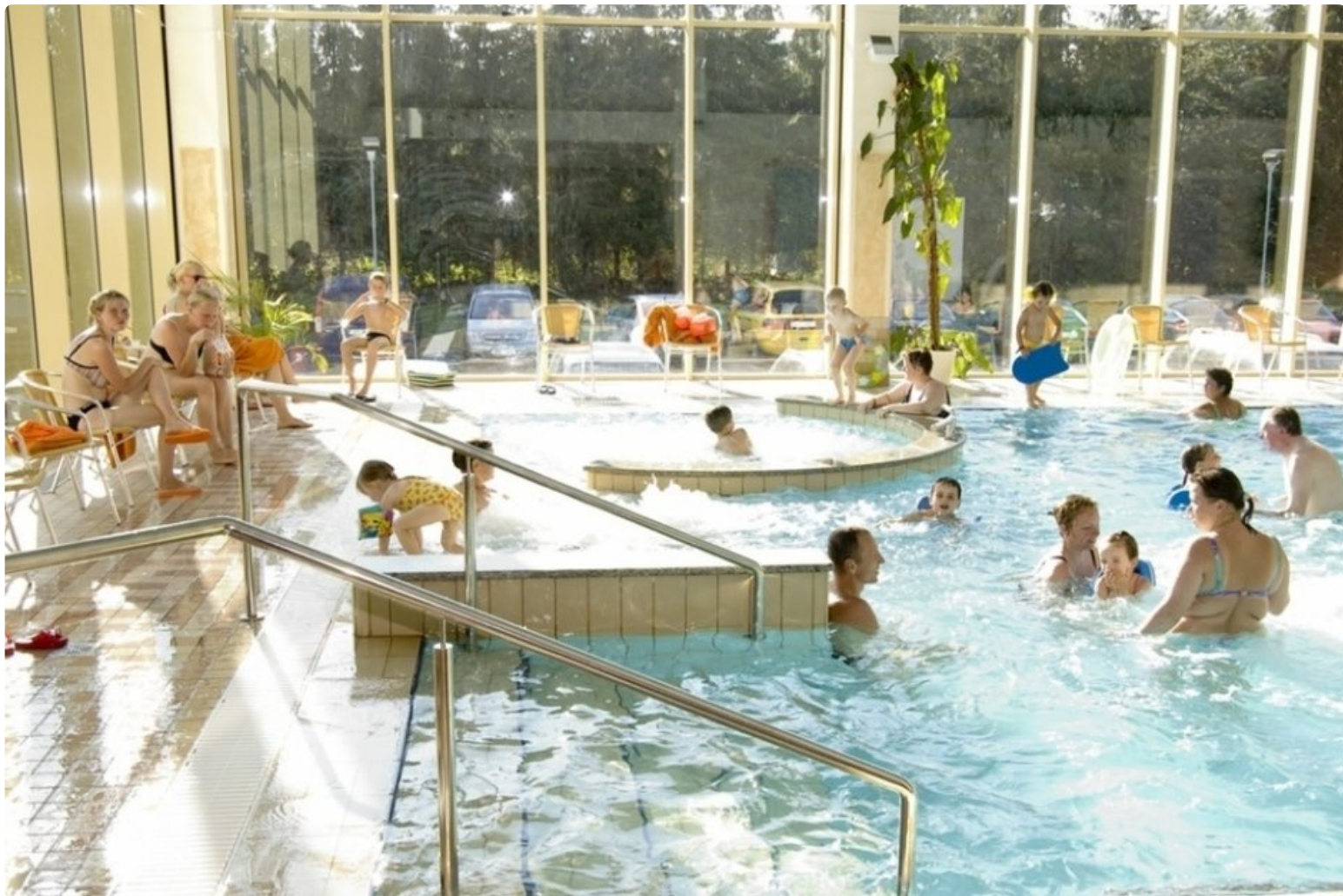
Uima-allasosasto on kylpylöiden keskipiste, niin myös Toila Spassa.