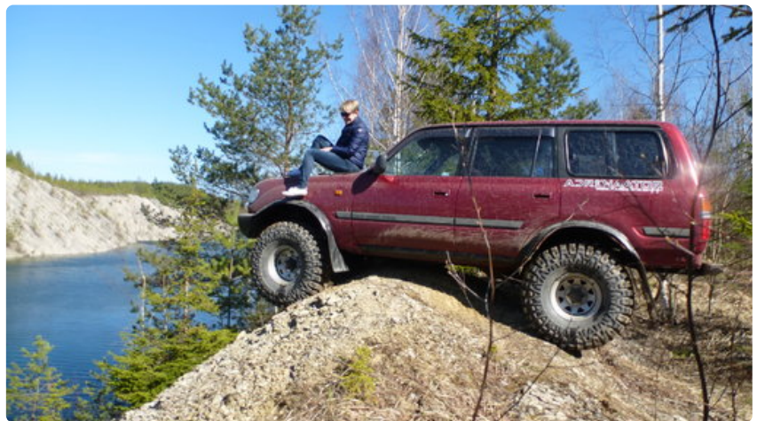
Maastosafari ei ole heikkohermoisille. Näin parkkeerattiin täydessä lastissa ollut maastoauto.