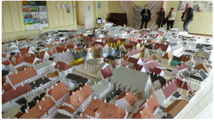
Tarton raatihuoneessa on esillä yhden miehen elämäntyö: Tarton pienoismalli ennen II maailmansodan täystuhoa.