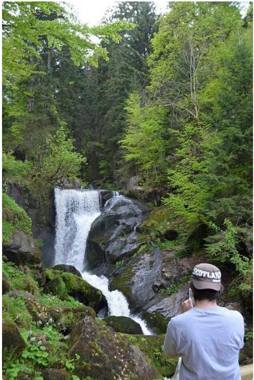
Schwarzwaldin vettä voi ottaa suoraan juomapulloon.