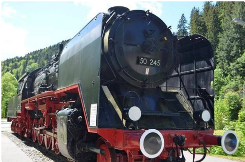
Jos vaeltaa kauas ja väsymys painaa, juna tuo lähemmäksi bussipysäkkiä.