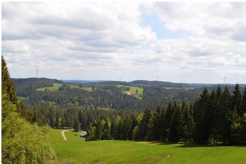
Upeat laaksot, metsät, niityt ja vuoret kutsuvat vaeltamaan.