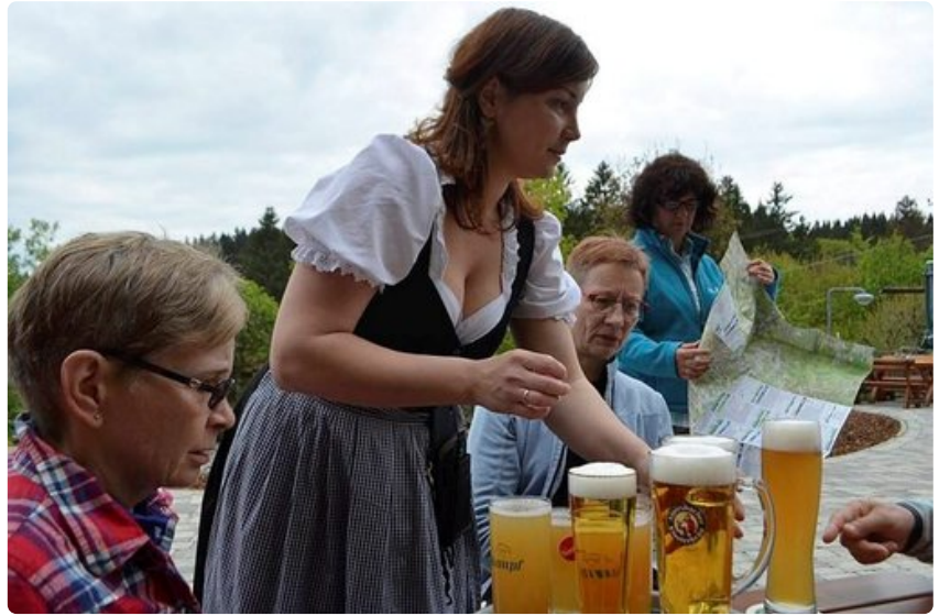
Olutlasillinen maistuu vaelluksen päätteeksi.