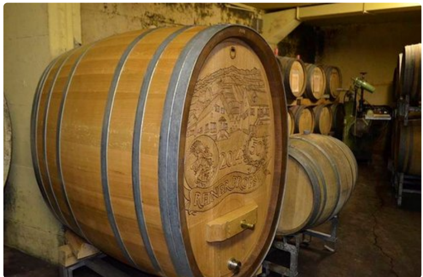
Viini kypsyy tynnyrissä.