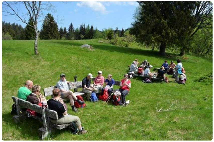
Vaeltajat tauolla luonnon helmassa.