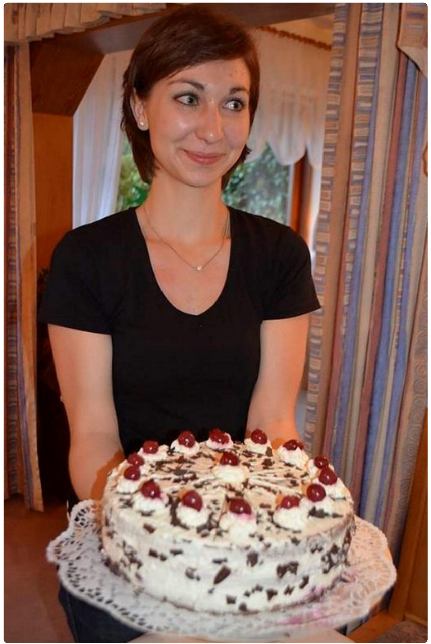
Schwarzwaldinkakku koristetaan kirsikkaviinalla.