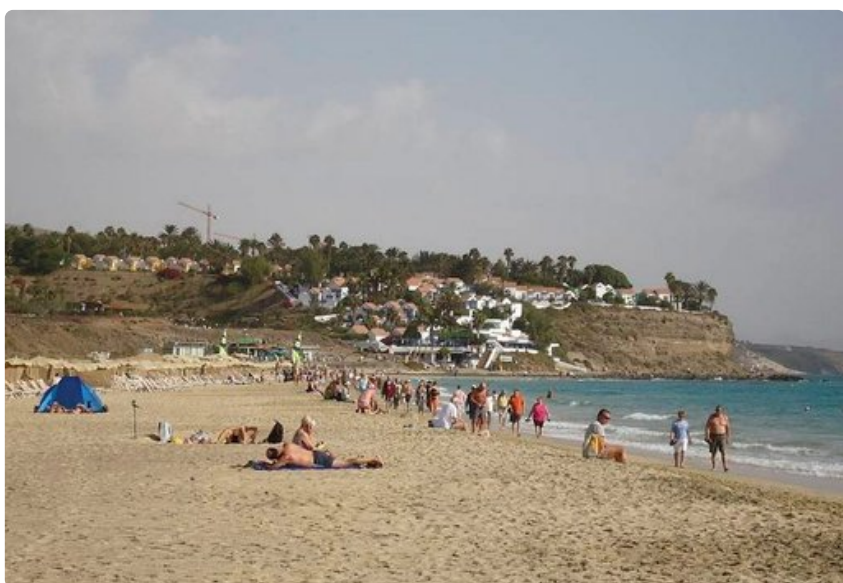
Jandian hiekkaranta on yksi Fuerteventuran suurimmista ja suosituimmista.