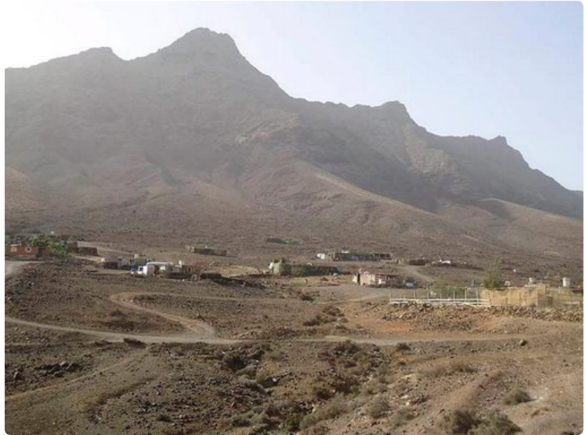
Fuerteventuran pohjoisrannikolla oleva Cofeten kalastajakylä edustaa primitiivistä kanarialaista asumista.