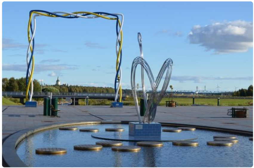
Victoriantori Suomen ja Ruotsin rajalla.