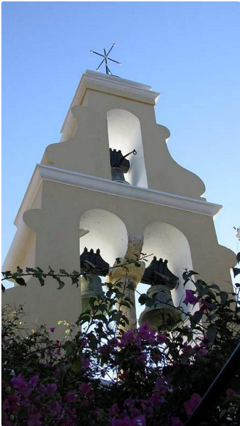
Kolme on ortodokseille tärkeä luku, ja niinpä myös hyvä lukumäärä kelloille

Keskusta on yli sadan saaren päällä ja mantereeseen yhdistävä siltä rakennettiin vasta vuonna 1935. Suurin kulkuväylä on Canal Grande, jonka ylitse pääsee neljää siltää pitkin. Nämä neljä siltää osoittautuvat pian olennaisiksi löytää kaduilla ja kanaalinvarsilla harhaillessa. Vanhin niistä on Rialton siltä. Kuuluista Huokausten siltä on lyhyt, umpinainen dogen palatsista vankityrmään johtava tunneli, jonka kalteroidusta ikkunasta vangit näkivät päivänvalon viimeistä kertaa.