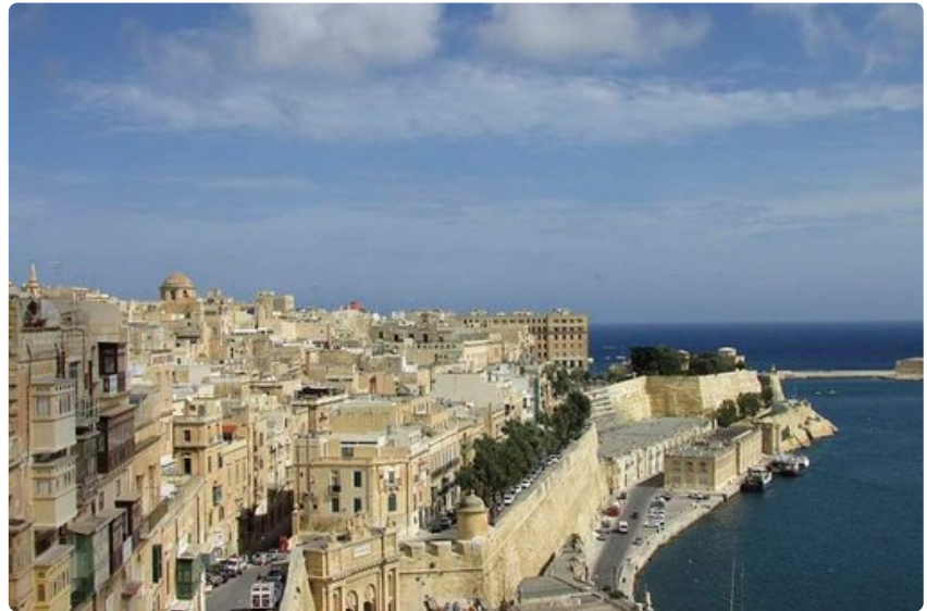
Maltaan saari on hyvin tiiviisti rakennettu.