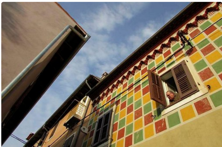
Koperissa on koristeellisia taloja.