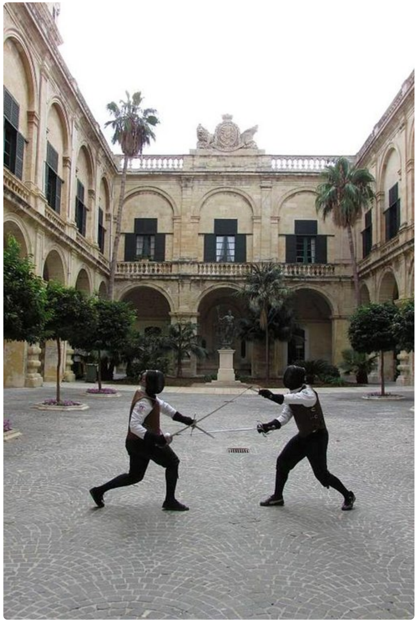
Ritariperinteet näkyvät Maltalla miekkailunäytöksinä.