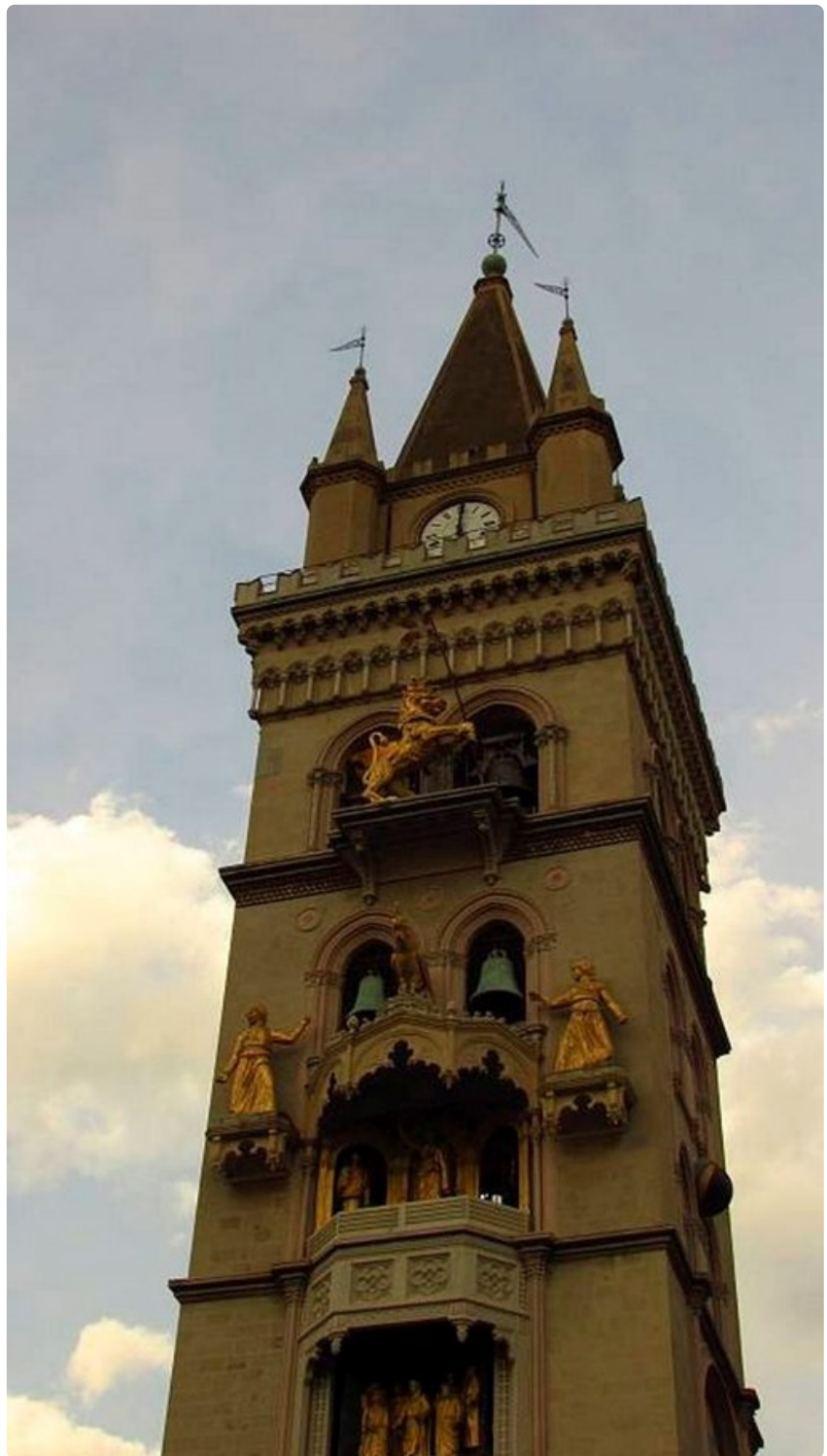
Messinan koristeellinen kellotorni rakennettiin 1930-luvulla.

Etnan matkamuistopuodeissa kaupitellaan vahvaa punaista, yrteillä maustettua vahvaa viinaa. Tämän tuliliemen hinta määräytyy vaihtelevan alkoholipitoisuuden mukaan.