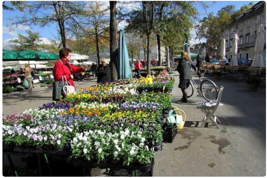
Orvokkiostoksilla Ljubljanan torilla.

Kävelykadulla on tyylikäs ja kreikkalaisen rento tunnelma. Katua reunustava rakennuskompleksi, Liston on ranskalaisten ja Napoleonin ajalta. Aurinkovarjain katetut terassit ovat paikallisten suosimia tapaamis- ja kahvitteilupaiikkoja, ja ne houkuttelevat matkailijaakin pysähtymään hetkeksi ja nauttimaan viipyilevän aurinkoisesta tunnelmasta vaikkapa frappea siemäillen.