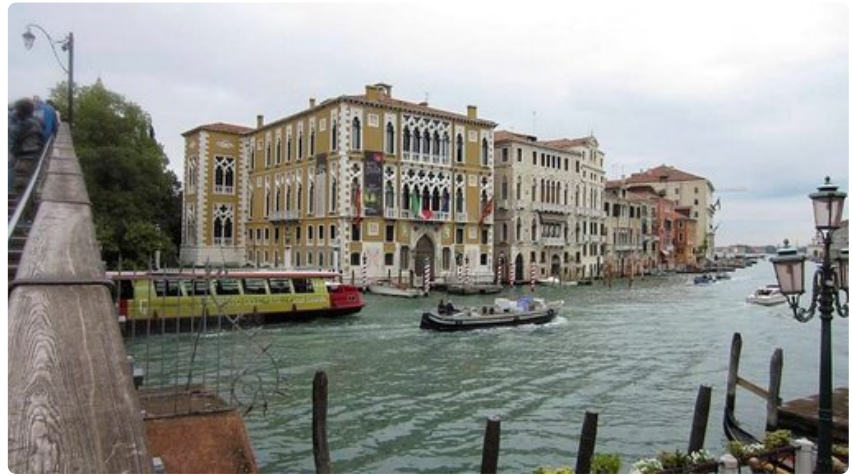
Komeita taloja Venetsian Canal Granden varrella.