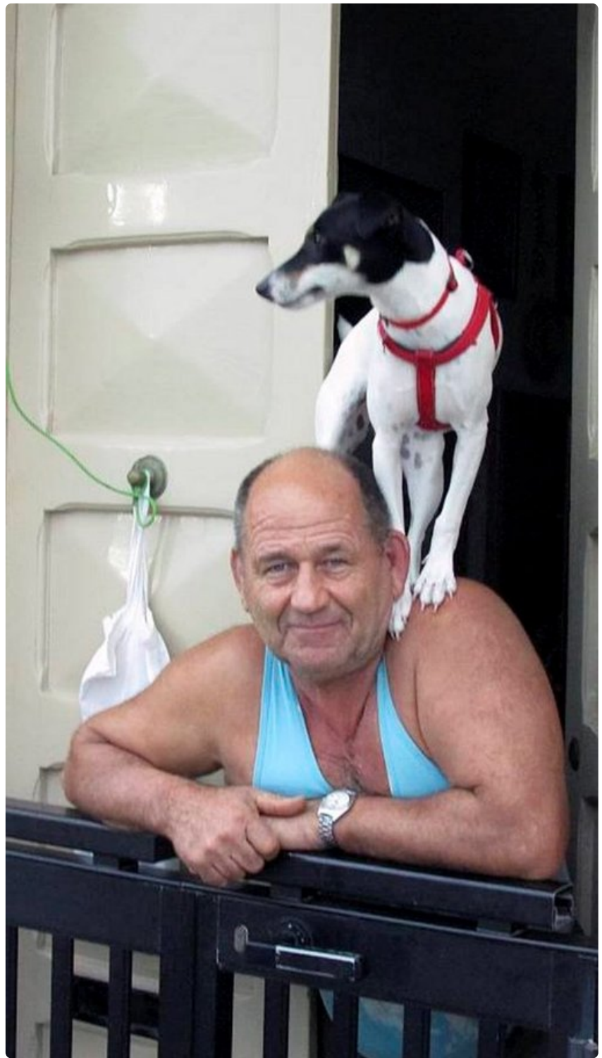
Uusin tutkimus antaa olettaa, että matkustava suomalainen olisi suvaitsevaisempi kuin matkustamista karttava vieraita kansoja ja kulttuureja kohtaan.