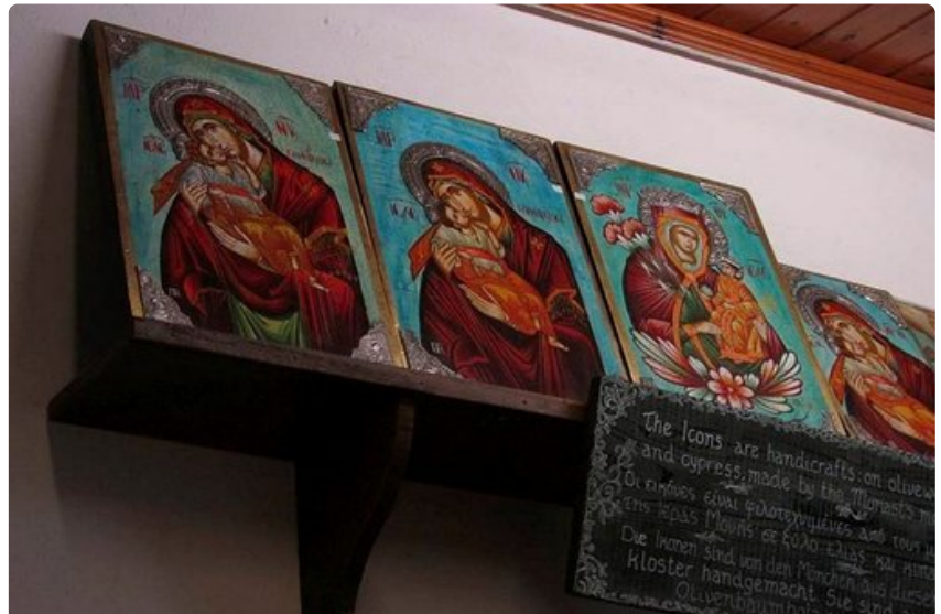
Korfun Paleokastritsan luostarissa myydään matkamuuistoikoneja.