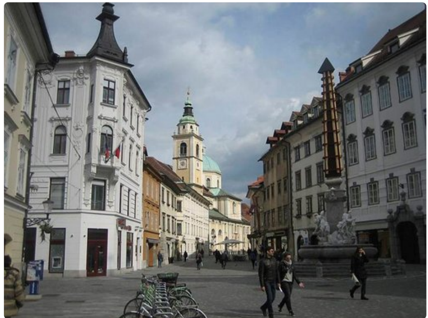
Vanhankaupungin taloja on kunnostettu kunkin aikakauden piirteitä vaalien.