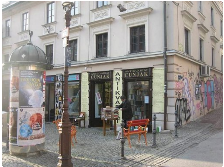
Vanhankaupungin kauppiat virittelevät pihakauppaa jo maaliskuun alussa.