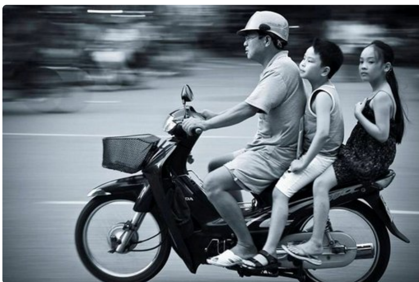
Matkalta palattua kuvat kannattaa käydä heti läpi ja miettiä, miten ne parhaiten esittää.