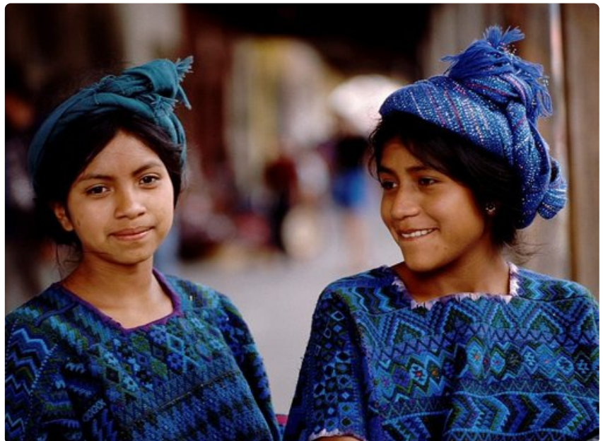
Perinteiset Maya-kulttuurin vaatteet ovat värikkäitä.