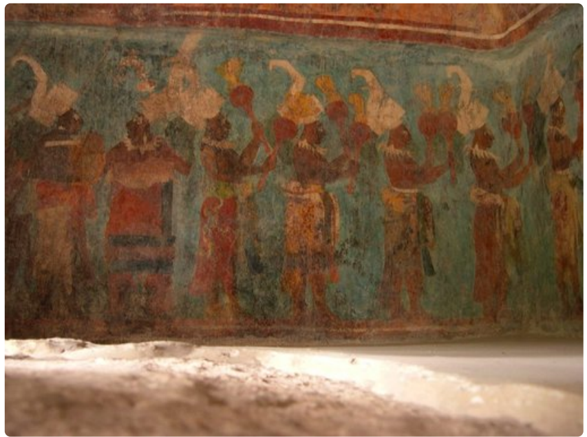
Bonampakin temppelele maalaukset ovat hyvin säilyneet.

Jukataniin niemimaan ohella Campeche, Quintana Roo, Tabasco ja Chiapas tunnetaan maya-kylistään. Paikallisten voi nähdä pukeutuvan värikkäisiin perinnevaatteisiin. Jokaisella kylällä on toisistaan eroavat värit ja rakenne. Nykyään suuri osa kulttuurin perillisistä on katolilaisia, mikä on puolestaan luonut mielenkiintoisia kokonaisuuksia, joihin kuuluvat muun muassa mystiikkaan nojautuvat pyhimykset.