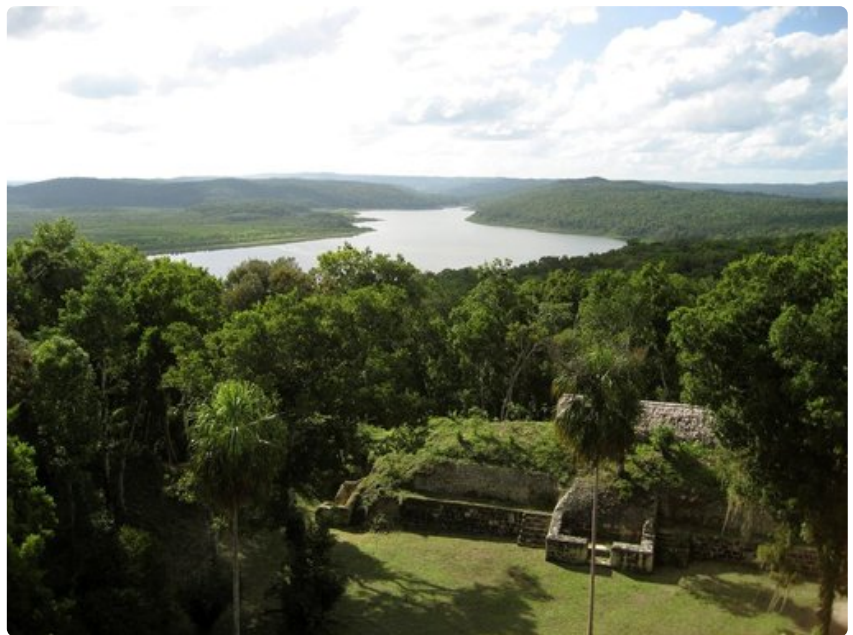
Kaikkia Maya-temppeleitä ei ole viidakoista edes löydetty.