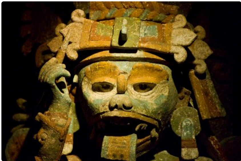
Maya-veistoksissa on usein runsaasti yksityiskohtia.