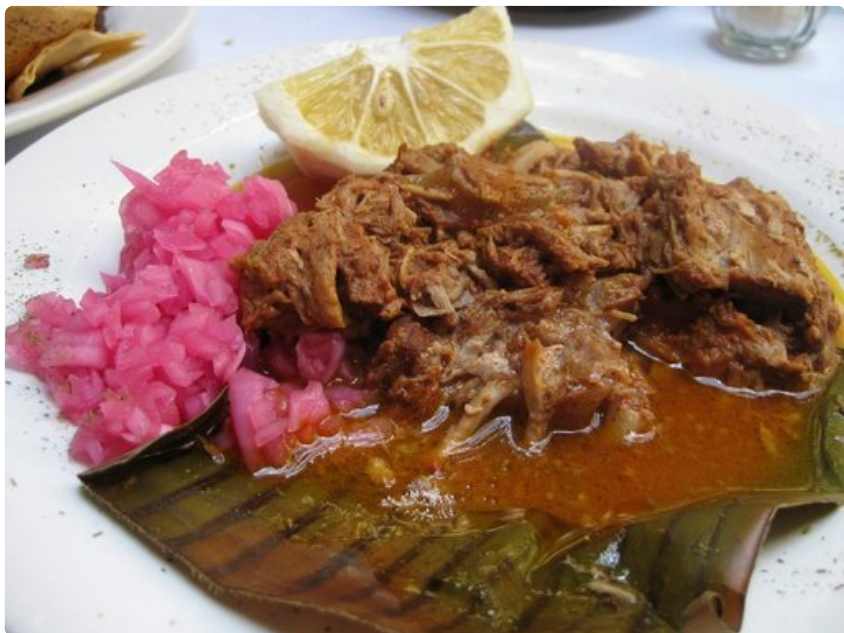
Cochinita pibil on suosittu ruokalaji.