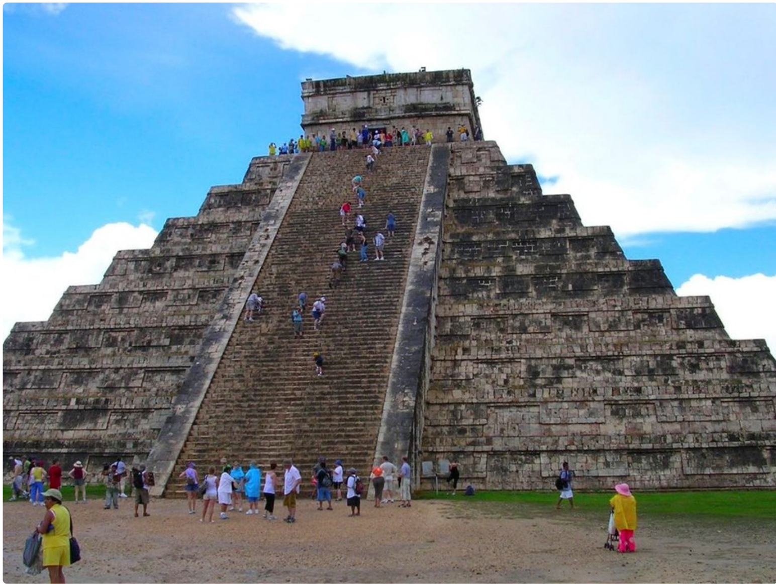
Chichen Itza on Meksikon kuuluisin Maya-temppeli.