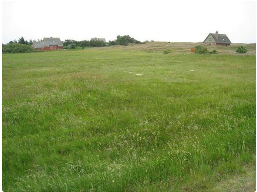
Mandø'n vehreät maisemat houkuttavat luonnonystäviä.