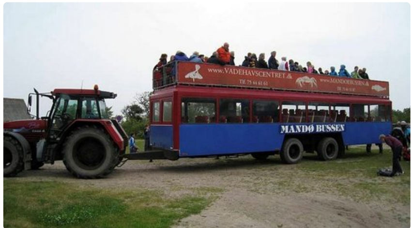
Mandølle matkataan jännittävän traktoribussin kyydissä.