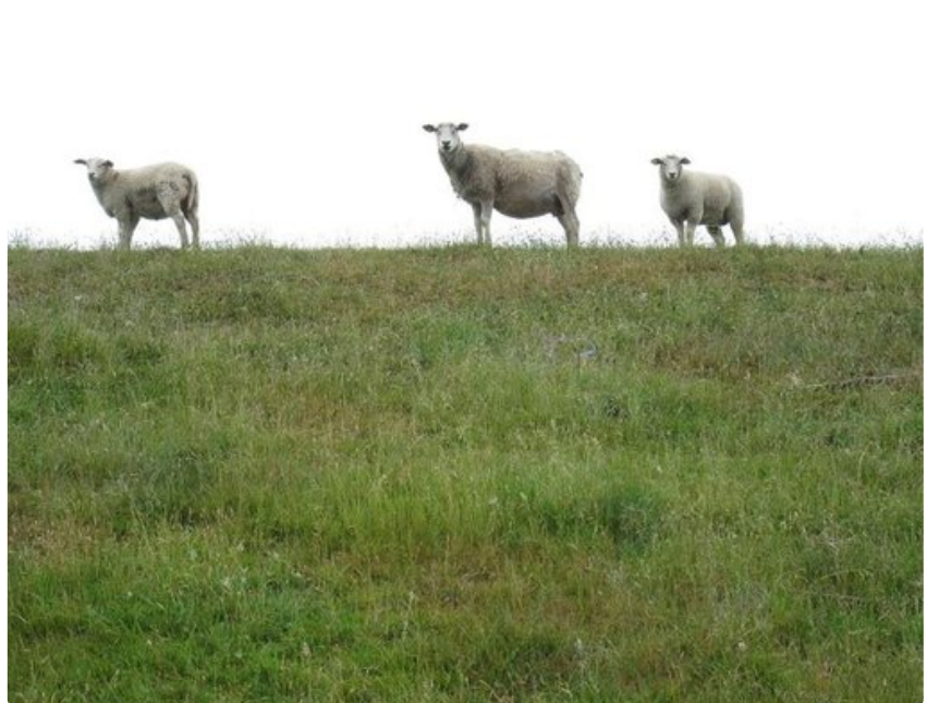
Sadesäessä pyöräilijät ihmetyttävät merenrannalla laiduntavia lampaista.