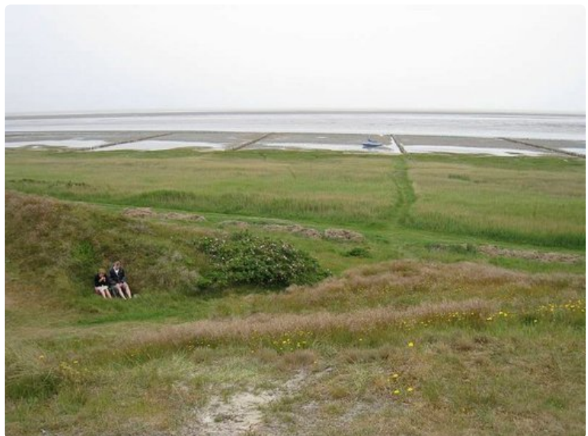
Ulkoilmaelämää parhaimmillaan: eväshetki tuulensuojassa Mandølla.