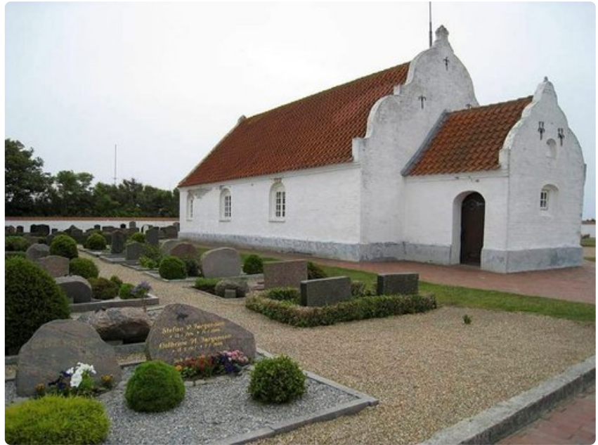
Mandø'n pientä kirkkoa ja hautausmaata hoidetaan huolellisesti.