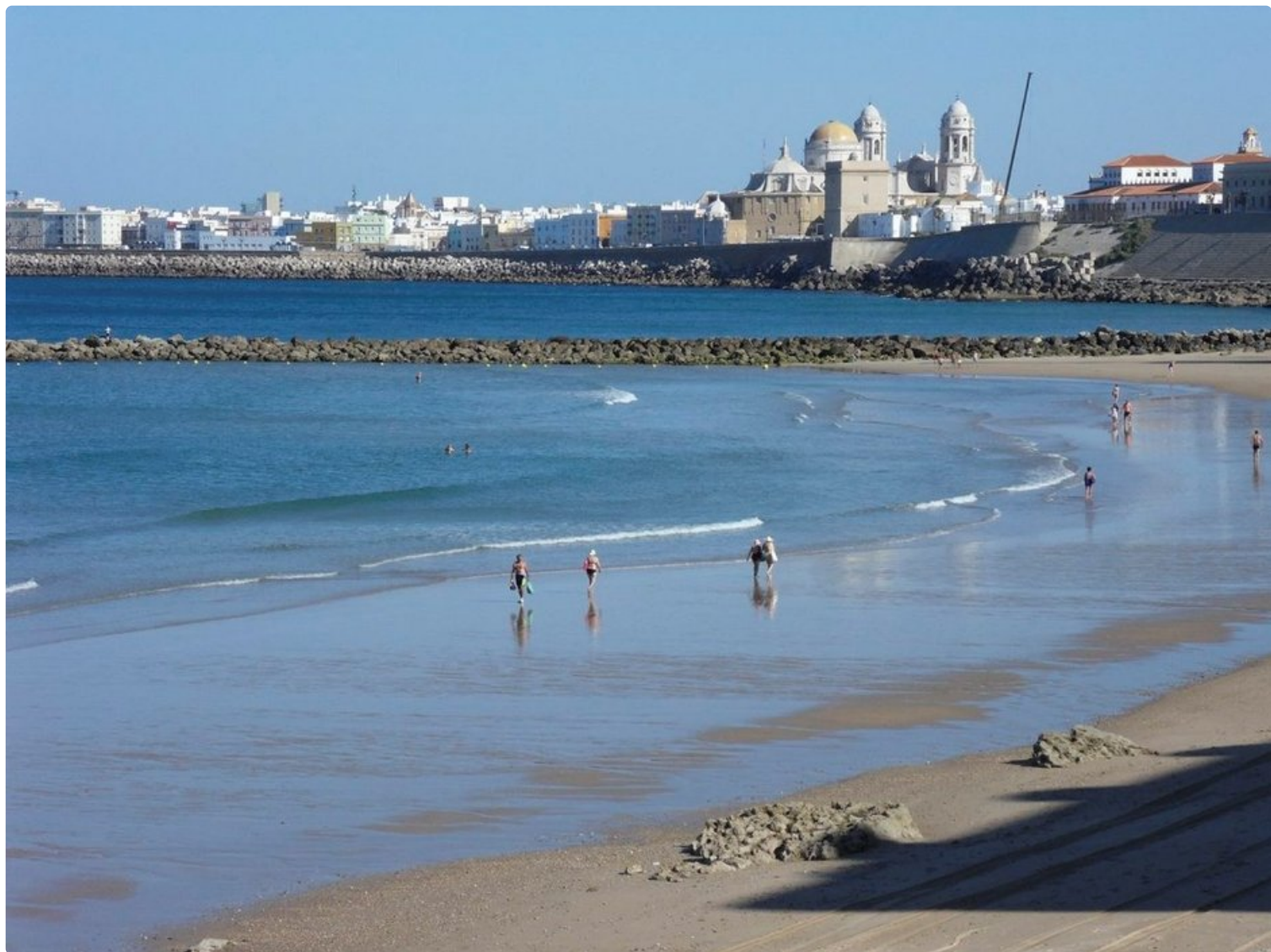
Näkymä Cádizin katedraalille Playa la Santa Maria del Mar -rannalta.