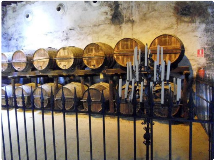
Tio Pepe on Jerezin kuuluisin viinitalo.