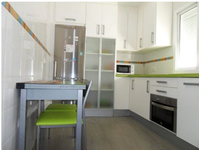
Keittiö Cádizissa on moderni ja toimiva.

Nerjaan on 50 kilometriä Malagasta, josta sinne pääsee helposti Alsa-yhtiön busseilla. Matka kestää 1-1,5 tuntia.