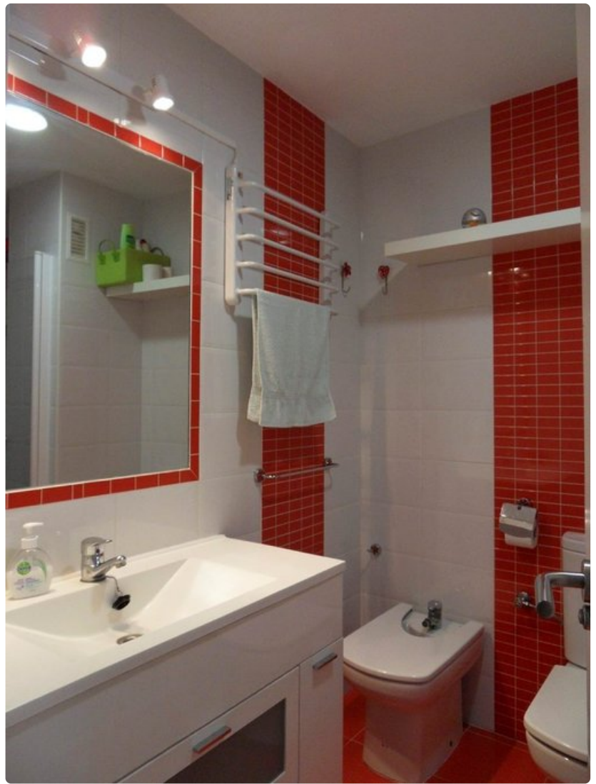
Cádizin asunnon kompaktissa kylpyhuoneessa on kaikki oleellinen.

Cádizissa on kaunis Vanhakaupunki, upea katedraali ja muutamia museoita, mutta suurimman kulttuurilämyksen tarjoaa perjantaisin paikallisen flamencon kehto Peña Flamenca la Perla. Flamencon lyriikoissa vilahtelevat yksinäisyys, kaipaus ja rakkaan kuolema. Laulu on kirkasta ja puhdasta. Intensiivisimmät kohdat innoittavat asiantuntevan yleisön spontaaneihin olé-huudahduksiin, ja itse kukin pyyhkii silmäkulmiaan. Välillä lauletaan kepeämmin, ja rytmintaputtaja tai laulajan äiti innostuu tanssimaan villisti. Paikalta poistutaan Cádizin lämpimään yöhön itkeneenä ja nauraneena, janoten jo seuraavaa tunteiden täyttämää iltaa.