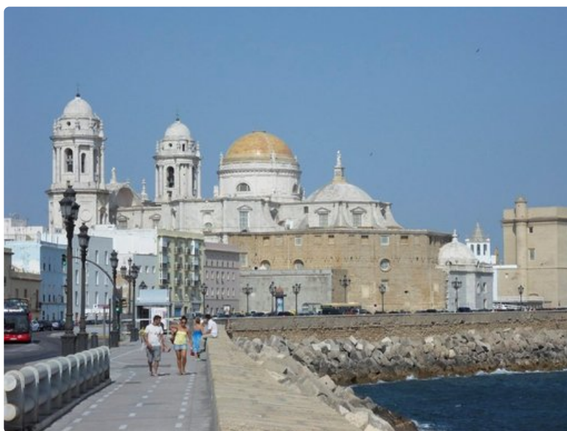
Barokkityylinen Cádizin katedraali on Atlantin rannalla.