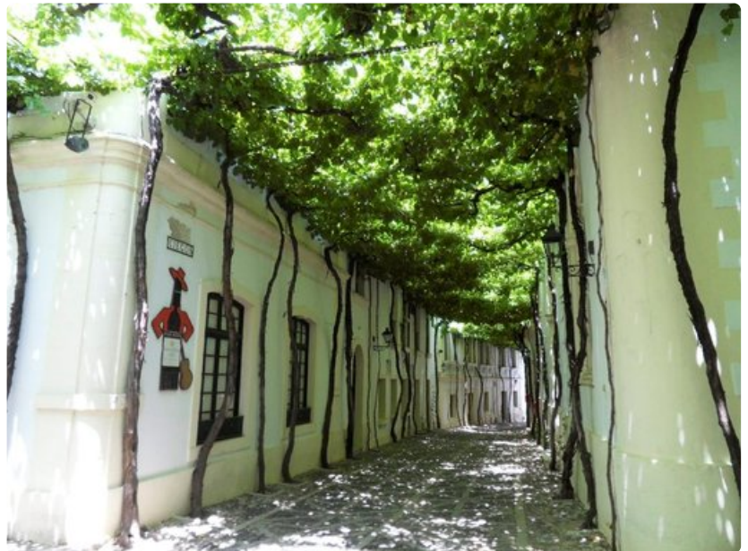
Viiniköynnökset koristavat bodegan pihaa.