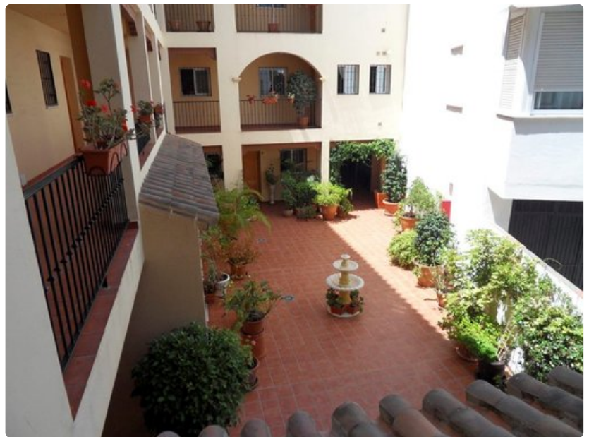
Nerjan asunnon sisäpiha on kaunis.