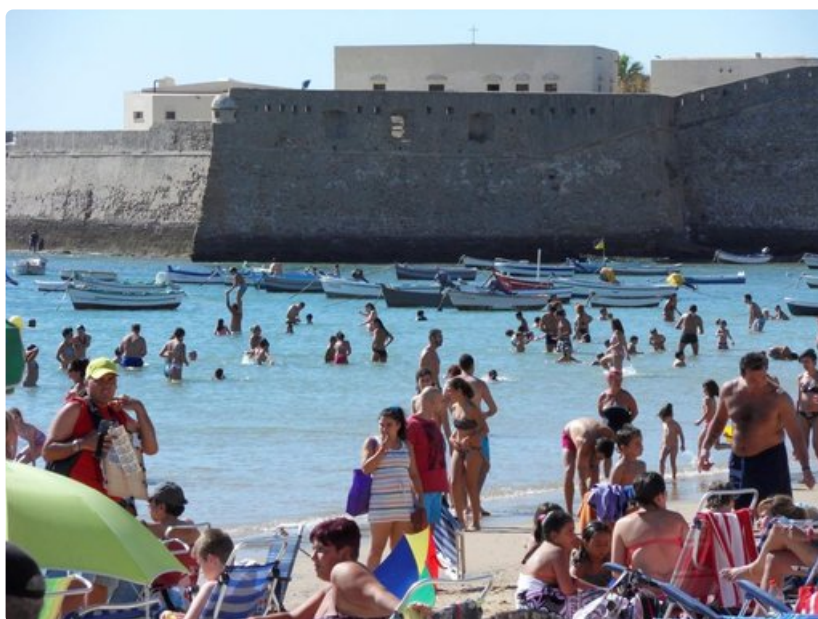
Suojaisia kaupunkiranta Playa de la Caleta ja Santa Catalinan linnoitus.