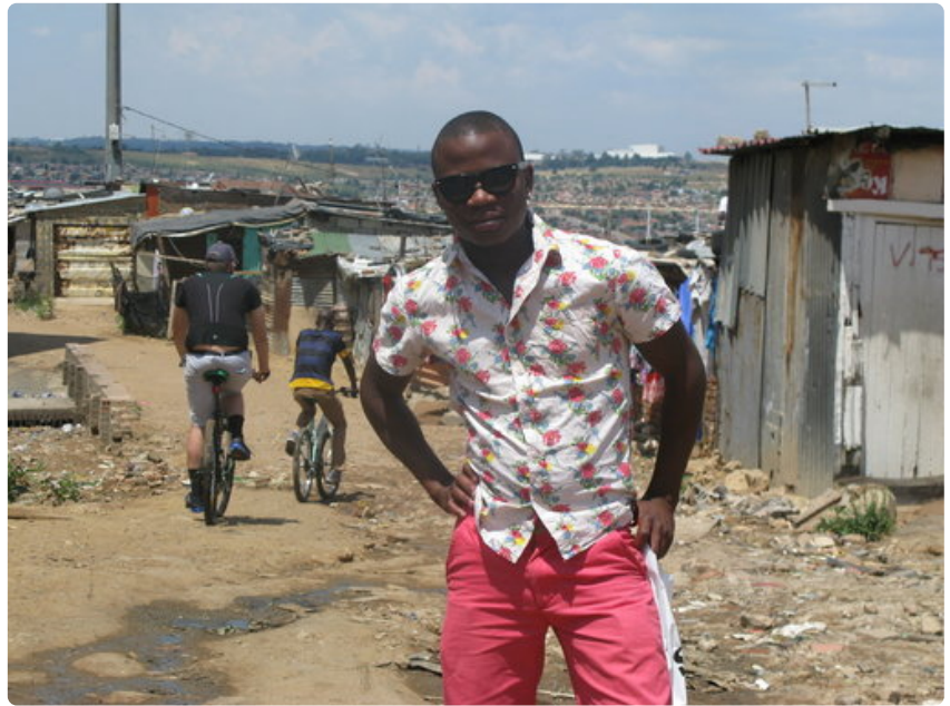
Alexandra on yksi Etelä-Afrikan vanhimmista hökkelikylistä

- Kaverit kertoivat, että tänne pitää tulla. Tänne tullaan syömään ja juomaan hyvin ja viihtymään ja tietenkin näyttäytymään, he toteavat.