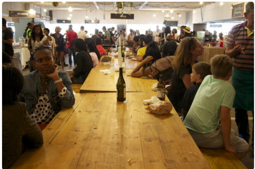
Neighbourgoodsin markkinoilla kohtaavat kaiken ikäiset ja sinne tullaan paitsi ostoksille myös viettämään aikaa.