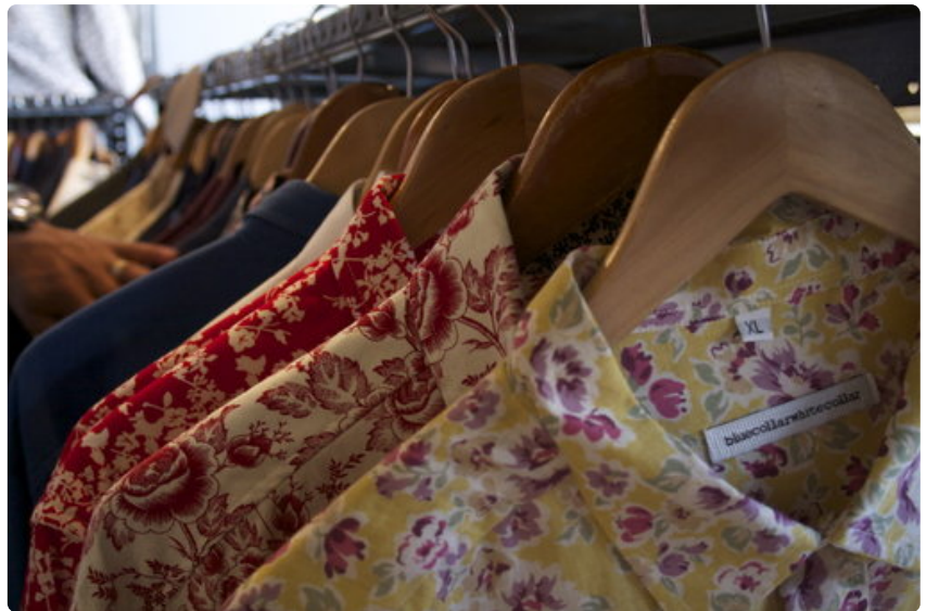
Blue Collar White Collar valmistaa niin värikkäitä kukkakuosipaitoja kuin perinteisempiä valkoisia pukupaitoja.