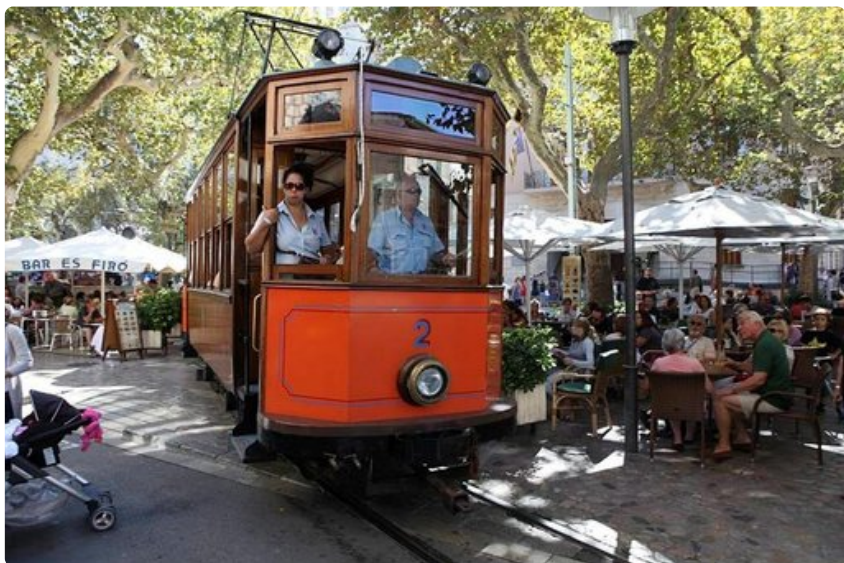
Museoratikka on saapunut vilkkaaseen Solleriin, joka lauantaisin täyttyy markkinaväestä.