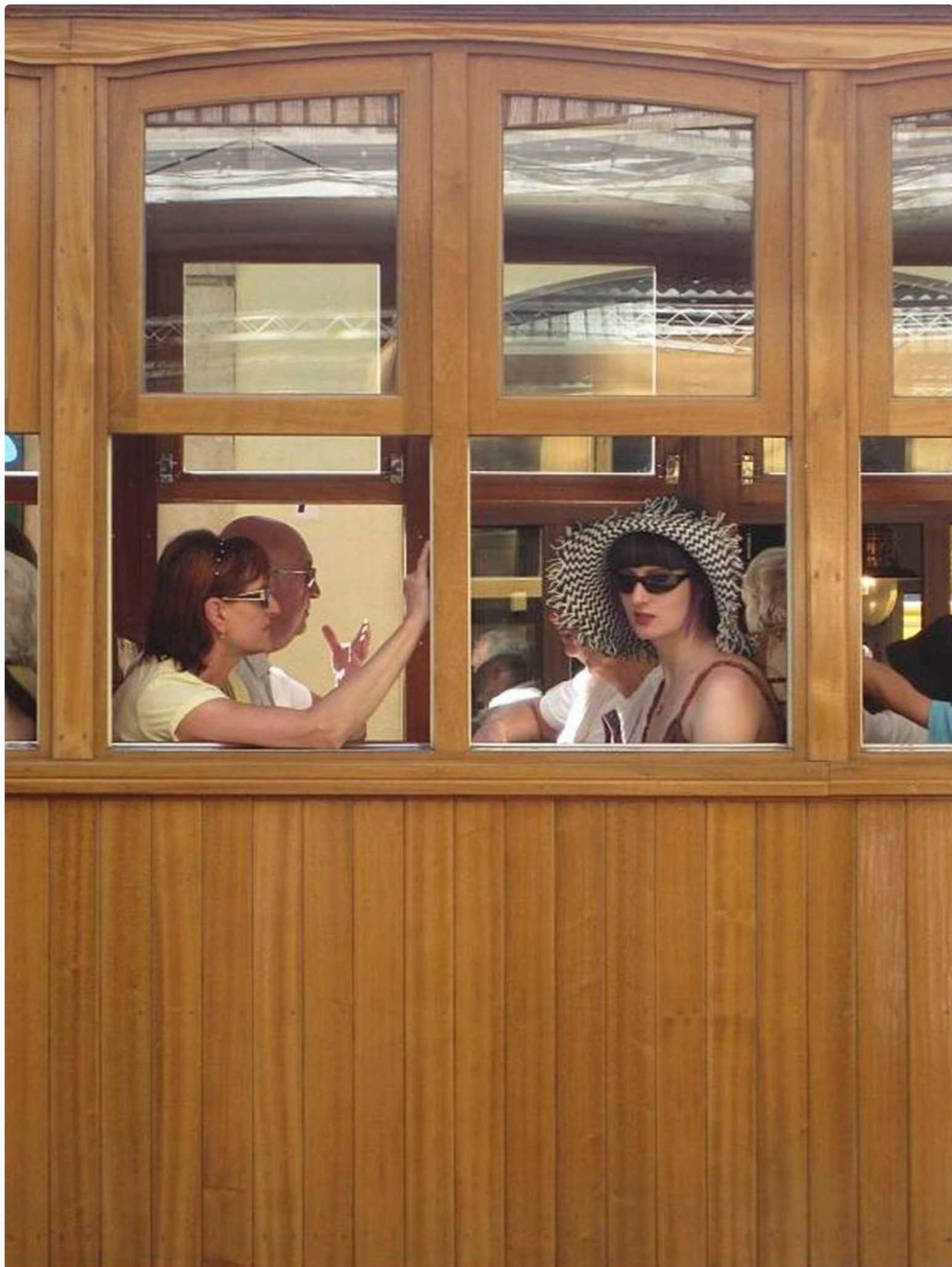
Paikan tyyliin sopivassa asussa rouvat lähdössä ratikkamatkalle Puerto de Sollerista Solleriin.