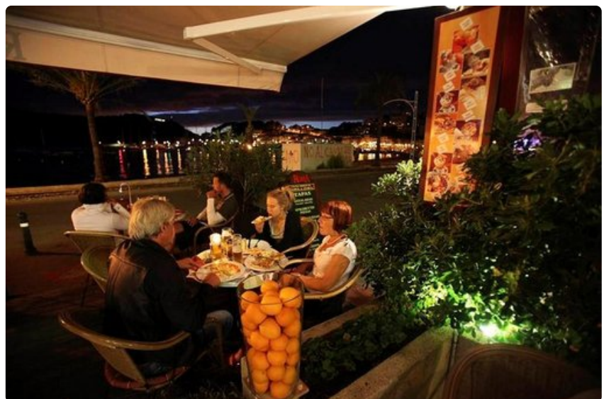
Leppeä ilta on laskeutunut Solleriin. Ravintoloissa nautitaan maukkaista päivällistä.