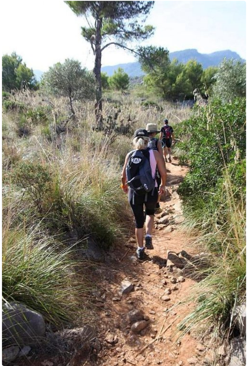
Patikkareiteillä voi varautua myös kivikkoihin polkuihin.