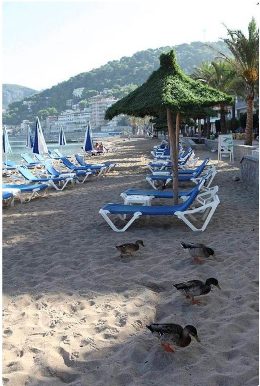
Aamuinen siivouspartio puhdistaa uimarantaa.