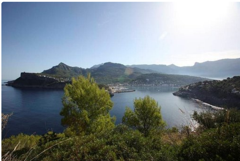
Sollerin patikkapoluilta avautuvat huikeat näkymät.