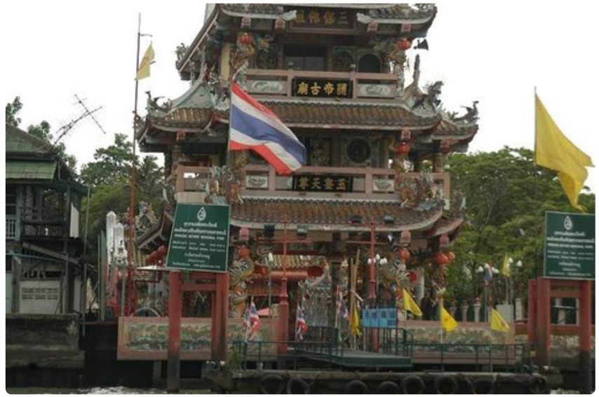
Bangkokissa on vilkas kiinalainen kaupunginosa tuoretoreineen ja tempeleineen.