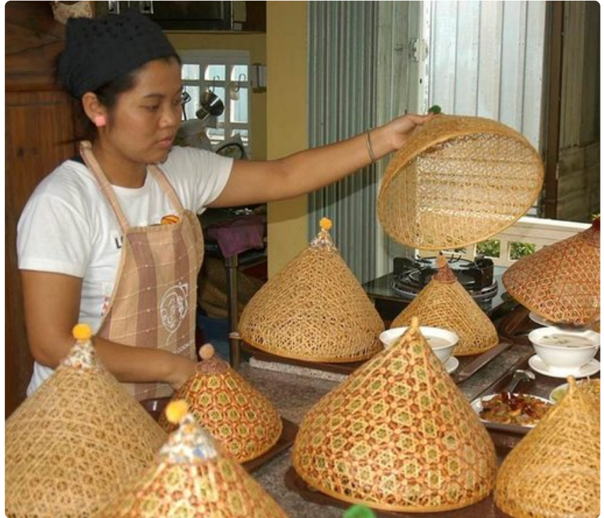
Kokkikurssilaisten työn tulokset odottavat syöjiään.