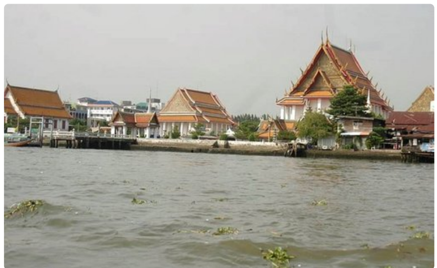
Chao Praya on suosittu jokiretkikohde temppeleineen ja tuotoreineen.