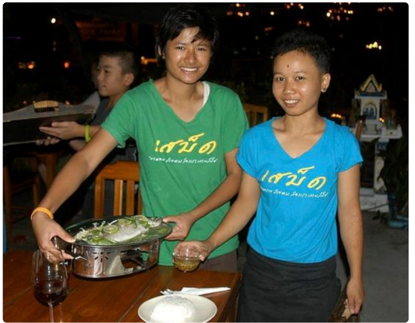
Thairavintolassa ei ole pulaa iloisesta henkilökunnasta.