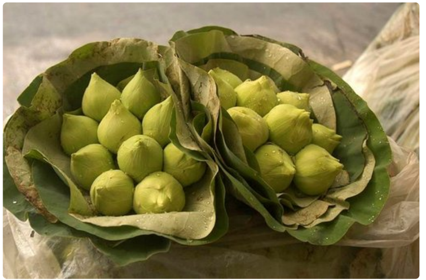
Ruoka ja hedelmät ovat matkailun valtteja.