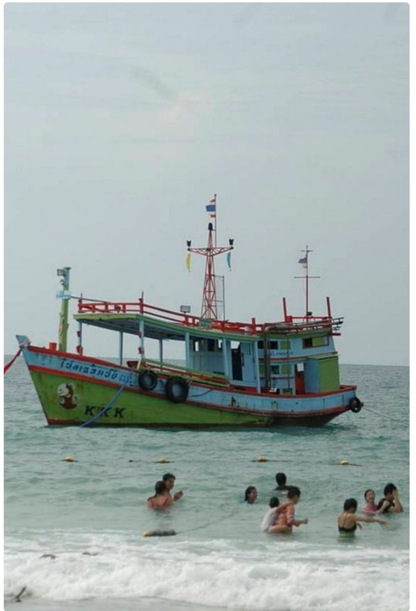
Koh Samet Bangkokin tuntumassa on vielä suurten matkailijavirtojen ulkopuolella.