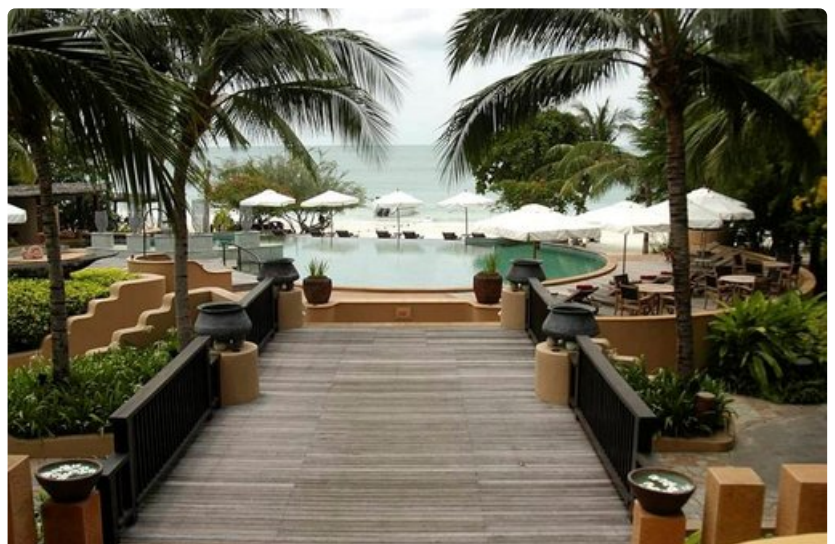
Paradee Span vieraina Koh Sametilla on ollut myös kuningaspari.