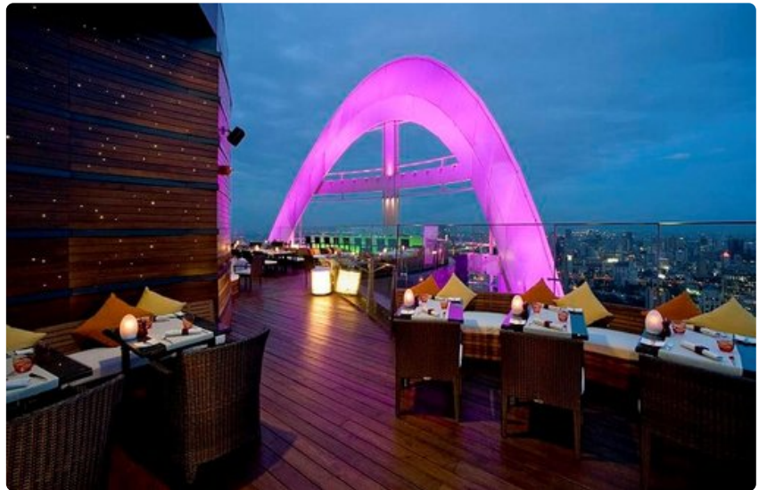
Centara Grand -hotellin 55. kerroksesta näkyy koko Bangkok.