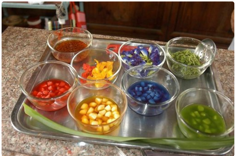
Jälkiruoka voi olla esimerkiksi lähijoesta otettua vesipähkinää kookosmaidossa.