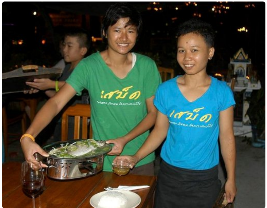
Thairavintolassa ei ole pulaa iloisesta henkilökunnasta.