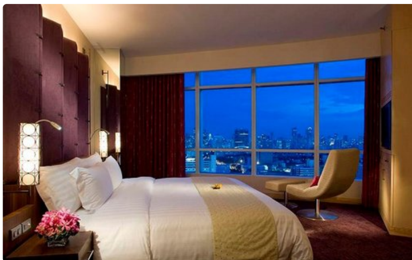
Näkymät hotellihuoneesta voivat olla henkeäsalpaavia.