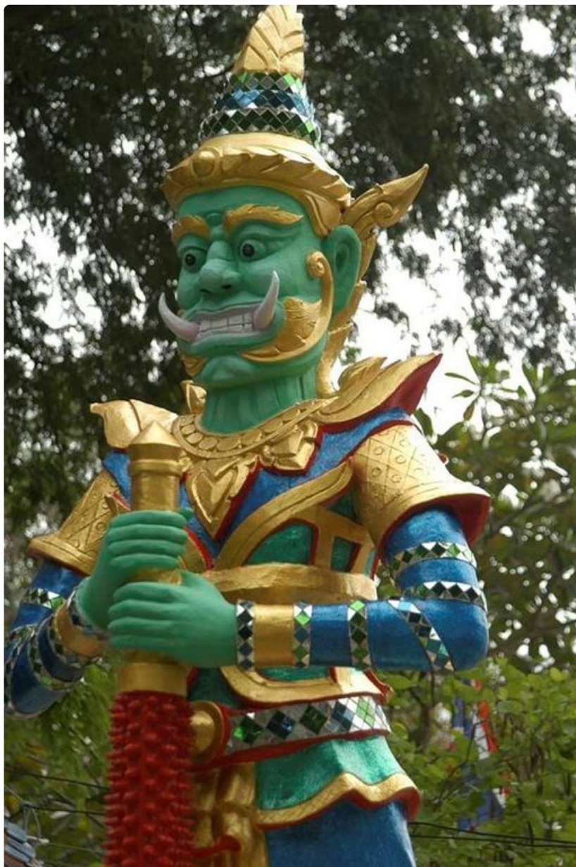
Koh Sametin saaren buddhalaista temppeliä vartioi topakka hahmo.