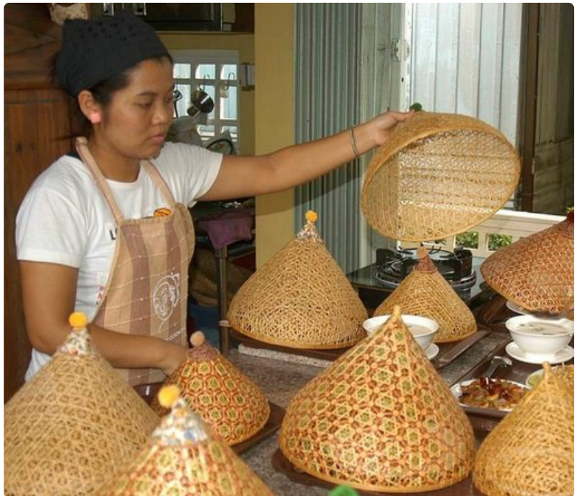
Kokkikurssilaisten työn tulokset odottavat syöjiään.