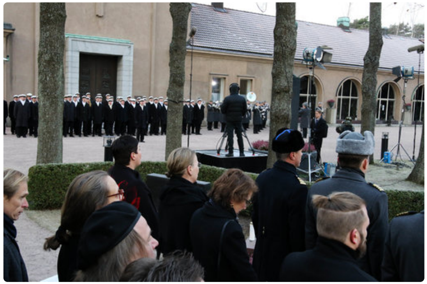
Ylioppilaskunnan Laulajat esittivät tilaisuudessa Suomen laulun.