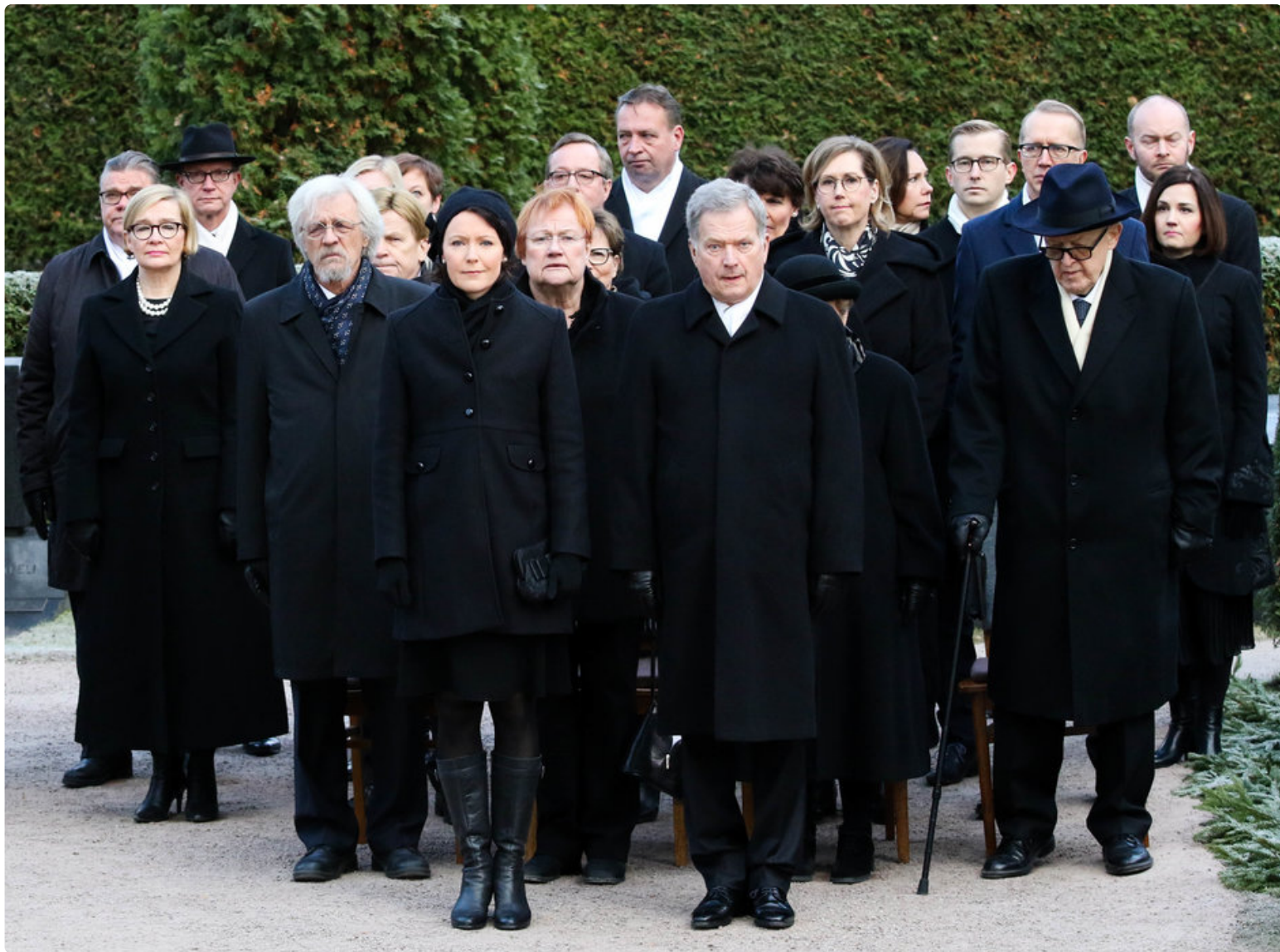
Tasavallan presidentti Sauli Niinistö ja puoliso Jenni Haukio sekä taustalla presidenttiparit Tarja Halonen ja Pentti Arajärvi sekä Eeva ja Martti Ahtisaari presidentti Mauno Koiviston hautamuistomerkin paljastustilaisuudessa Hietaniemen hautausmaalla. Heidän takanaan on lisäksi ministereitä sekä eduskunnan puhemiehet.