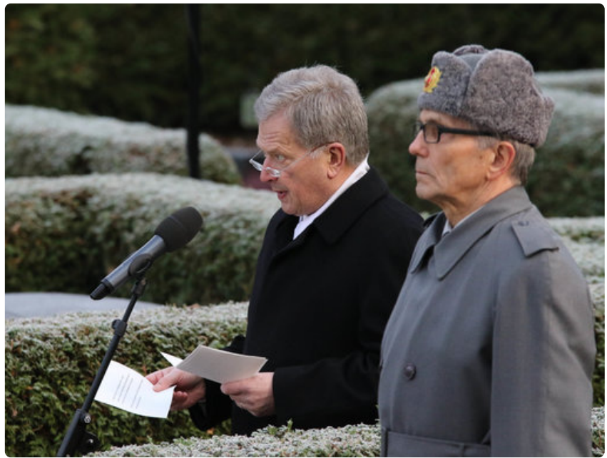
Tasavallan presidentti Sauli Niinistö pitää paljastuspuhetta.

Presidentti Koivisto kuoli 12. toukokuuta viime vuonna 93 vuoden iässä. Suositun presidentin surusaattoja ja valtiollisia hautajaisia seurasi Helsingissä yli 30 000 ihmistä.