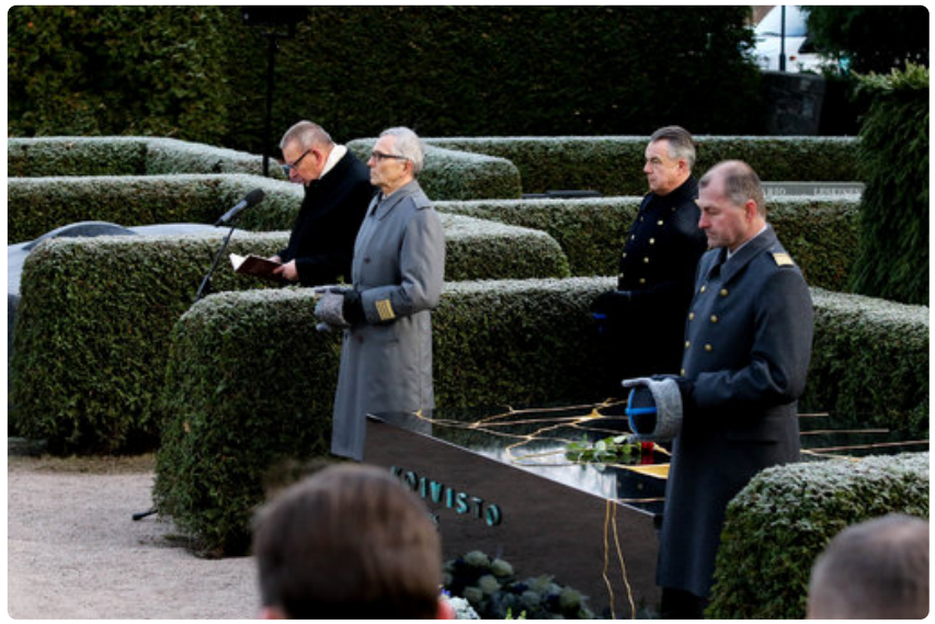
Piispa Eero Huovinen lukee rukousta.