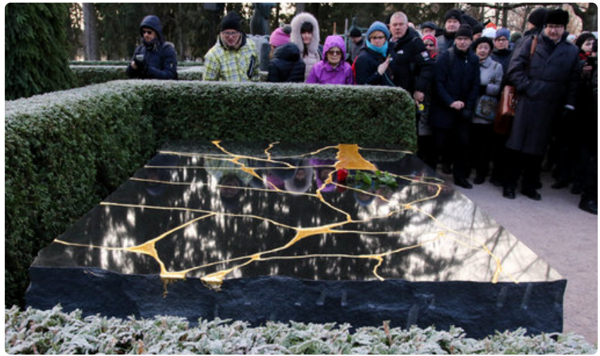
Muistomerkin on suunnitellut valokuvaaja Perttu Saksa. Se on tehty Varpaisjärveltä louhitusta mustasta diabaasista ja painaa 9.000 kiloa.