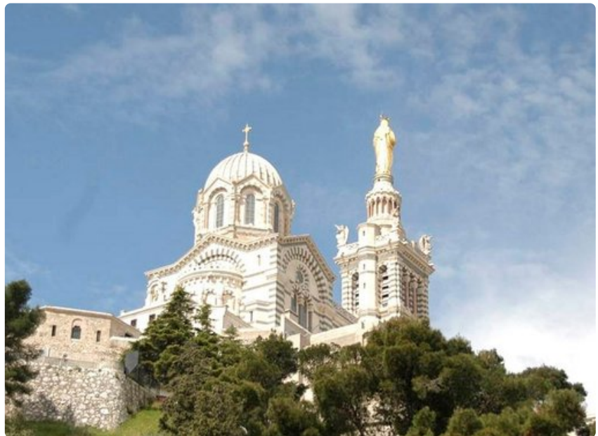
Notre-Dame-de-la-Garden katedraali näkyy koko Marseillen kaupunkiin.