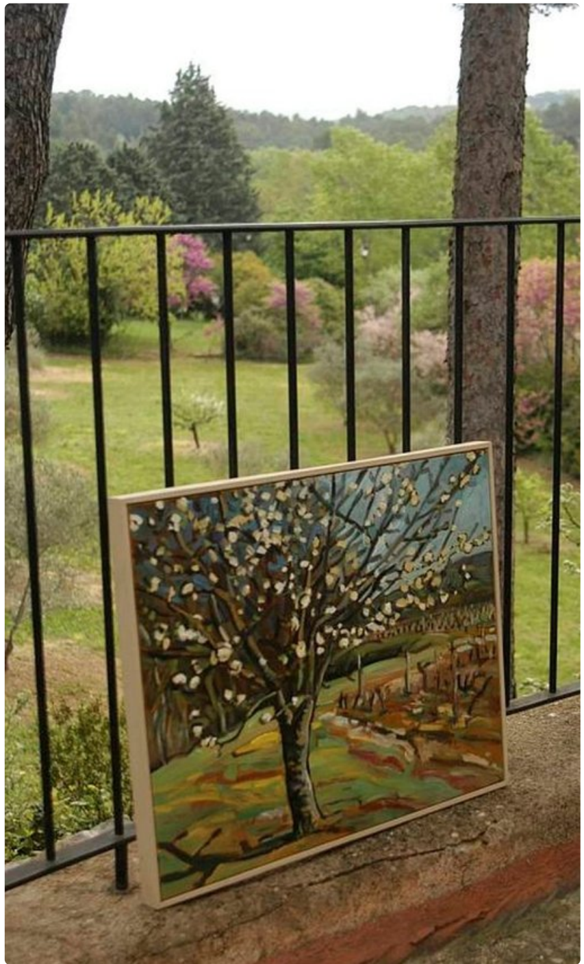
Erakoitunut Paul Cézanne maalasi tuulimyllyssä Aix-en-Provencen lähellä. Myynnissä on nyt muiden teoksia.