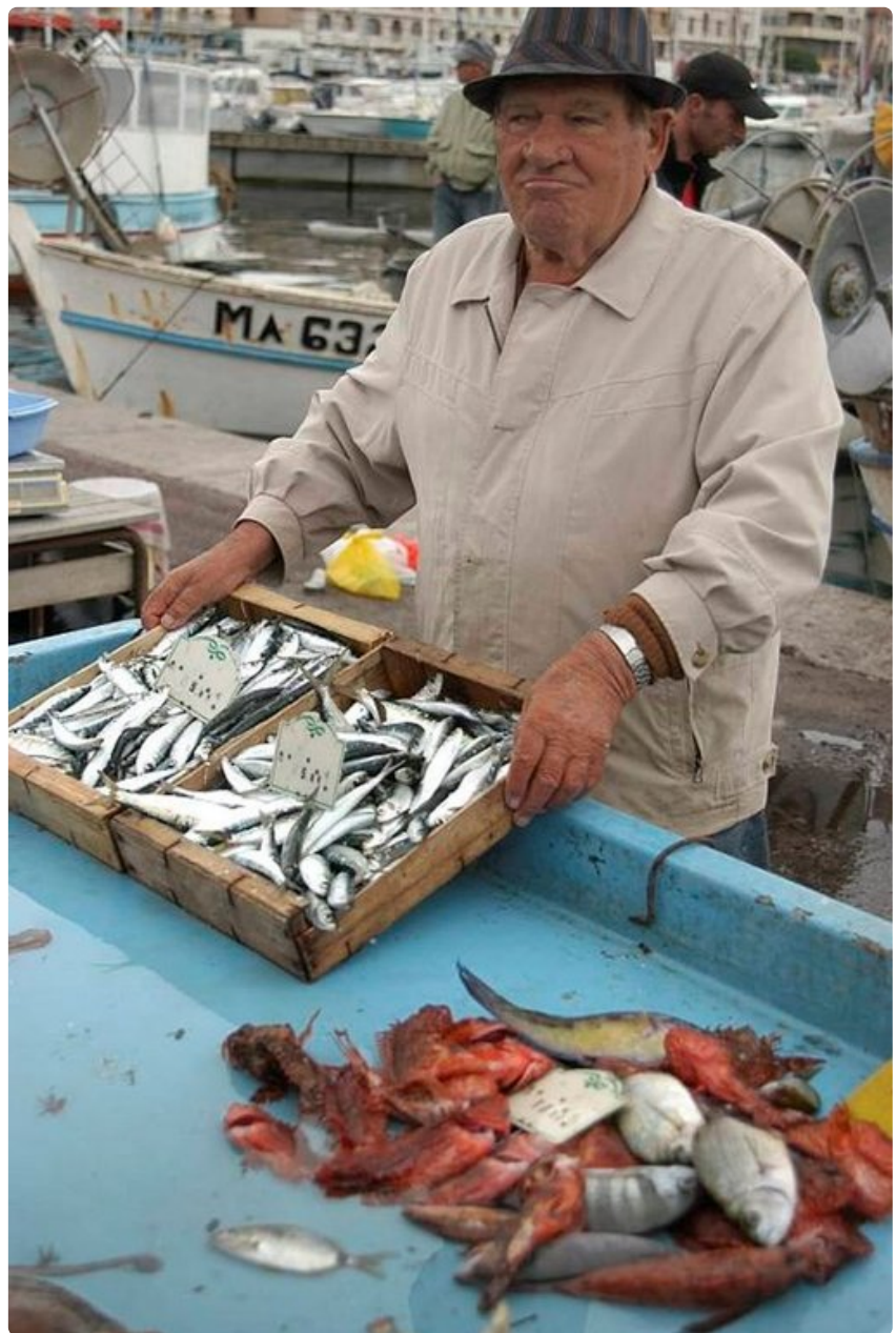
Marseillein vanhan sataman kalatori on avoinna joka aamu.