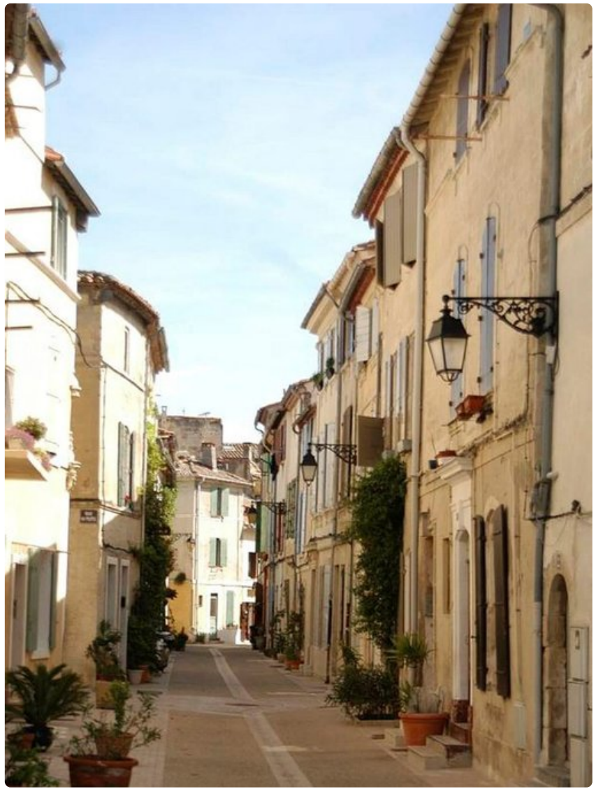
52 000 asukkaan Arles kuuluu Unescon maailmanperintöluetteloon.