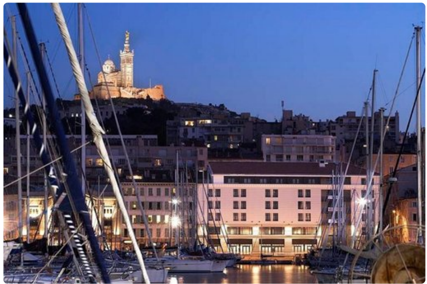
Marseille on Ranskan vanhin kaupunki.