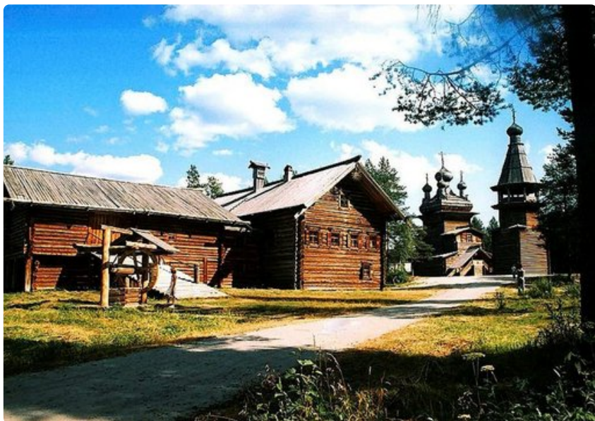
Malyje Korely on paikallisen puurakennustaiteen taidonnäyte ja kansantaidemuseo.