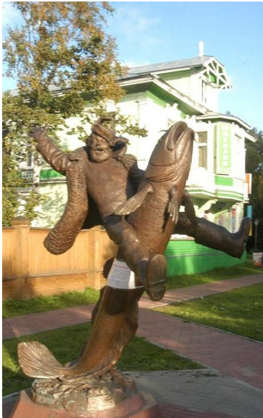
Kävelykadun Mies ja kala -patsaan aihe pohjautuu vanhaan paikalliseen tarinaan.