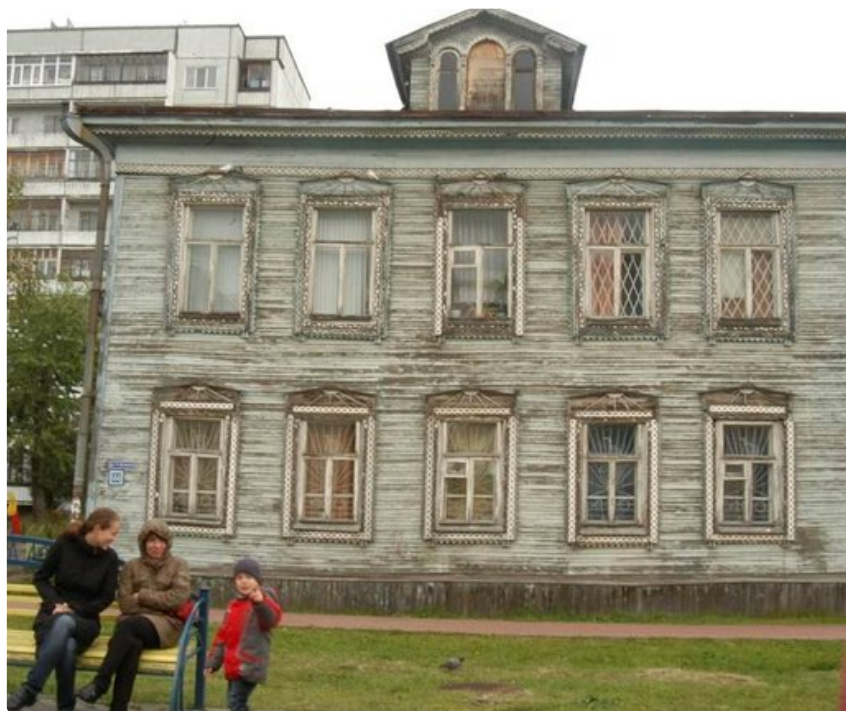
Monet puutaloista ovat huonossa kunnossa, mutta kunhan ne saadaan kuntoon, tulee alueesta varma matkailukohde.