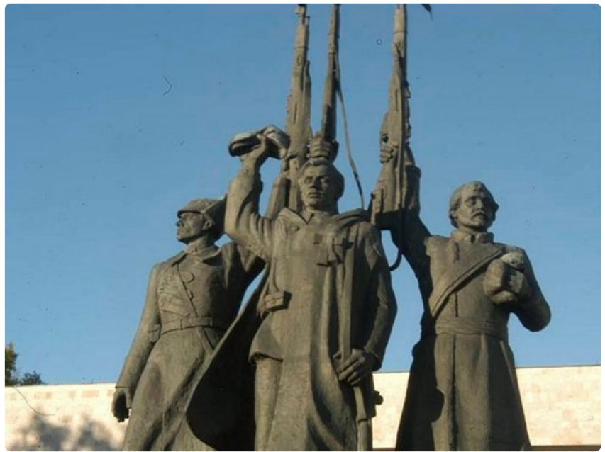
Kansalaissodan muistomerkki kohoaa sataman lähellä.