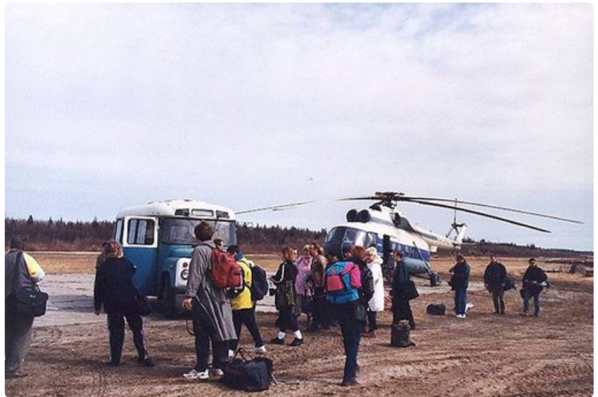
Liikkuminen Arkangelin alueella on vaikeaa huonokuntoisten teiden vuoksi. Usein apu tulee helikopterista.