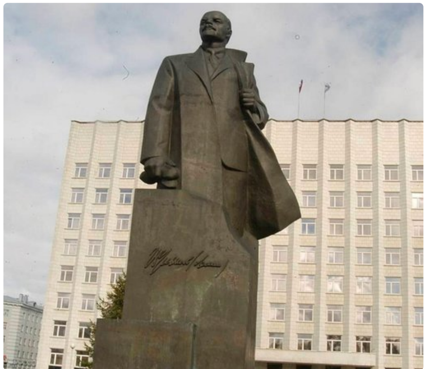
Leninin patsas vuodelta 1988 oli viimeinen Neuvostoliiton aikana pystytetty.