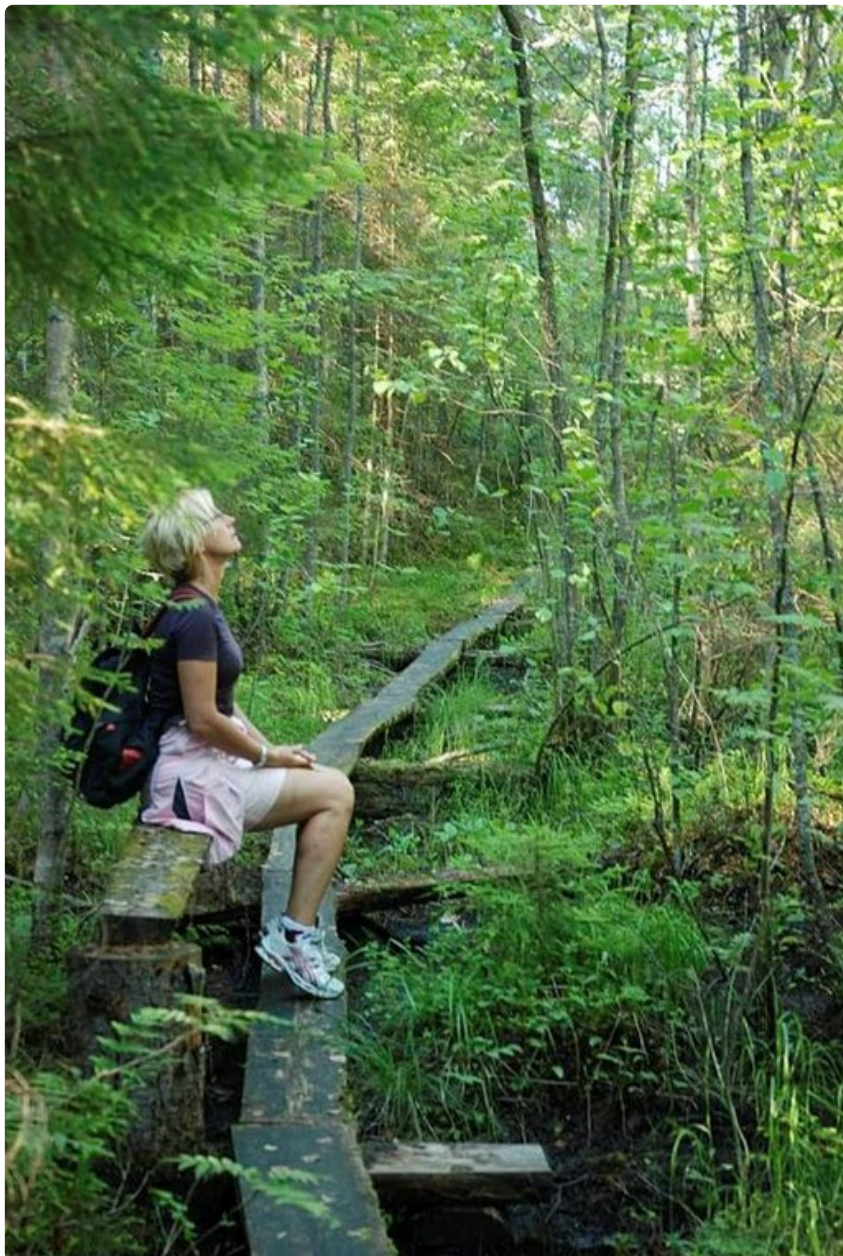
Kesäiset pyhät polut saavat talvella jatkoa.

TEKSTI ja KUVAT: TUULA KOPONEN ja PENTTI VÄISTÖ