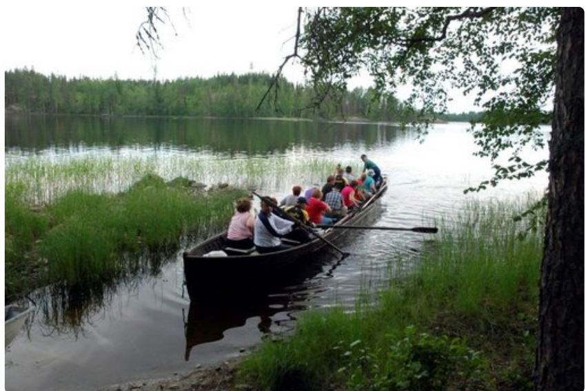
Jos on sopiva porukka, niin kirkkovenekin on hyvä kulkuväline.