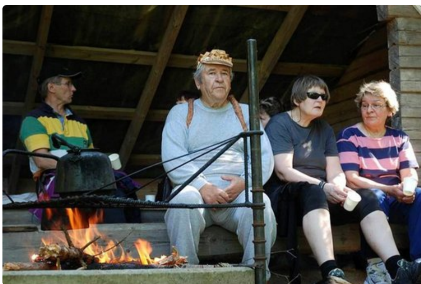
Laavulla voi levähtää ja keittää nokipannukahvit.