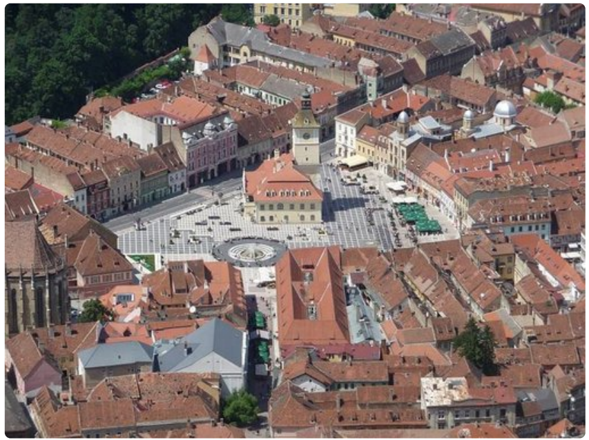
Näkymä kukkulalta Brasovin keskiaikaiseen keskusta.