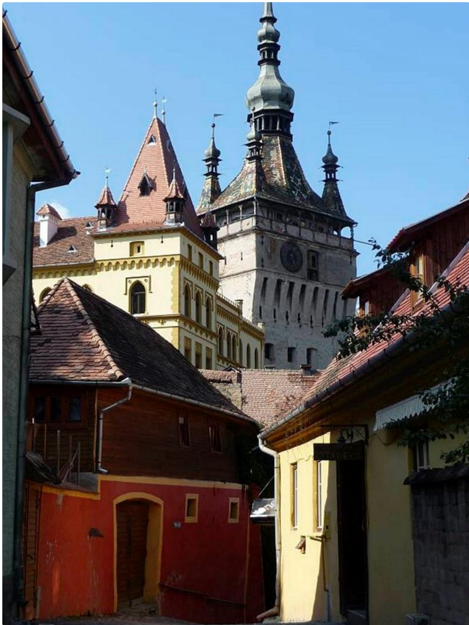
Astu keskiaikaan ja sukella Sighisoaran syövereihin.