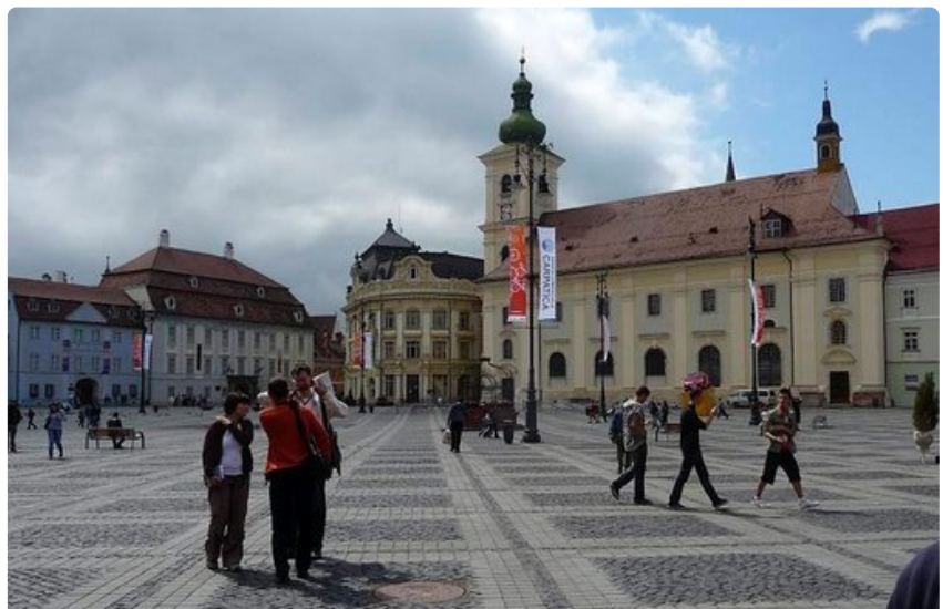
Sibiu olki Euroopan kulttuuripääkaupunki vuonna 2007.