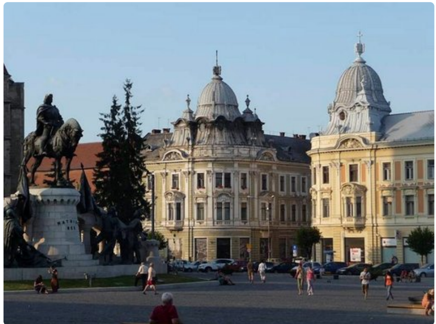
Transilvanian pääkaupungiksi nimitetty yliopistokaupunki Cluj Napoca.