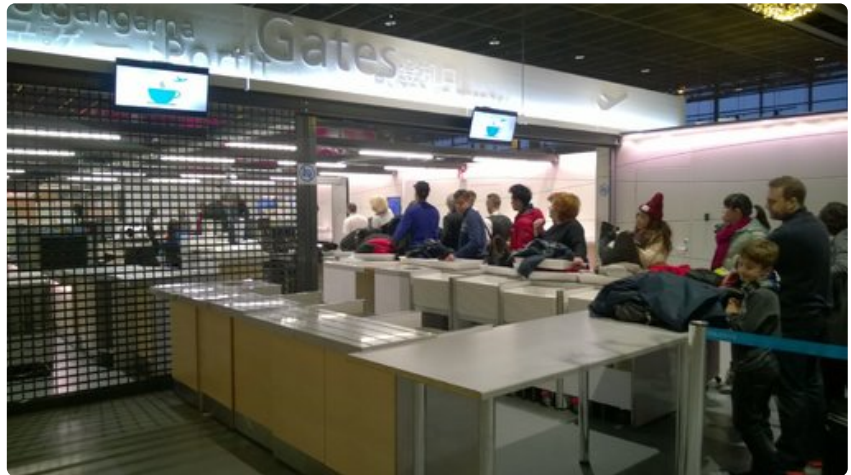
Rovaniemen lentoaseman toinen turvatarkastuslinja pysyi suljettuna ruuhkasta huolimatta.