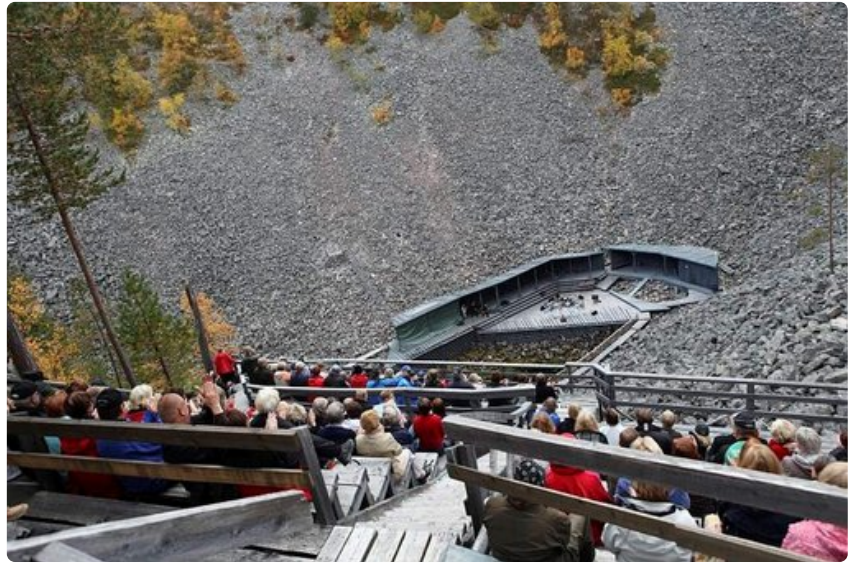
Akustiikka toimii Aittakurussa, vaikka musikot näyttävät yläriviltä katsottuna muurahaisilta.