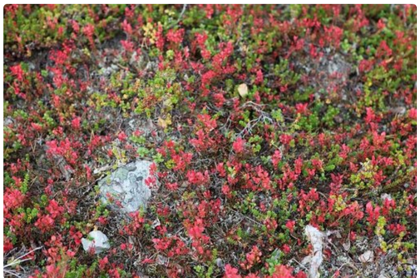
Swingien aikaan maaruska on kauneimmillaan.