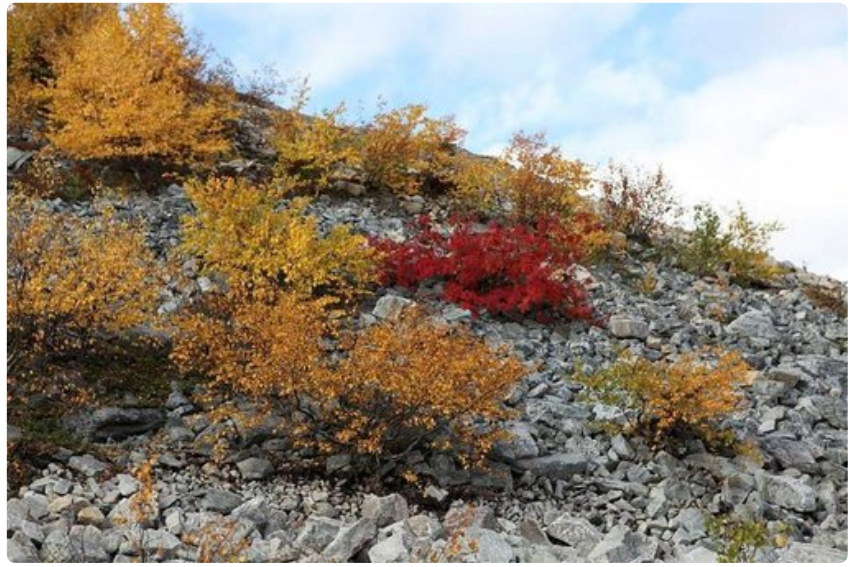
Pyhän kivikot, punaiset ja keltaiset lehdet ja jazz ovat sopineet yhteen jo yli kaksikymmentä vuotta.

Kun Sarpila vaihtaa klarinetin saksofoniin täyttää sadan naisen yhtäaikainen huokaus salin kuin kaasua. Onnelliset parit nojailevat toisiinsa seinänvierustoilla. Parketilla tavoitellaan foxtrotin ja lindy hopin askeleita. Värivalot hehkuvat sinisinä kuin syystaivas; punaisina ja kultaisina kuin ruska. Tunnelman uumenista kantautuu korviini kilakka ääni: