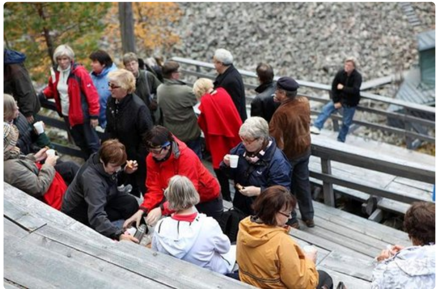
Jazzin ystävät piknikillä Aittakurun katsomossa.