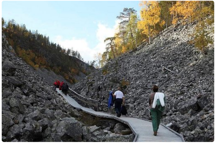
Matka Aittakuruun luonnon konserttisaliin on elämys.

Kysyn Korhoselta montako kertaa minun pitäisi käydä klikkaamassa Jazzrytmit-lehteä, että miljoonan rajapyykki täytyisi.