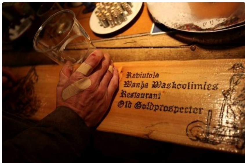
Kultamiehen kärsinyt käsi.