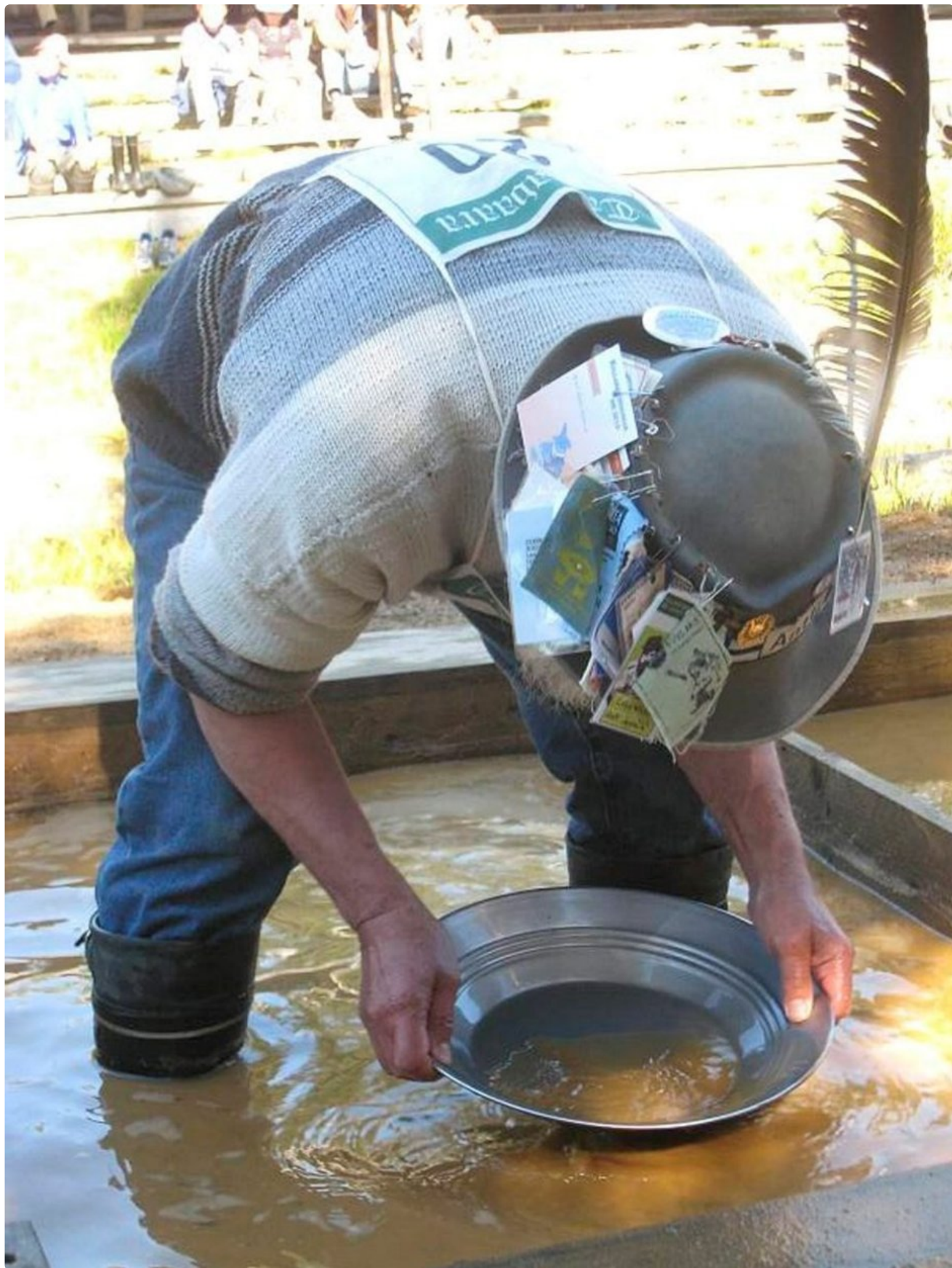
Tankavaaran kullanhuhdontakilpailut järjestetään joka kesä.