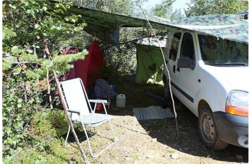
Koti kulkee mukana.