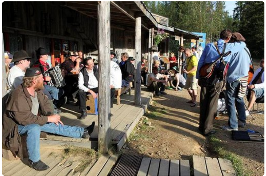
Iltaapäivän auringossa viihdytään Kultakylän raitilla.