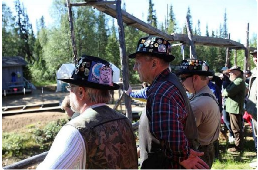
Pinssihattu ja ruutupaita ovat kultamiehen kansallispuhu.

Mutta mistä tiedetään että hippu oli 50-luvulla Korhosella?