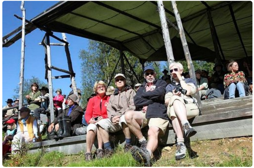
Kilpailualueen katettu katsomo suojaa tarvittaessa sateelta ja auringolta.

- Pysin omien töitteni kautta välittämään asiakkaille Lapin kultamaiden aitoa tunnelmaa.