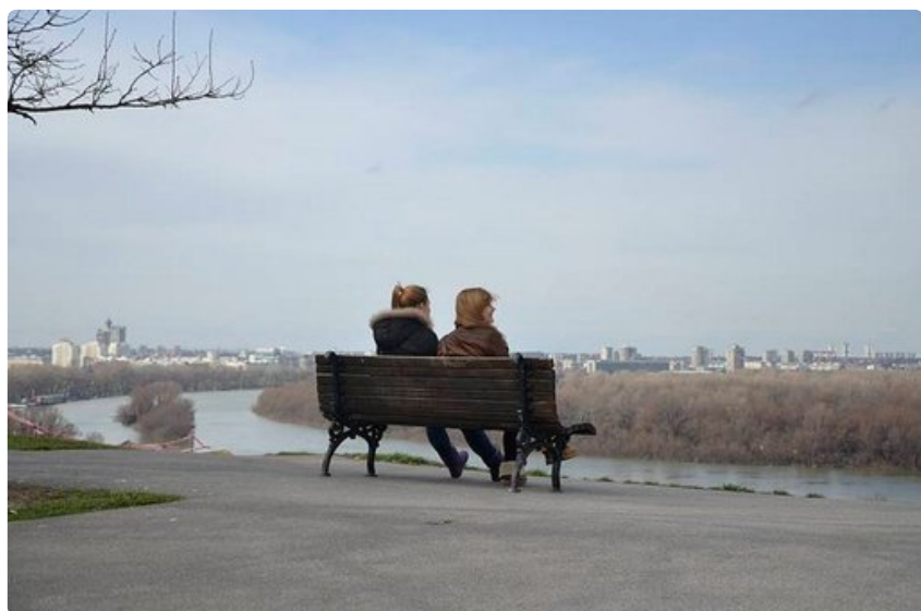
Rauhoittavat jokimaisemat Belgradin linnoitukselta katsottuna.