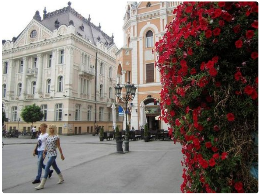
Novi Sadin keskusaukio.