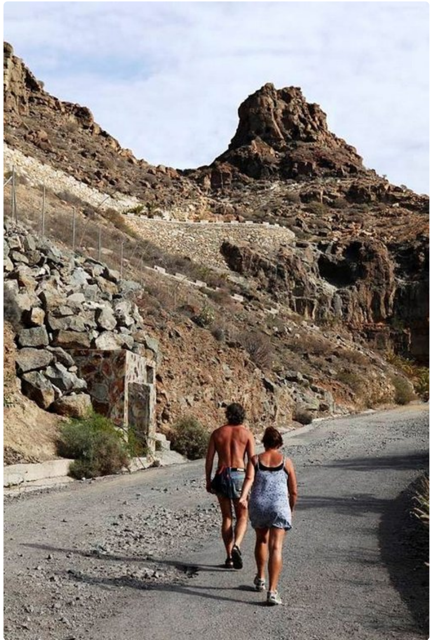
Ruotsalaiset ovat vielä suomalaisiakin suvaitsevaisempia kumppaninsa lomailusta yksin tai kavereiden kanssa.