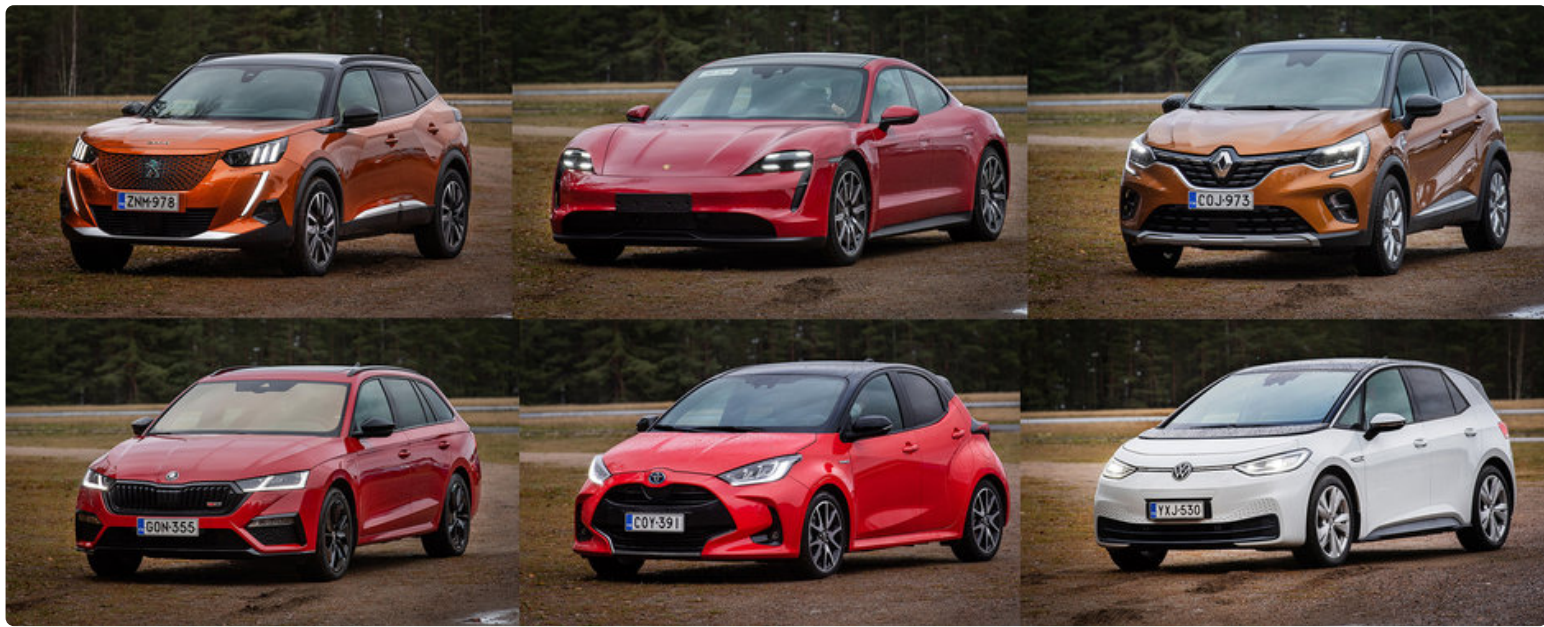
Vuoden Auto ehdokkaat vasemmalta alkaen aakkosjärjestyksessä: Peugeot 2008, Porsche Taycan, Renault Captur, Škoda Octavia, Toyota Yaris ja Volkswagen ID.3.