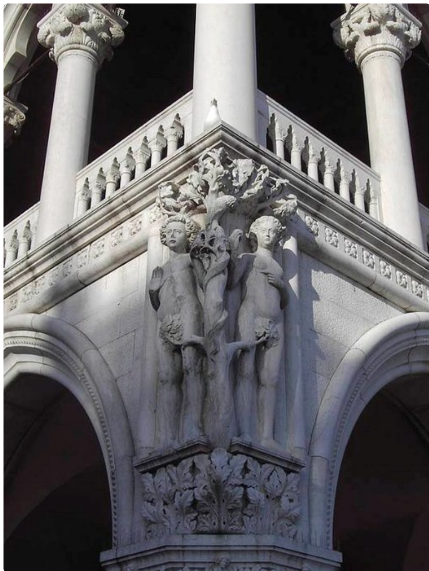
Dogen palatsin kulmaa koristaa syntyinlankeemus.

Kuolema Venetsiassa (1971, ohjaus Luchino Visconti ): Puolalaisnuorukainen sekoittaa vanhenevan taiteilijan päähän Lido di Veneziaan hiekkarannalla. Elokuvaversiossa Gustav von Aschenbach on säveltäjä, ei kirjailija, ja hänen romahdustaan siivittää Gustav Mahlerin riipaisevan kaunis musiikki.