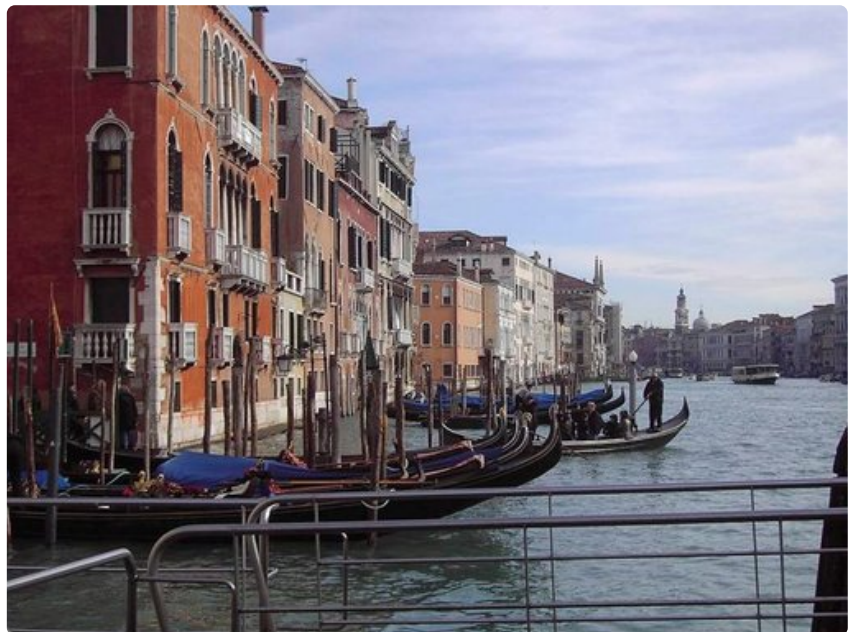
Näkymä San Toman vaporettopysäkiltä.