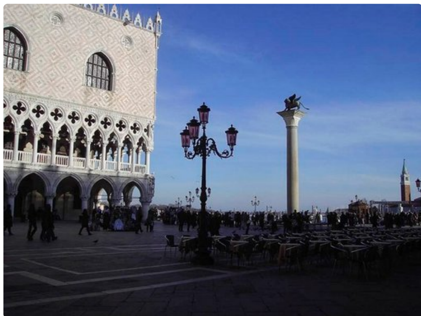
Venetsiaa suojelee Pyhää Markusta symboloiva siivekäs.