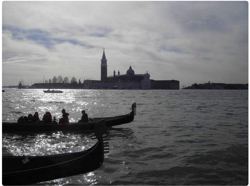
Elämää taivaan ja veden välissä.

Kun kuvioihin astuu upporikas nuori amerikkalainen perijätär Milly Theale, jolla on kaikkea muuta paitsi terveyttä, asetelma on valmis juonittelulle. Vaikka rahan ja rakkauden kohtalokas leikki sijoittuu enimmäkseen Lontooseen, toimii verevimpien osien näyttämönä kaiken nähnyt Venetsia. Sanotaan, että Milly-perijättären vuokraaman palatsin esikuvana on toiminut Palazzo Barbaro, jossa James Venetsiassa ollessaan itse asui ja kirjoitti.