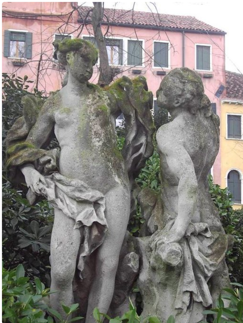
Venetsian rappiossa on hienostunut sävy.