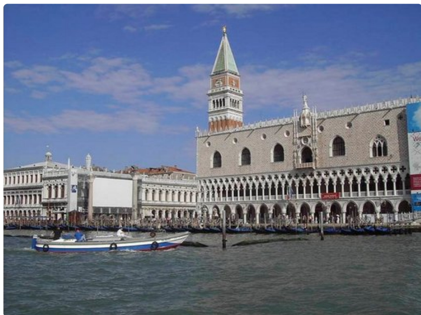
Venetsiaan on luontevaa saapua vesiteitse.