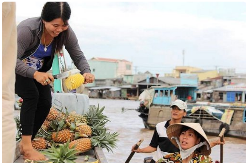
Kelluvat markkinat on tärkeä hedelmien ja vihannesten kauppapaikka.