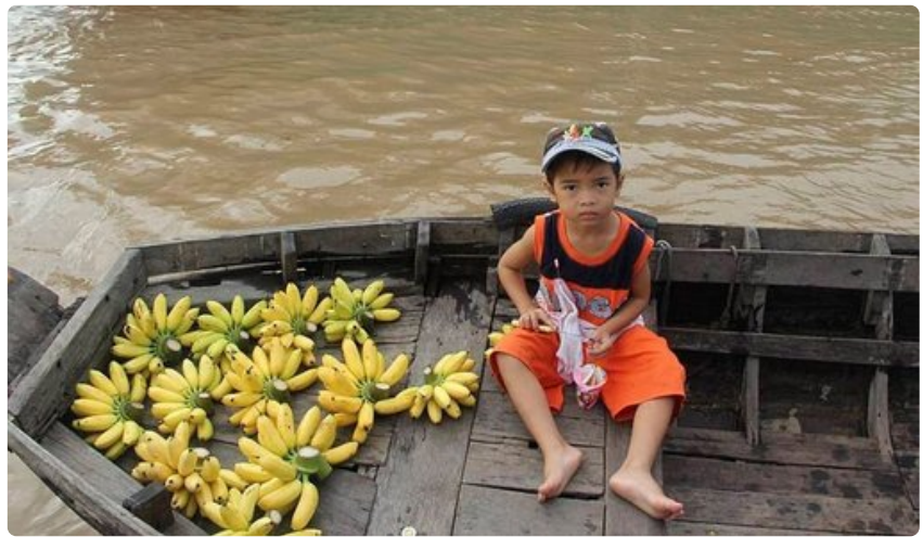
Pikkupoika Nguenilta voi ostaa kauniisti esille laitettuja banaaneja.

Kolmio kattaa mainittujen valtioiden lisäksi suuren osan Thaimaata. Teitä pitkin Hanoi-Saigon ja Saigon-Myanmar ovat molemmat noin 1750 kilometriä ja Myanmar-Hanoi noin 1900 kilometriä. Suuren Delta-kolmion sivu on noin 1800 kilometriä.