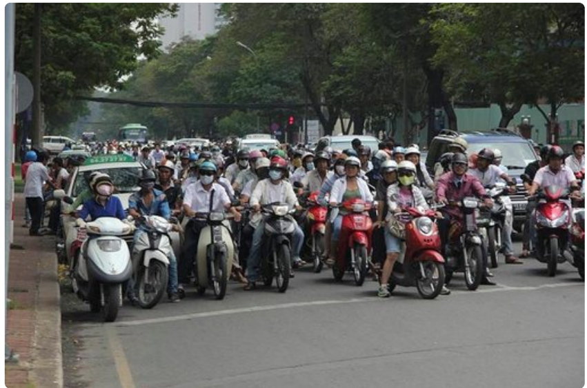
Mopoilla liikutaan sujuvasti. Saigonissa niitä on miljoonia.