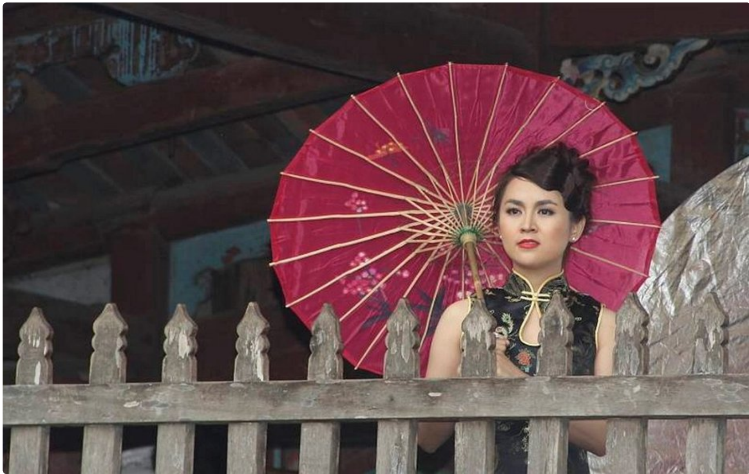
Naiskauneutta Hoi Anissa.