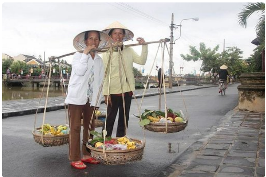
Hoi Anin pikkukaupungin rentoa ilmapiiriä eivät matkailijajoukot ole vielä turmelleet.

Thaimaassa Levoniemet ovat käyneet vain kerran ja Vietnamiin neljätoista kertaa, joten he pitävät itseään jääveinä vertailemaan maita puolueettomasti, mutta tietty mielikuva on syntynyt; jokin heidät saa kerta kerran jälkeen palaamaan.