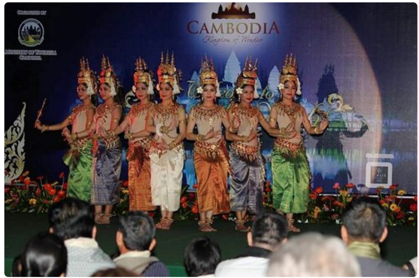
Kambodzan naisten tanssit ovat näyttäviä ja värikkäitä.