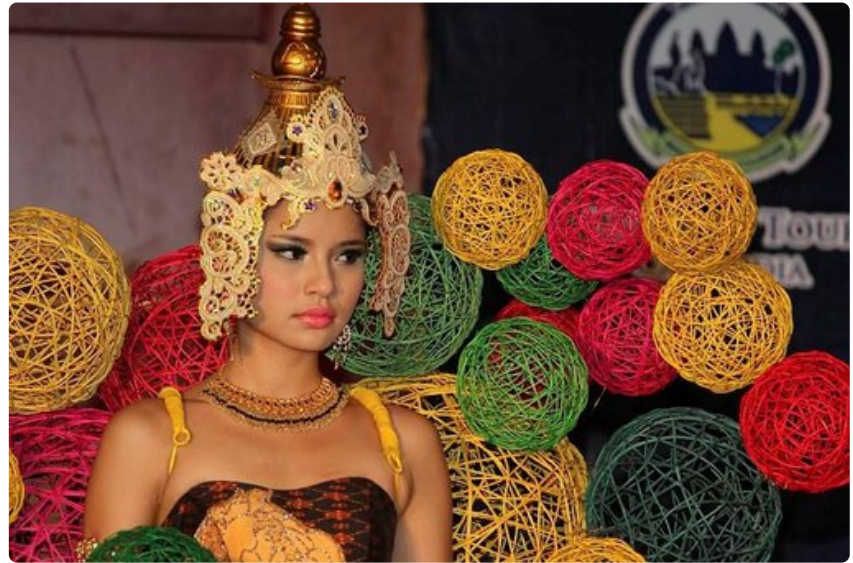
Itämaisten naisten kauneus korostuu kambodzalaisissa.