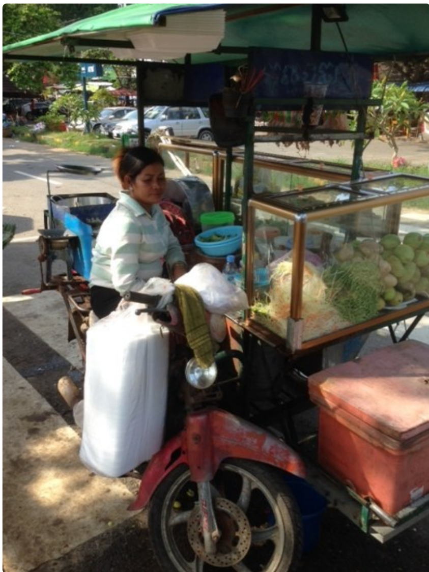
Kepissä kaikki kulkee pyörillä, myös snagarit. Mopoista on loihdittu tee-itse-insinööritaidon nerokkaita luomuksia.