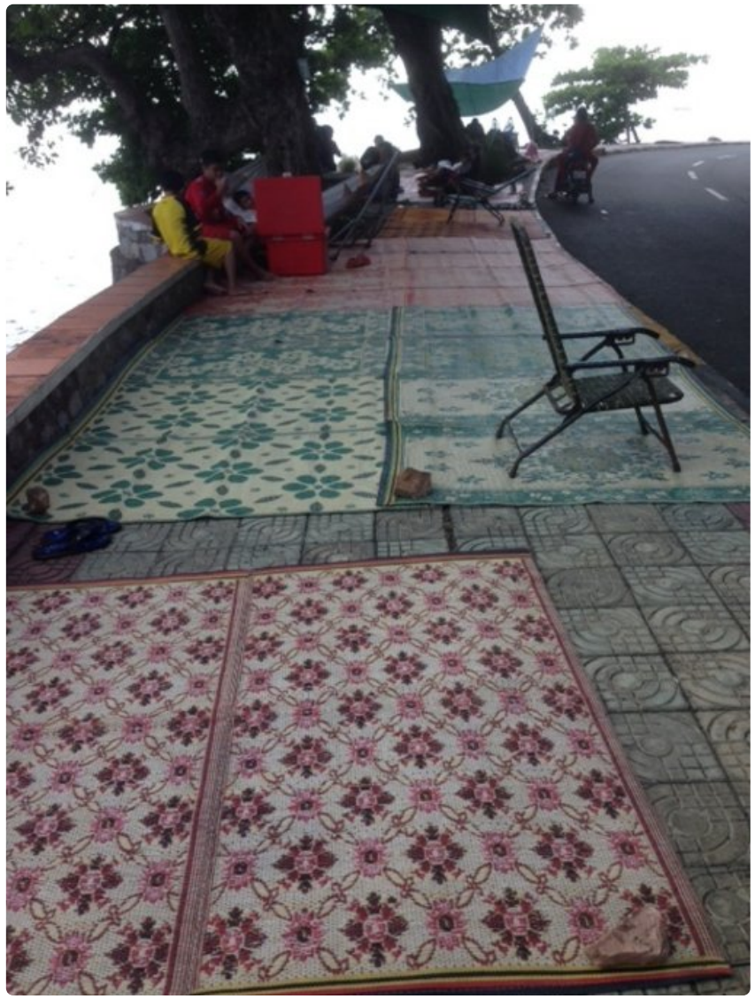
Merenrantakadun "mattonäyttelyllä" on selityksensä: viikonvaihteissa perheet ja ystäväpiirit levittävät matoille ruoat ja juomat, seurustelevat ja kuuntelevat musiikkia. Mattoja ei suinkaan kääritä pois, vaan ne jätetään paikoilleen seuraavaa viikonvaihdetta odottamaan.