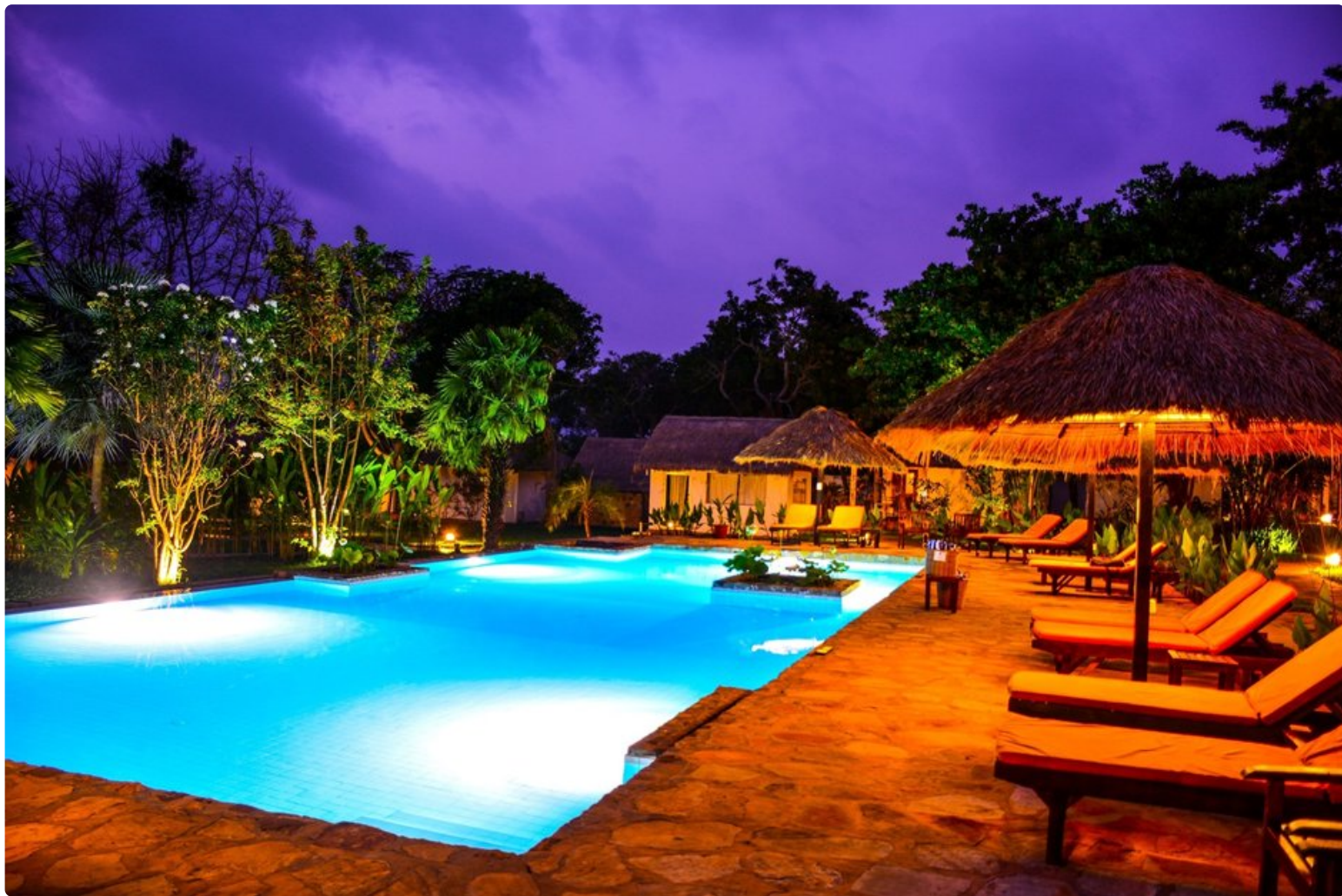
Villa Kep Resortin kolme keskipistettä ovat uima-allas, bambubaari ja ravintola.