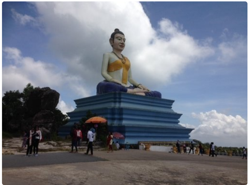
Tunnin ajomatkan päässä Villa Kep Resortista on 1.200 metriä merenpinnan yläpuolelle kohoava Bokor-vuori. Viikonvaihteissa vuoren Buddha-patsas on tuhansien kambodzalaisten retkikohde.