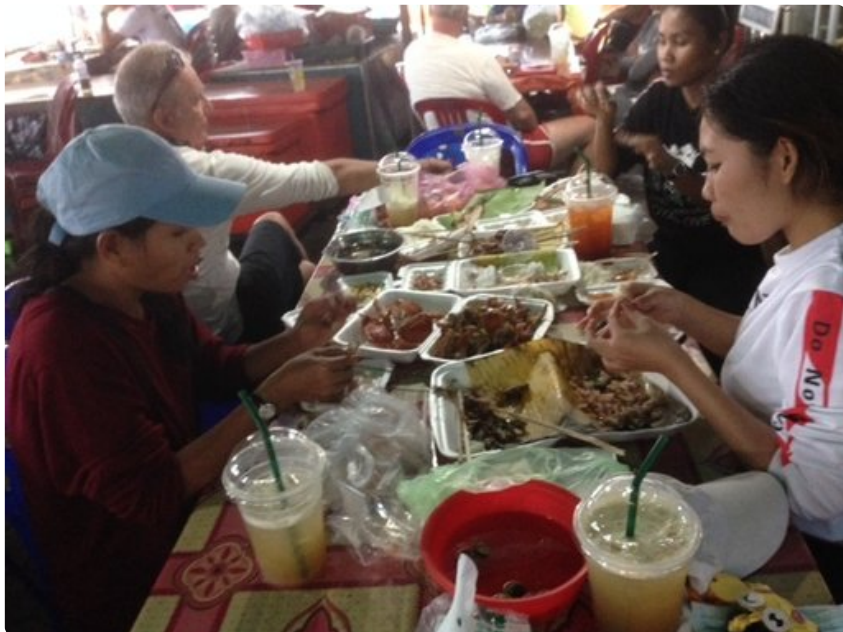
Paikalliselämää aidoimmillaan tapaa Crab Marketin "karvahattupuolella".