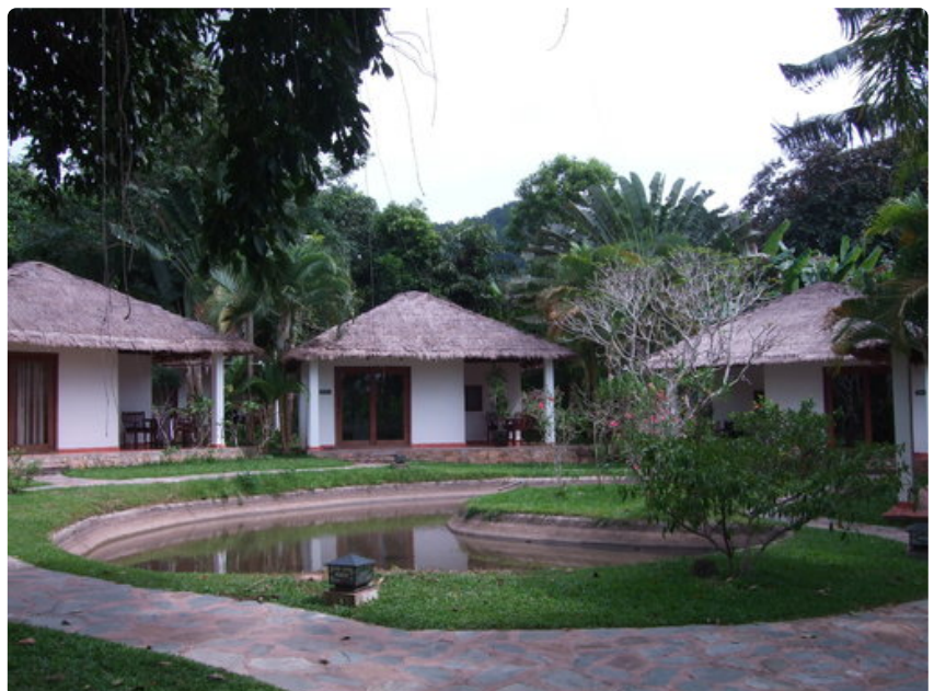
Tällaisia kahden hengen villoja resortissa on yhteensä 18. Lämmin vesi, suihku, WC ja jääkaappi kuuluvat varusteluun. Sängyt ovat ruhtinaallisia niin kokonsa kuin laatunsa puolesta.