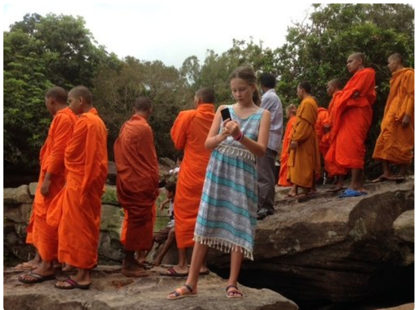
Buddhalaismunkit kuten koko kantaväestökin suhtautuvat turisteihin pidättyvän ystävällisesti.