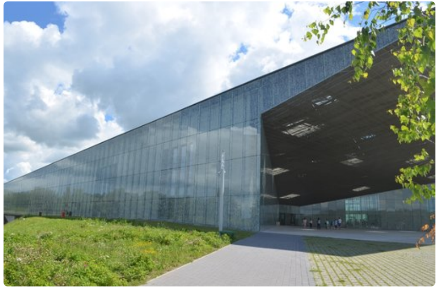
Museon sisäänkäynti on vaikuttava.