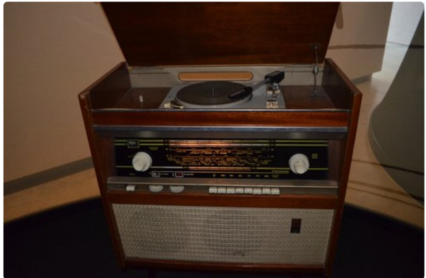
Tätä radiota ja levysoitinta valmistettiin Neuvosto-Latvian Riiassa.