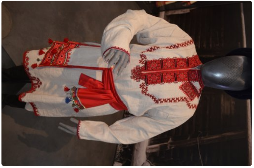
Suomalais-ugrilaisen kulttuurin näyttely pukuineen on laajempi kuin missään.