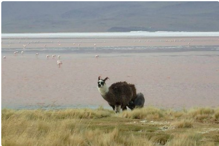
Laamaa ja alpakkaa on hankala erottaa toisistaan. Kuvan eläin on korvista päätellen laama, sillä alpakan korvat ovat lyhyemmät.