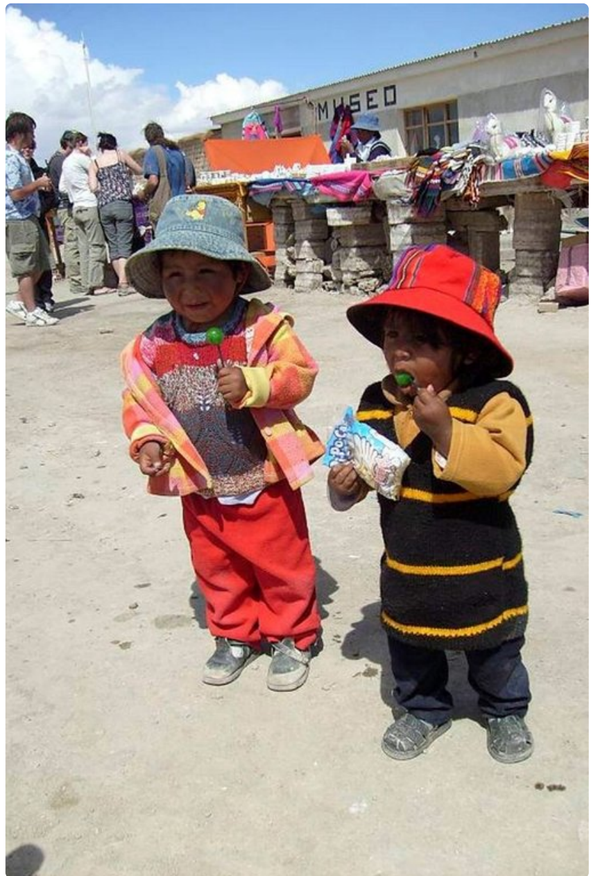
Bolivialaiset lapset tekevät innokkaasti tuttavuutta matkailijoiden kanssa.

www.boliviatravelsite.com/How_to_get_to_Uyuni_Salt_Flat.php