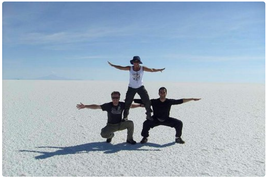
Maailman suurin suolatasanko innostaa matkailijat hulluttelemaan.