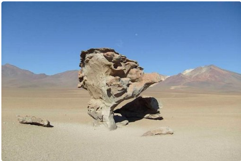
Tuulen syövyttämä Arbol de Piedra -kivipuu pysyy pystyssä kuin ihmeen kaupalla.

Vahva mädännyttä kananmunaa muistuttava rikinkatku ja vihmovan kylmä tuuli pitivät kuitenkin vierailumme Sol de Mañana -geysirien luona lyhyenä.