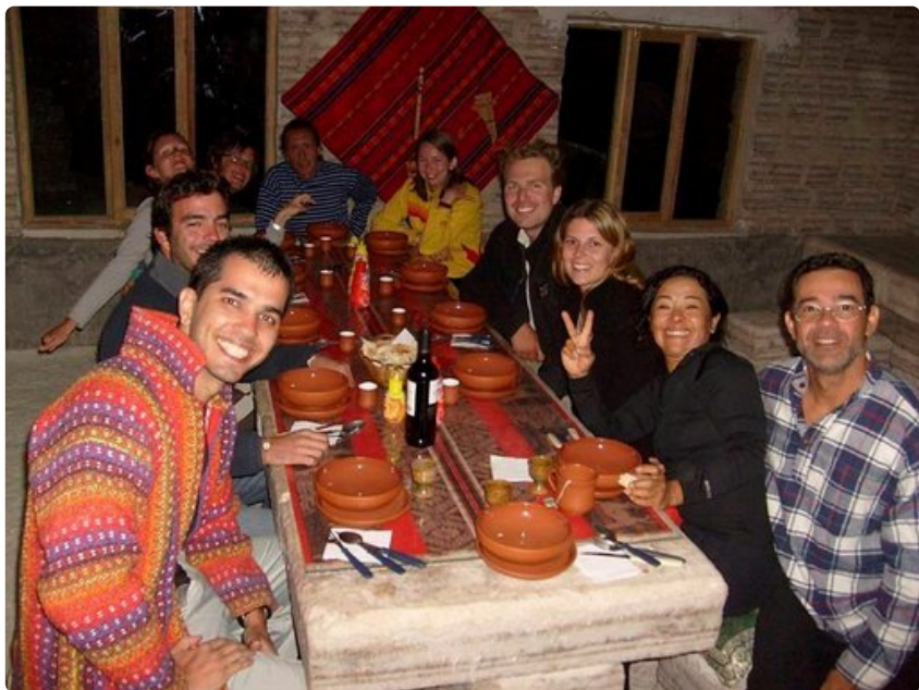
Uyunin jeeppiretkellä ryhmämme koostui saksalaisista, brasilialaisista, italialaisista ja espanjalaisista reissaajista.