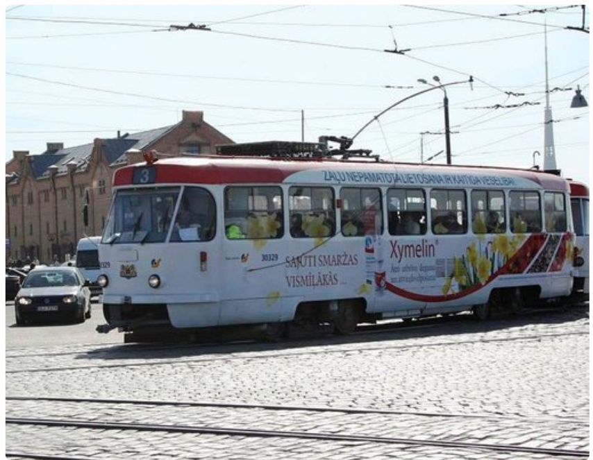
Värikkäät raitiovaunut vievät eri puolille kaupunkia. Lippu maksaa noin euron.