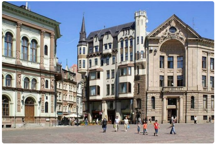
Suomalaisten suosimassa Riiassa hotellihinnat nousivat vuoden alkupuoliskolla.