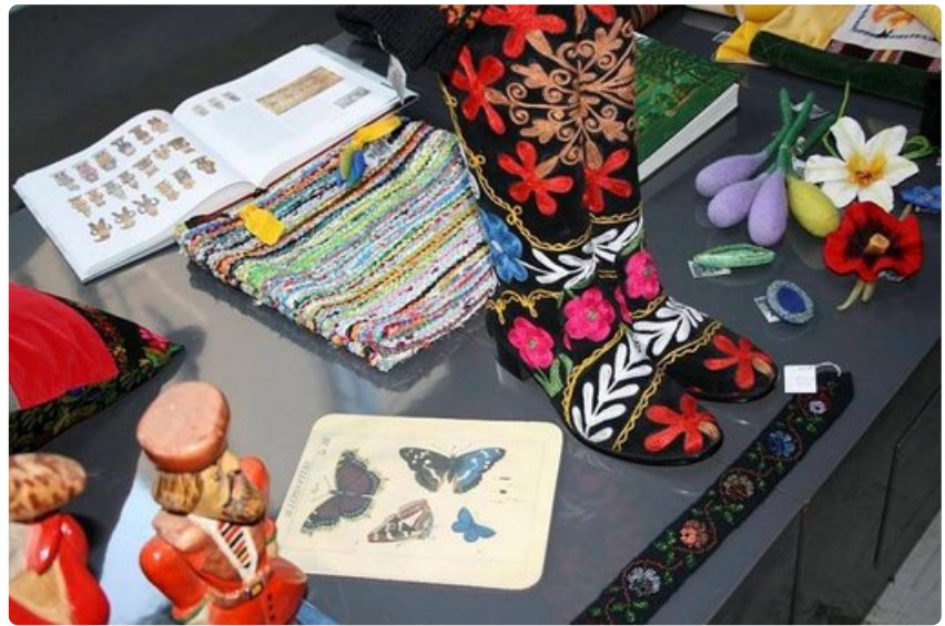
Putiikeissa voi tehdä värikkäitä ostoksia.