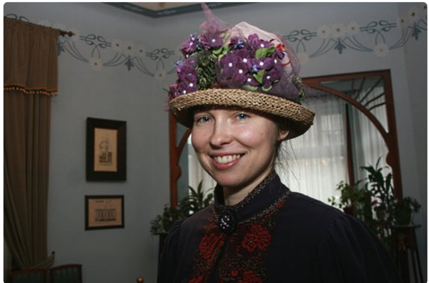
Jugend-museo viehättävä virkailija

On arvioitu, että lauantaisin torilla käy jopa puoli miljoonaa ihmistä. Riian kauppatori on Pohjois-Euroopan suurin.