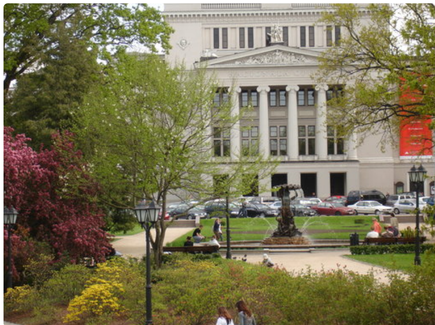
Ooperatalo sijaitsee keskuspuistossa lähellä Pilsetas-kanava