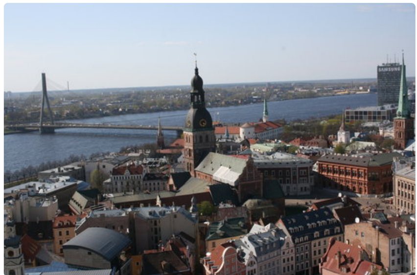
Pyhä Pietarin kirkon tornista näkymät ovat huikeat