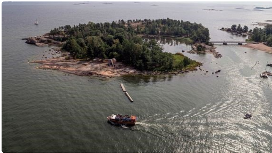
Myös Pihlajasaari avautuu yleisölle.