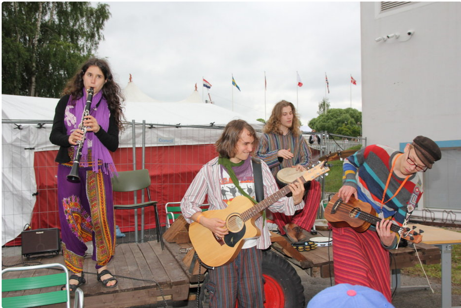
Fair trade oli Kaustisen musiikkijuhlien positiivimpia esiintyjä.