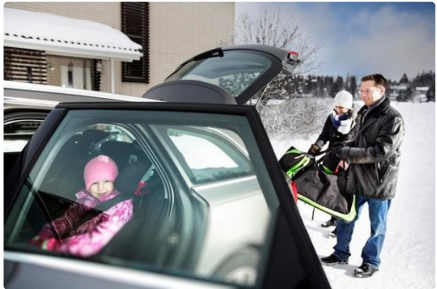
Autossa turvallisin paikka tavaroille on takakontti. Matkustamo kannattaa pyhittää vain matkustajille.