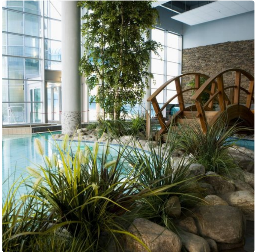
Uuden kylpylän havainnekuva.