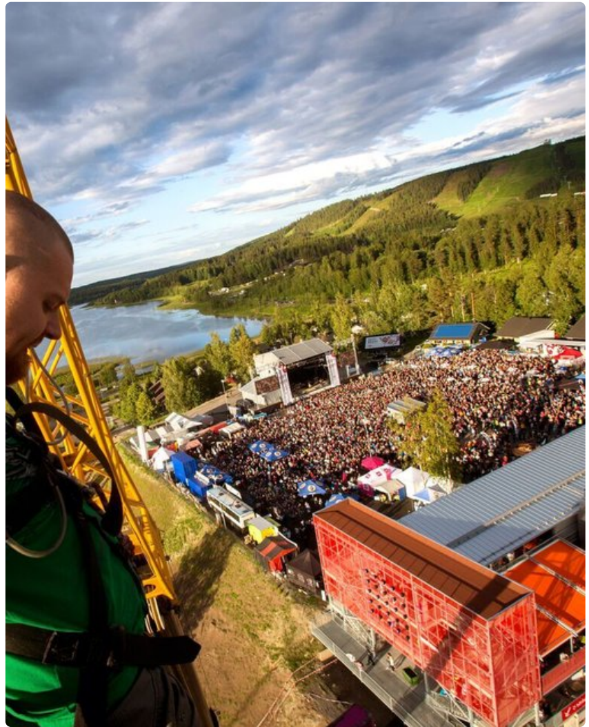
Kesäisin Himoksen kansoittaa festivaalikansa.

Himoksen alueelle kertyy vuosittain keskimäärin 200 000 majoitusvuorokautta.