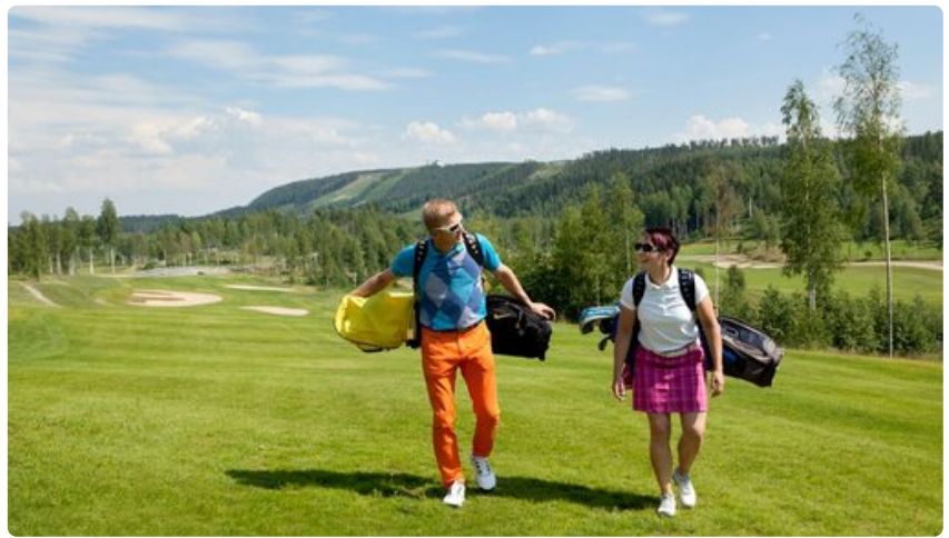
Himos on eteläisen Suomen suosituimpia golf-keskuksia.

Vireillä oleva satama ja satamakylähanke Pääjärven rannalla mahdollistavat myös veneilijöiden saapumisen Himokselle tulevaisuudessa.