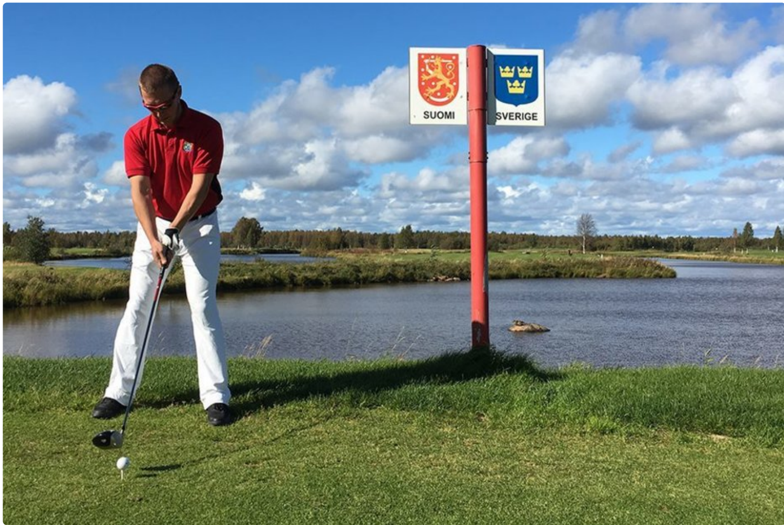
Golfia pelataan kahdessa maassa samanaikaisesti,