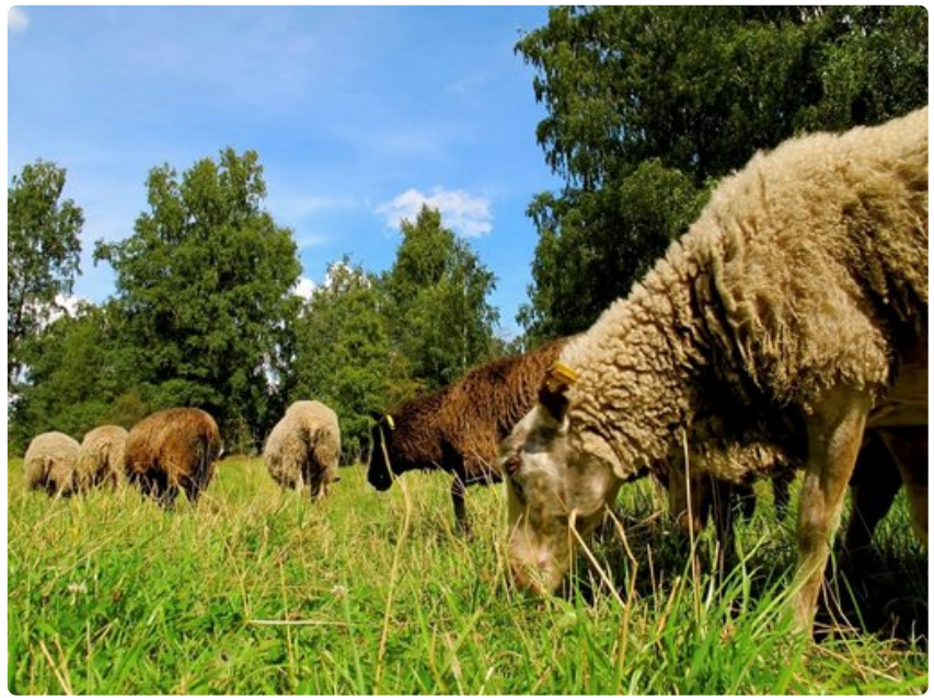
Lampaat laiduntavat kesäisin Vehmaaniemessä.