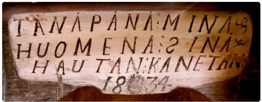
"Tänään minä, huomenna sinä, hautaan kannetaan", on kirjattu ruumiinkantopaareihin vuodelta 1834.