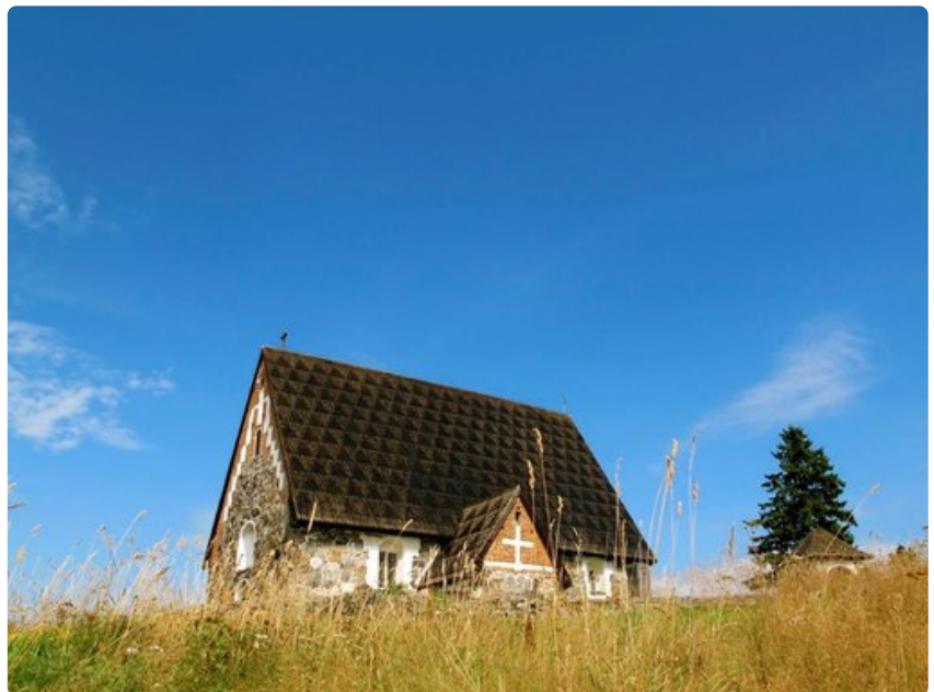
Tyrvään Pyhän Olavin kirkko on yksinkertaisuudessaan näyttävä ilmestys.