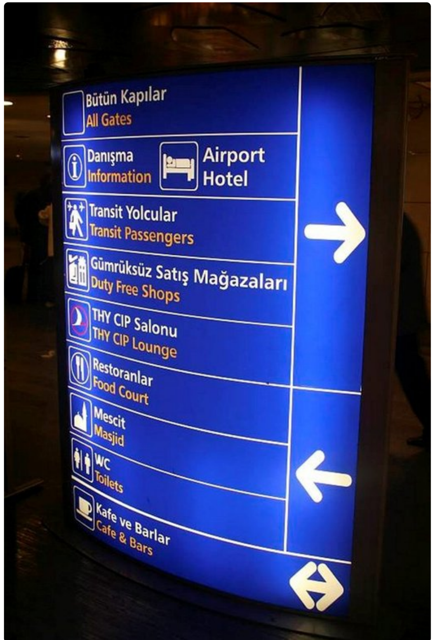
Veritulppa ei synny pelkästään lentämisestä, vaan siihen vaikuttavat monet tekijät.