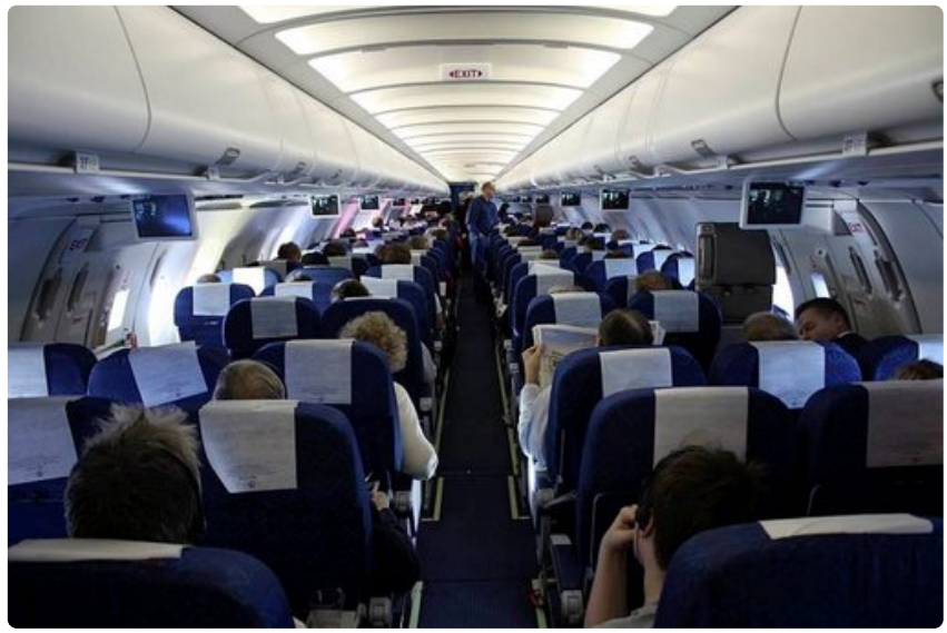
Lennon aikana tulisi tehdä nilkka- ja pohjejumppaa.

Lennon aikana ei liikkuminen ole helppoa, mutta yrittää pitää. Pohje- ja nilkkajumpppaa voi harjoittaa paikalla istuen parin tunnin välein. Vessassa kannattaa käydä useammin kuin on asiaa. Pikku vinkkinä voi sanoa, että mene vessaan silloin kun siellä on mahdollisimman pitkä jono. Jonossa voi sitten tanssahdella silläkin uhalla, että se näyttää omituiselta. Monet tottuneet maailmanmatkaajat tekevät niin.