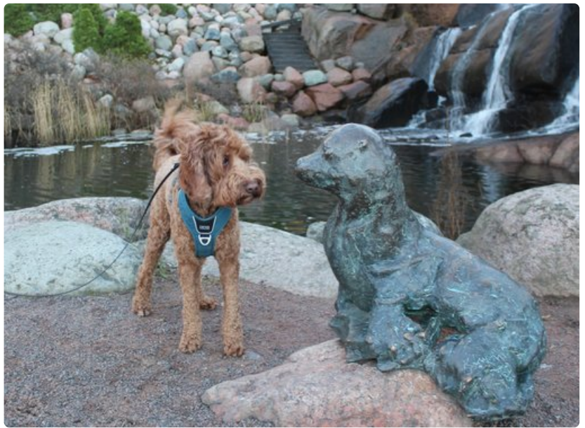
Sapokan vesipuisto on rentouttava paikka ihmisille ja koirille. Kivielläimetkin kiinnostivat karvatassua.

Raku-koiran kanssa on siellä hauska kierrellä ja tavata muitakin koiranulkoiluttajia. Koiran huomio kiinnittyi muun muassa useisiin eläinaiheisiin kivipatsaisiin. Niille voi hiukan muristakin ilman mitään vastamurinaa.