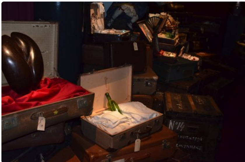
Näyttely Wellamossa on avoinna tammikuulle saakka.