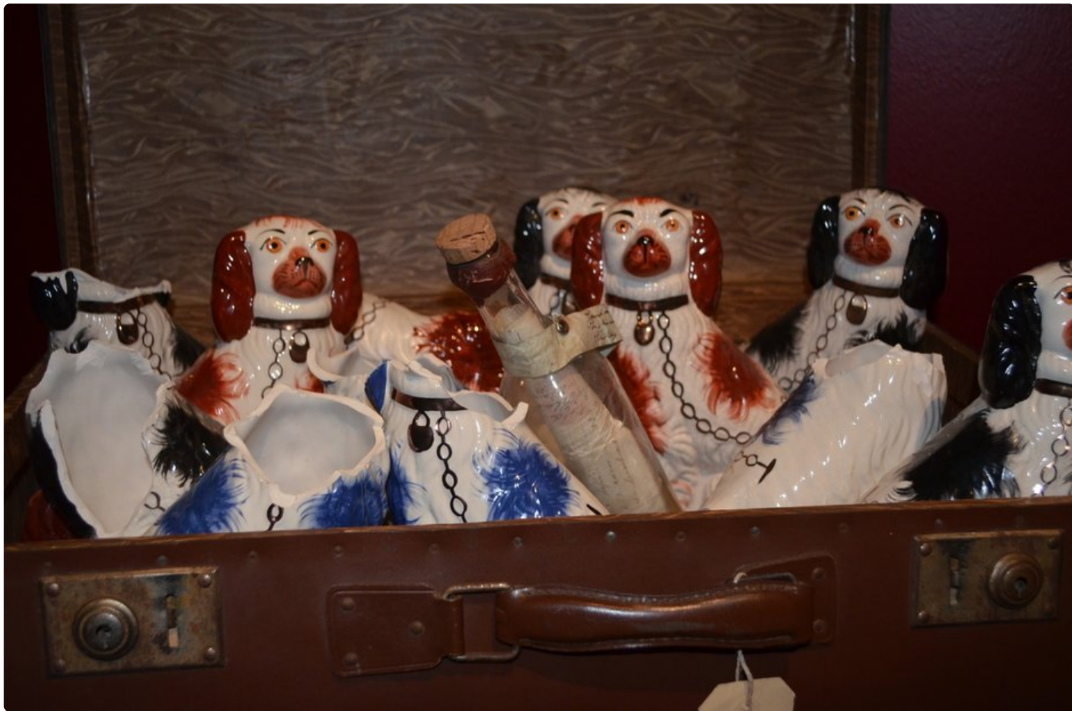
Merimiehen koirat odottivat kotona.