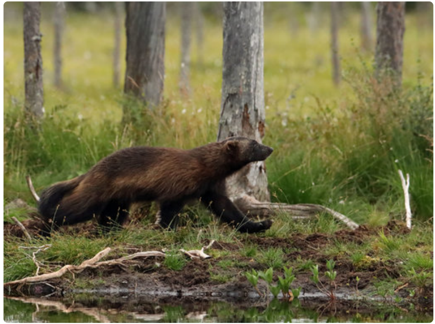
Ahma on kuvaus- ja katselukojuilla karhuja ja susia harvinaisempi vieras.