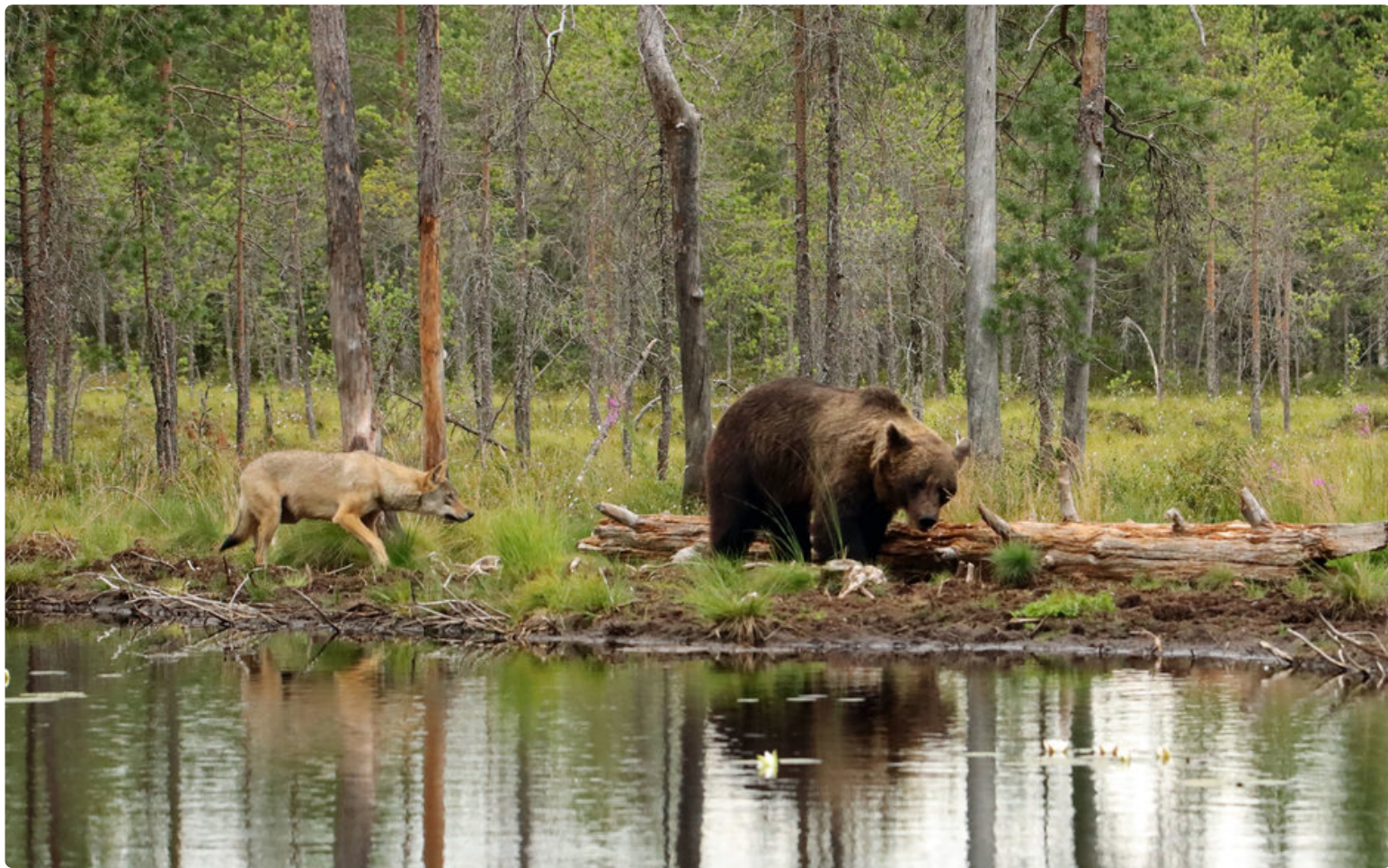
Karhun ja suden välinen rauhaisa rinnakkaiselo on harvinaista. Kuhmossa sellainenkin voi tapahtua.