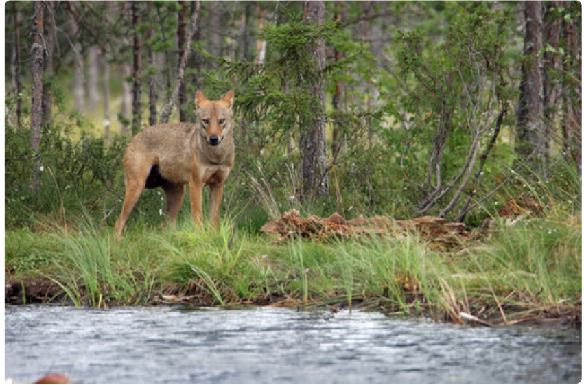
Susi eli harmaasusi voi nimestään huolimatta olla väritykseltään hyvinkin vaalea, kuten kuvan nuori susi.