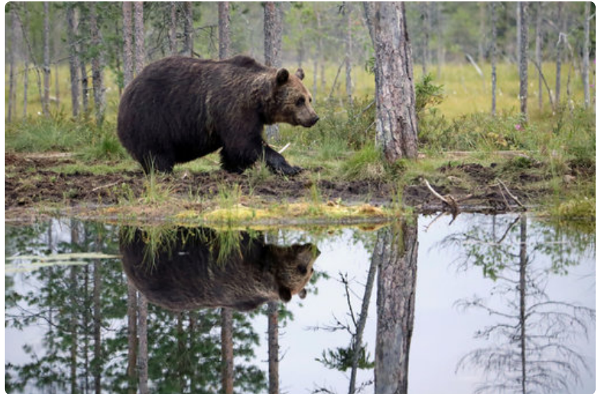
Karhu peilautuu erämaalammen tyveneeseen pintaan.