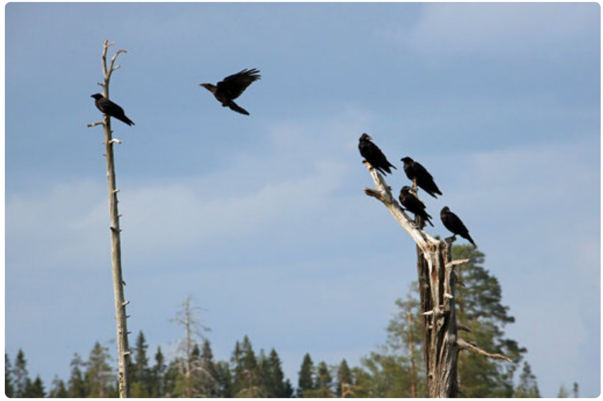
Ensimmäisenä ilmestyvät korpit metsäbuffetin kelopuihin odottamaan ateriaa.

Seuraavana yönä suolammen rannalla olevilla koujuilla on sen sijaan enemmänkin liikennettä.