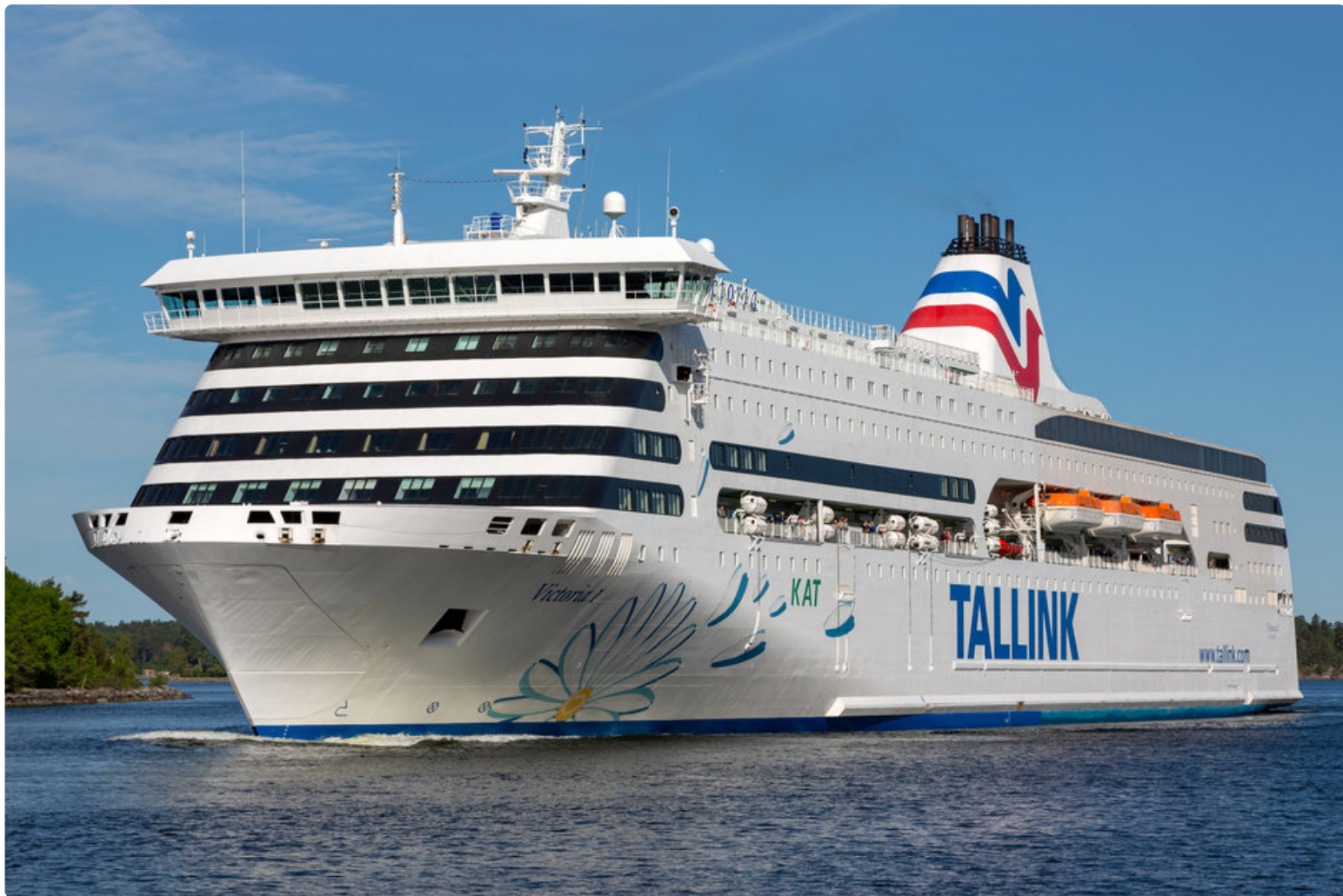
Kuvituskuva: Kuvassa Tallinkin Victoria.